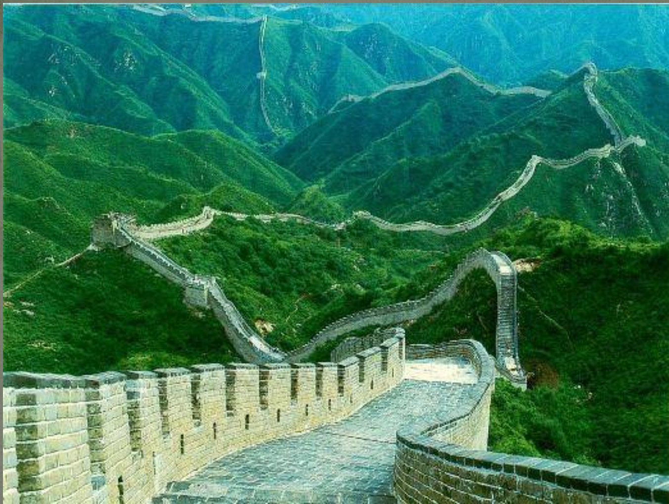
Великая китайская стена