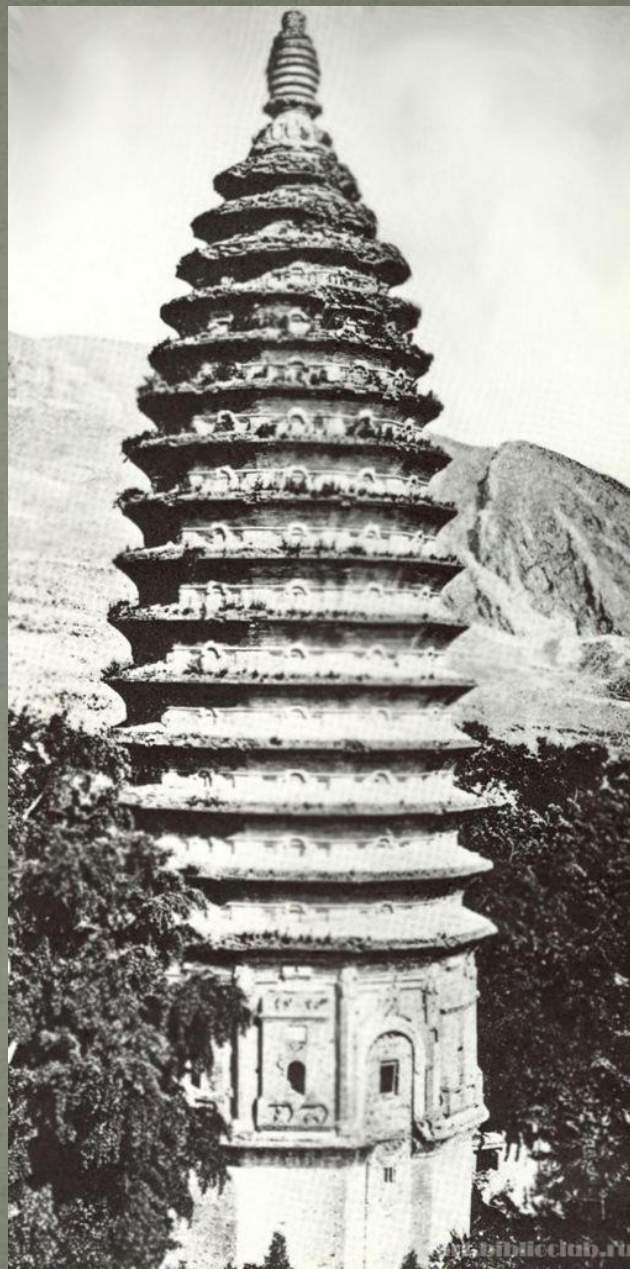
Пагода Суньюэсы в Хэнани

Деревянные храмы и многоярусные башни — пагоды, напоминающие о знаменитых событиях и святынях, живописно располагались в гористых местах среди густой зелени. Поднимаясь по крутым тропинкам, путники, еще не видя пагод, слышали нежный звон колокольчиков, подвешенных к углам крыш. По горбатым мраморным мостикам, переброшенным через тихие водоемы, расположенные в цветущих рощах, путники попадали в места уединения и тишины. Эти замечательные памятники искусства древнекитайских зодчих можно и сейчас увидеть во многих живописных уголках страны. Наиболее красивые из них: пагода Суньюэсы в Хэнани (VI в.), Даяньта (пагода Диких гусей) в Сиани (VII в.), пагода Тигровой горы в Сучжоу (X — XI вв.) и др.