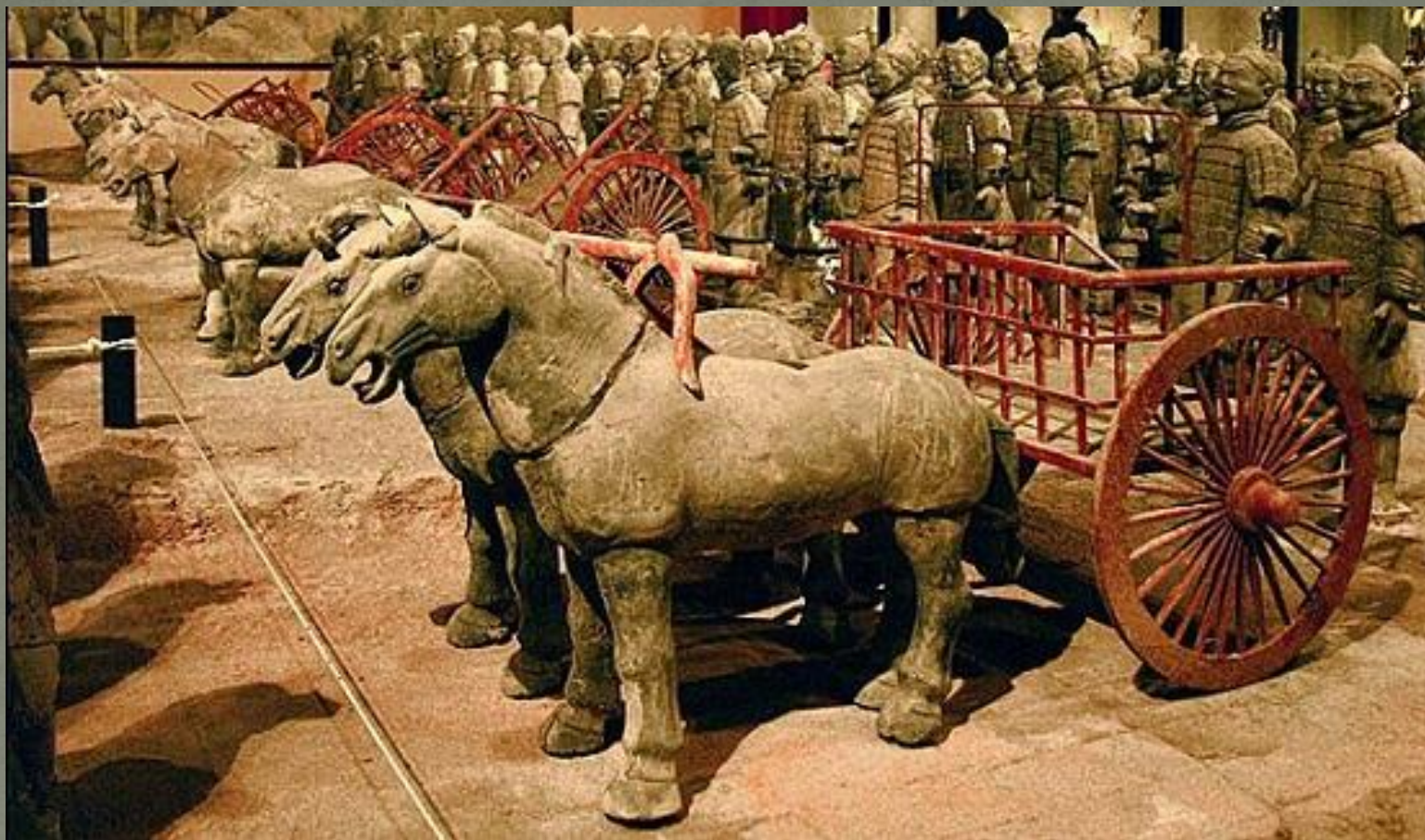
Терракотовая армия императора Цинь Шихуанди