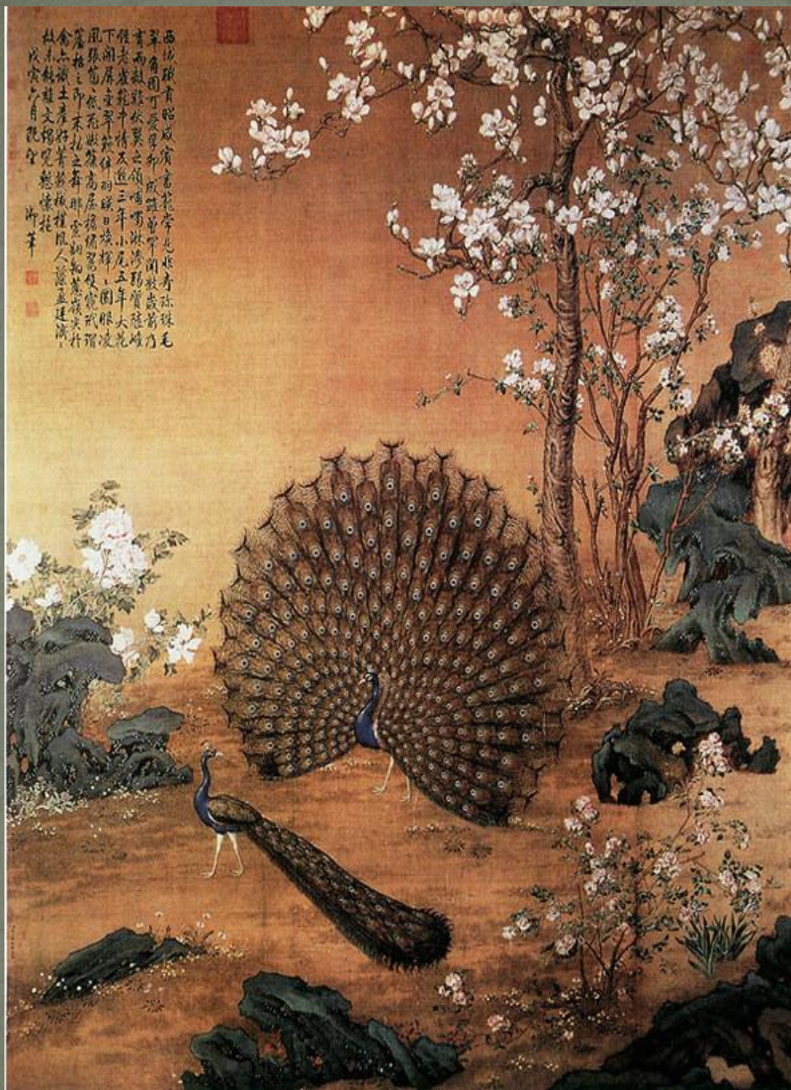
Картина ши нин ланг

История китайской культуры охватывает долгий 5000 лет. Историческое развитие Дальнего Востока и цивилизаций Китая создал много значимых предметов. В Китае создали первые звёздные карты и лунный календарь, изобретён компас, сейсмограф, бумага, чернила, техника лака, шёлк, фарфор. Китайская цивилизация помогла культурным традициям многих Восточных стран: Японии, Кореи, Индокитаю, Монголии.