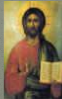
С. Ушаков, (1670)