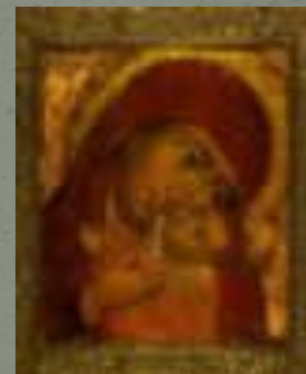
Богоматерь Владимирская (Византия, XII в)