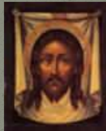
Новгородская школа, XII в. Успенский Собор, Москва