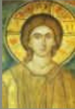
"Молодой Пантократор", фрагмент