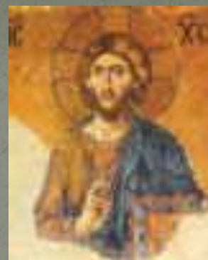
Собор Святой Софии. Константинополь, XII в. Мозаика.