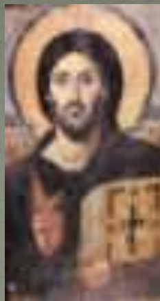
Монастырь Святой Екатерины (Афон). VI в. Энкаустика.