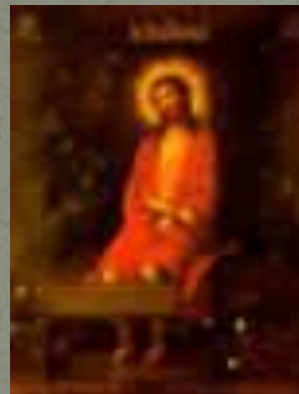
Современные иконы (Афон)