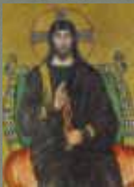
Церковь Сан-Аполинаре де Нуово в Равенне. VI в. Мозаика.