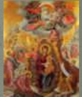
Богоматерь со святыми Феодором и Иоанном (Византия, VI Монастырь Хиландар, в)