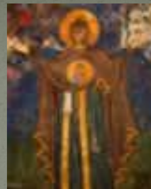
Великая Панагия Афона