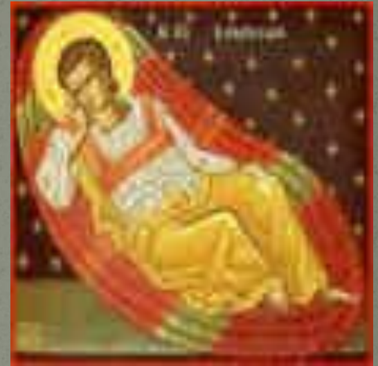
Современная икона, Афон