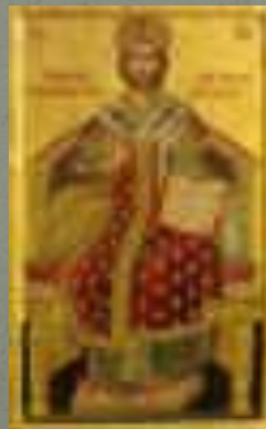
"Царь царей" Современная икона (Афон)