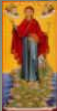
Великая Панагия "Шире небес"