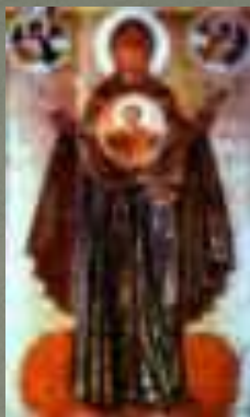
Великая Панагия Ярославская (XII в.)