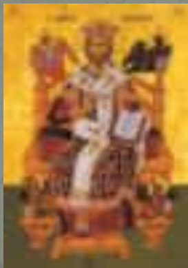
Афон (Греция), .