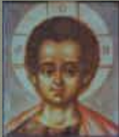
Симон Ушаков (1697)