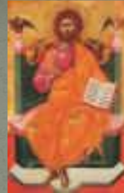
Россия (XVII в)