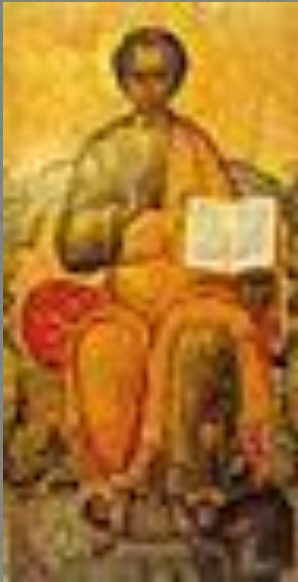
Икона из деревянного храма в Коломенском (1670)