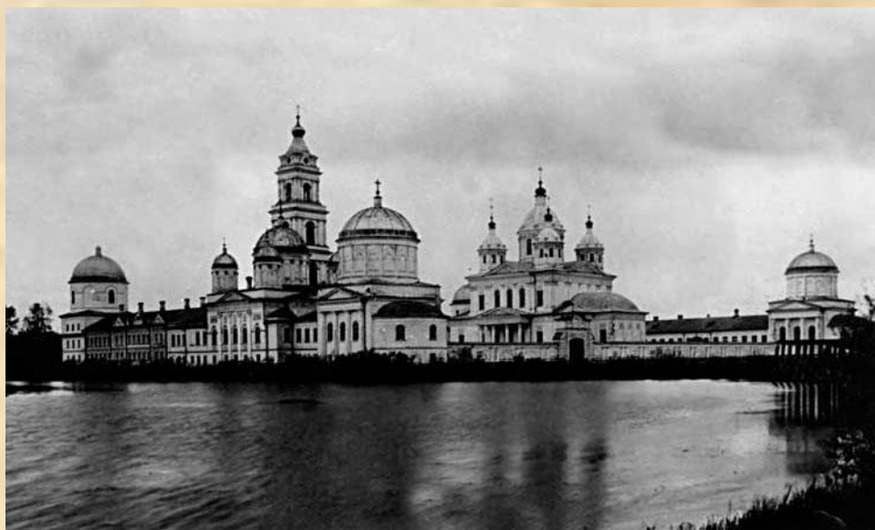
Юрская Дорофеевская пустынь