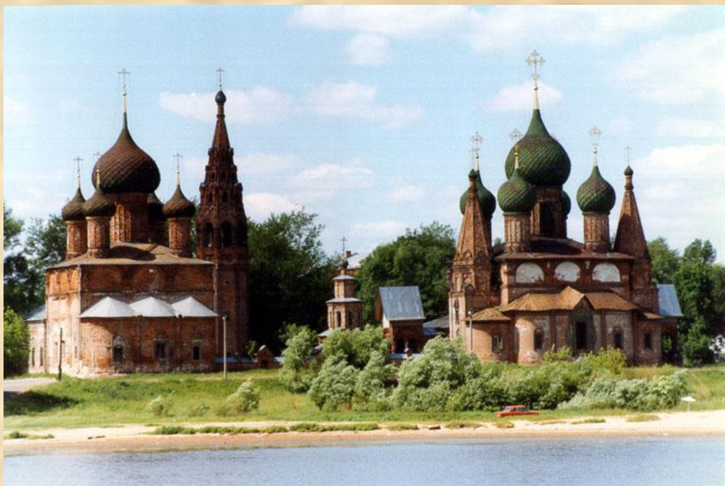
Николаевский приют. Церковь Троицы Живоначальной