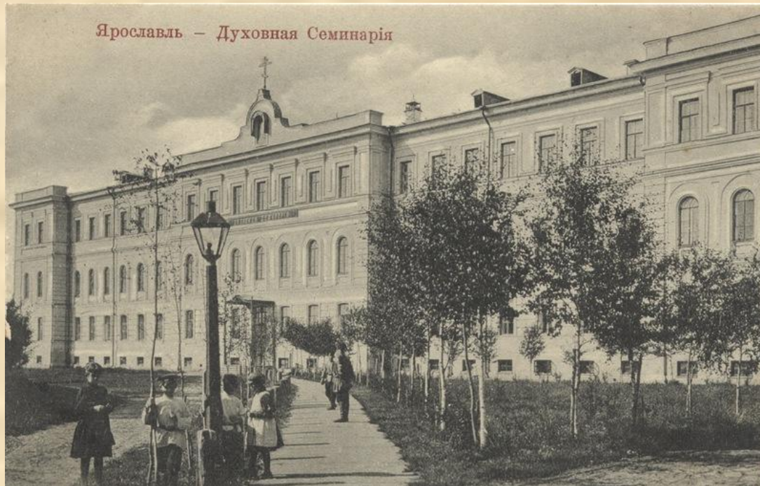
Ярославская духовная семинария