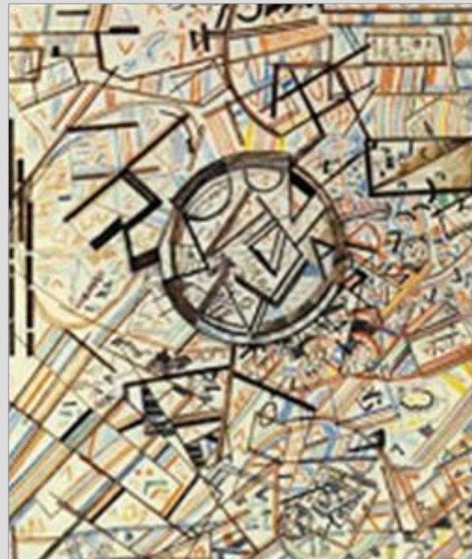
П. Филонов. Формула вселенной

Русский художник Павел Николаевич Филонов (1882—1941) выполнил в 20-е гг. XX в. графическую композицию — одну из «формул Вселенной». В ней он предугадал движение субатомных частиц, с помощью которых современные физики пытаются найти формулу мироздания.