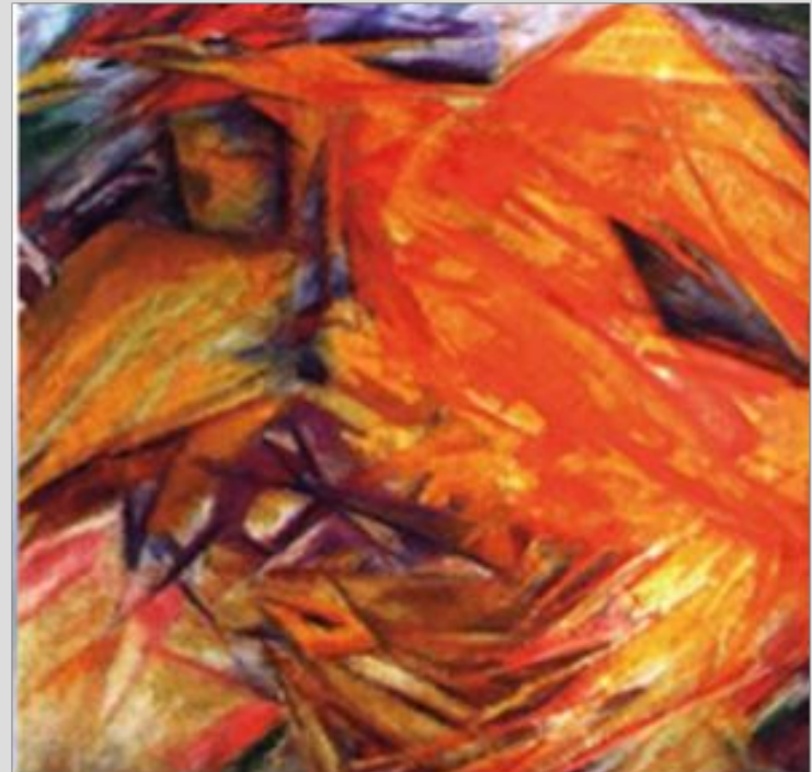
М. Ларионов. Петух (Лучистый этюд)

Под влиянием открытий радиоактивности и ультрафиолетовых лучей в науке русский художник Михаил Федорович Ларионов (1881—1964) в 1912 г. основал одно из первых в России абстрактных течений — лучизм. Он считал, что изображать надо не сами предметы, а идущие от них энергетические потоки, представляемые в виде лучей.