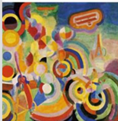
Р. Делоне. С уважением к Блерио

Абстрактный цветовой ритм возбуждал эмоции зрителей. Взаимопроникновение основных цветов спектра и пересечение криволинейных поверхностей в работах Делоне создают динамику и истинно музыкальное развитие ритма. Одним из первых его произведений стал цветной диск, по форме напоминающий мишень, но цветовые переходы составляющих его соседних элементов имеют дополнительные цвета, что придает диску необычайную энергию.