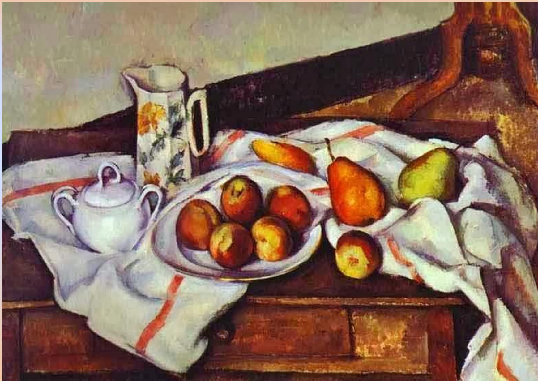
П. Сезанн. Натюрморт с драпировкой. 1899