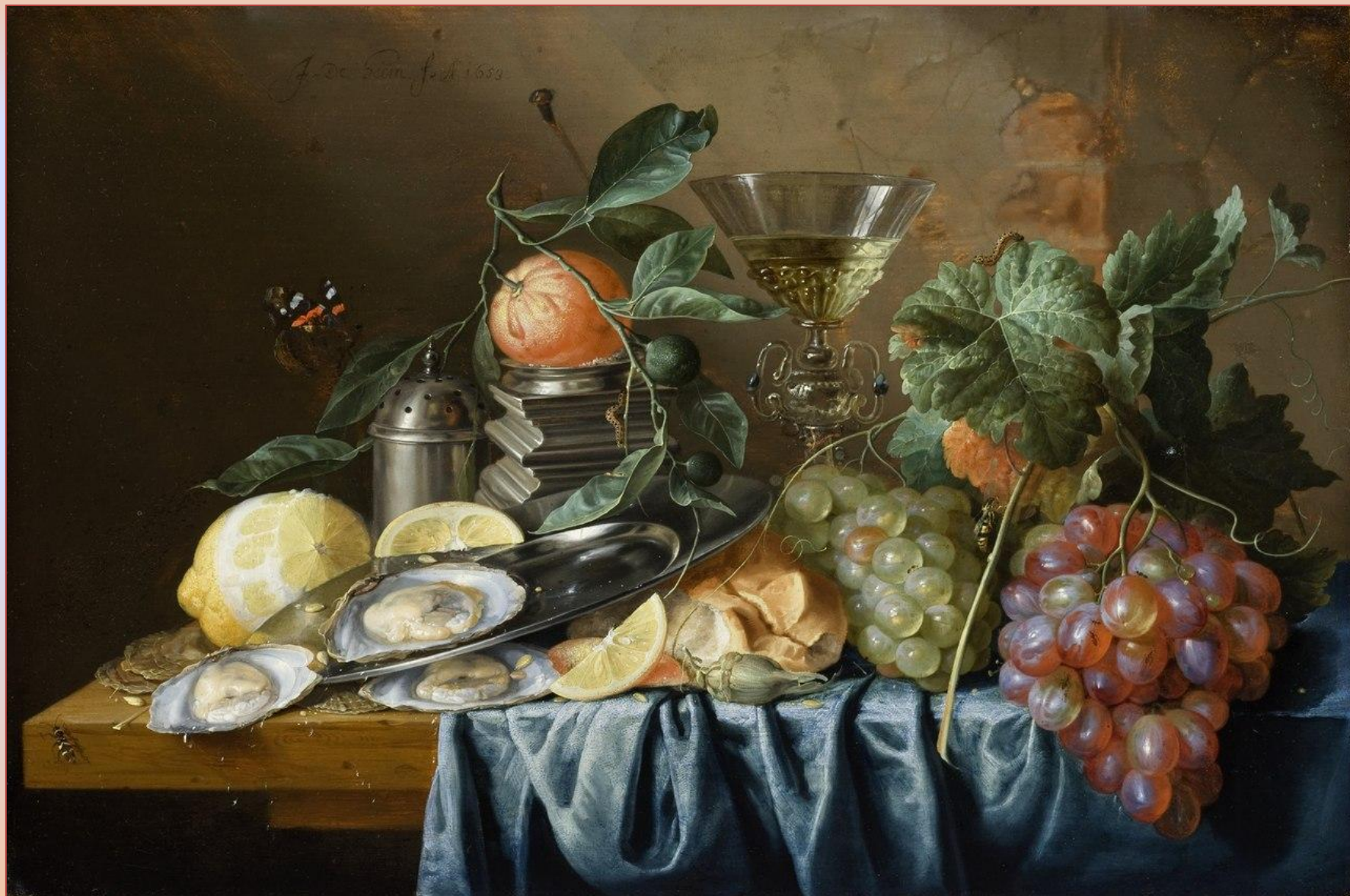
Ян Давидс де Хем. Натюрморт с устрицами и виноградом. 1653