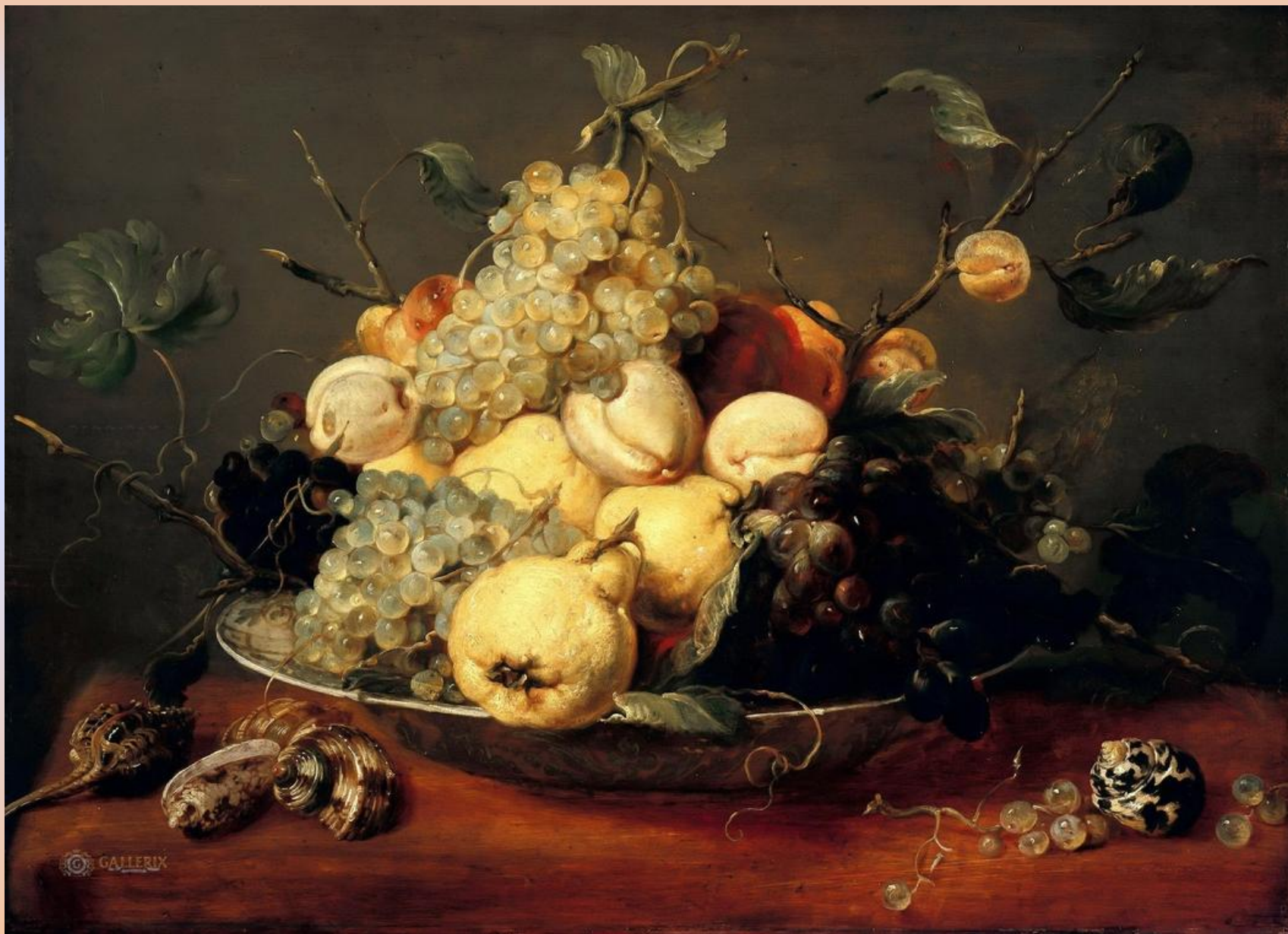
Франс Снейдерс. Натюрморт с тарелкой фруктов. 1657