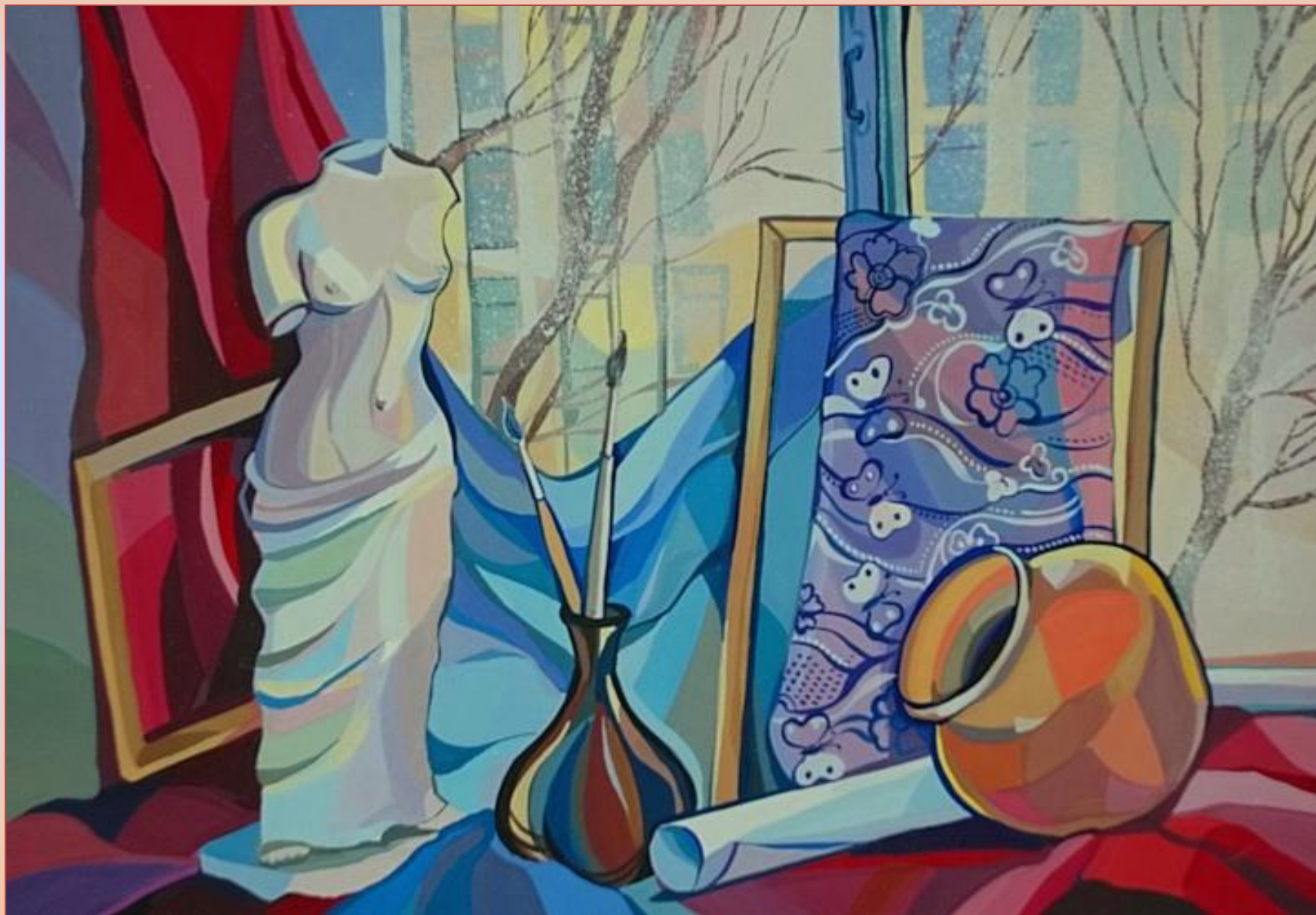
Намаконова Евгения. Декоративный натюрморт