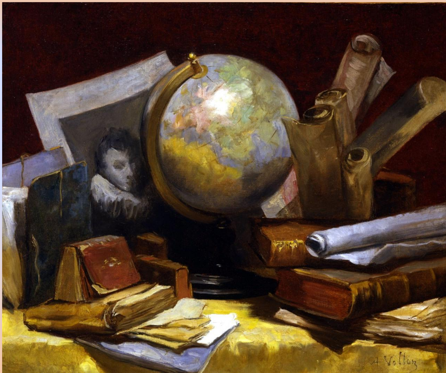
Антуан Воллон. Натюрморт с глобусом и книгами