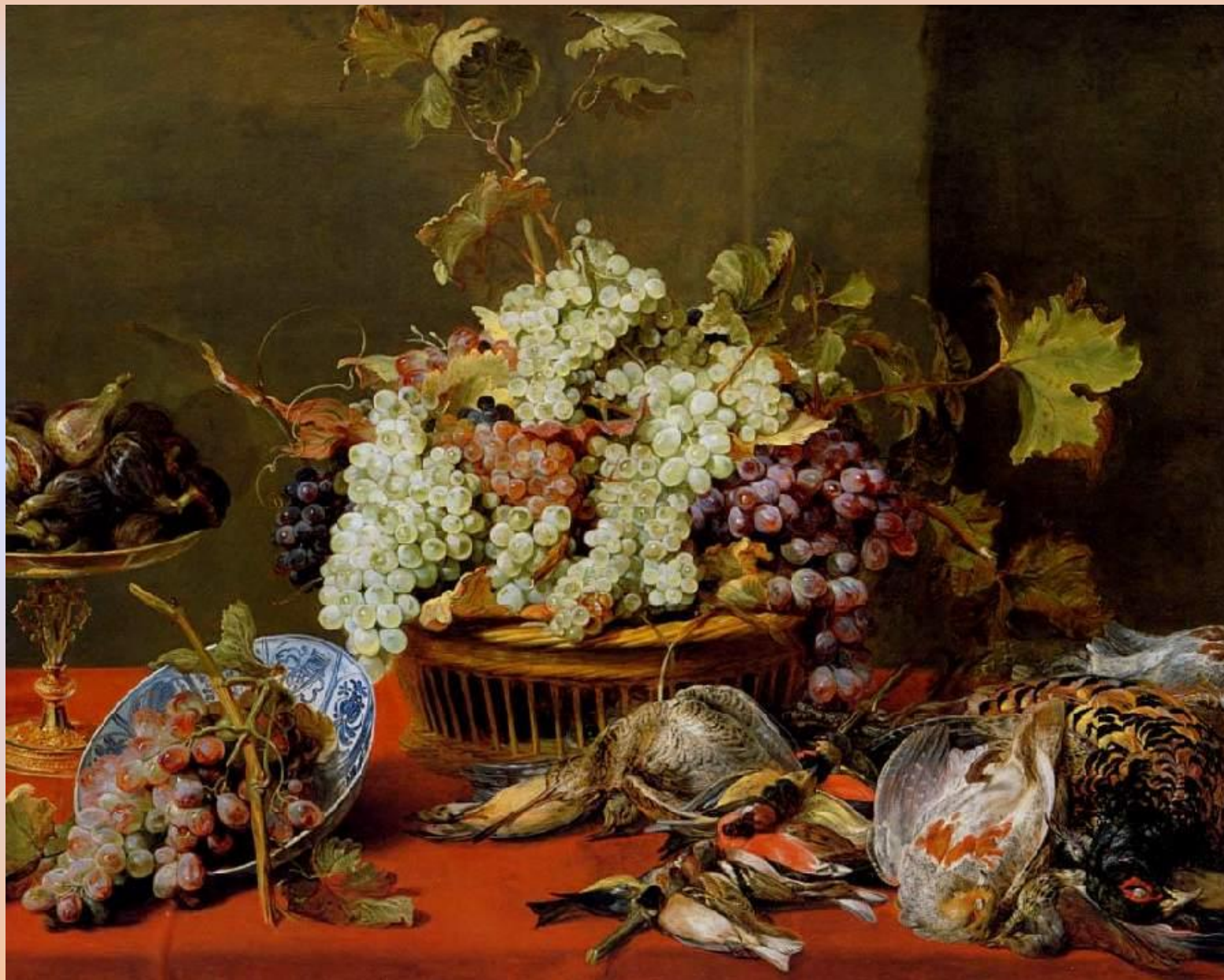
Франс Снейдерс. Натюрморт с корзиной винограда. 1660