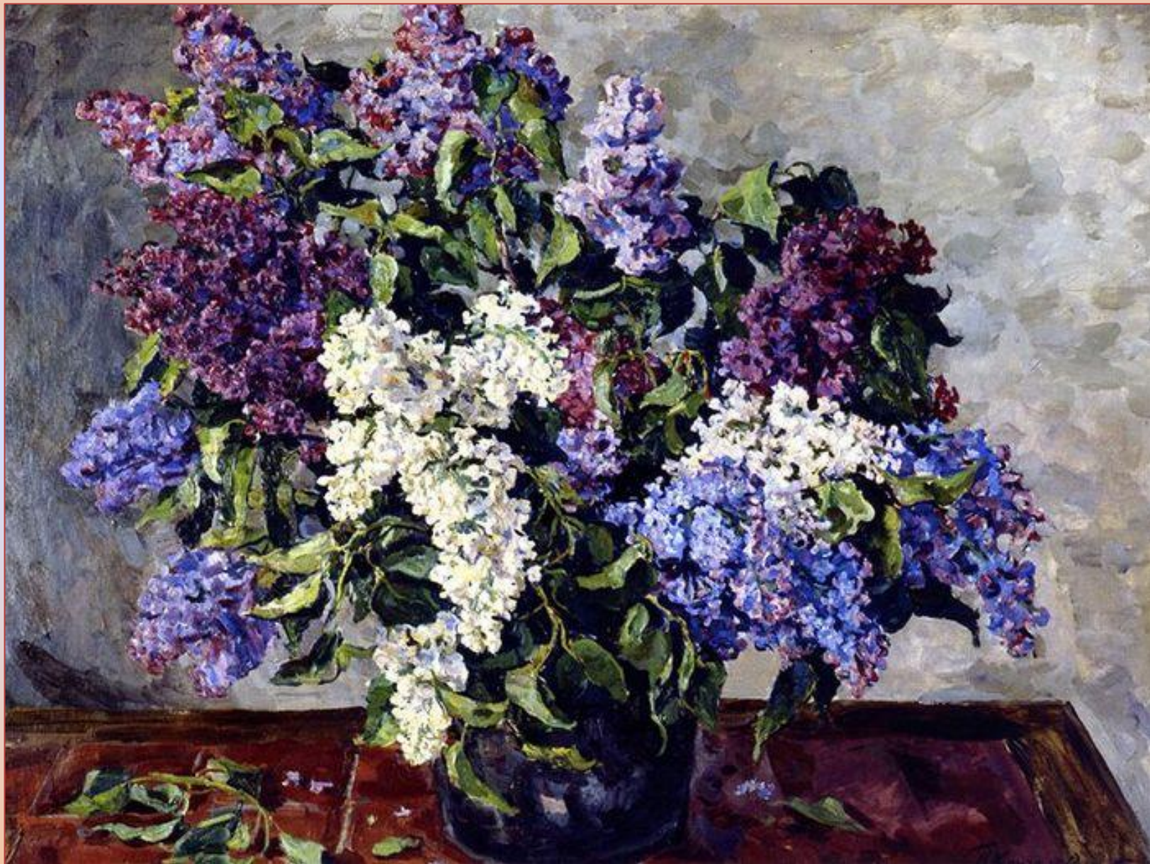
Петр Кончаловский. Сирень в ведре.