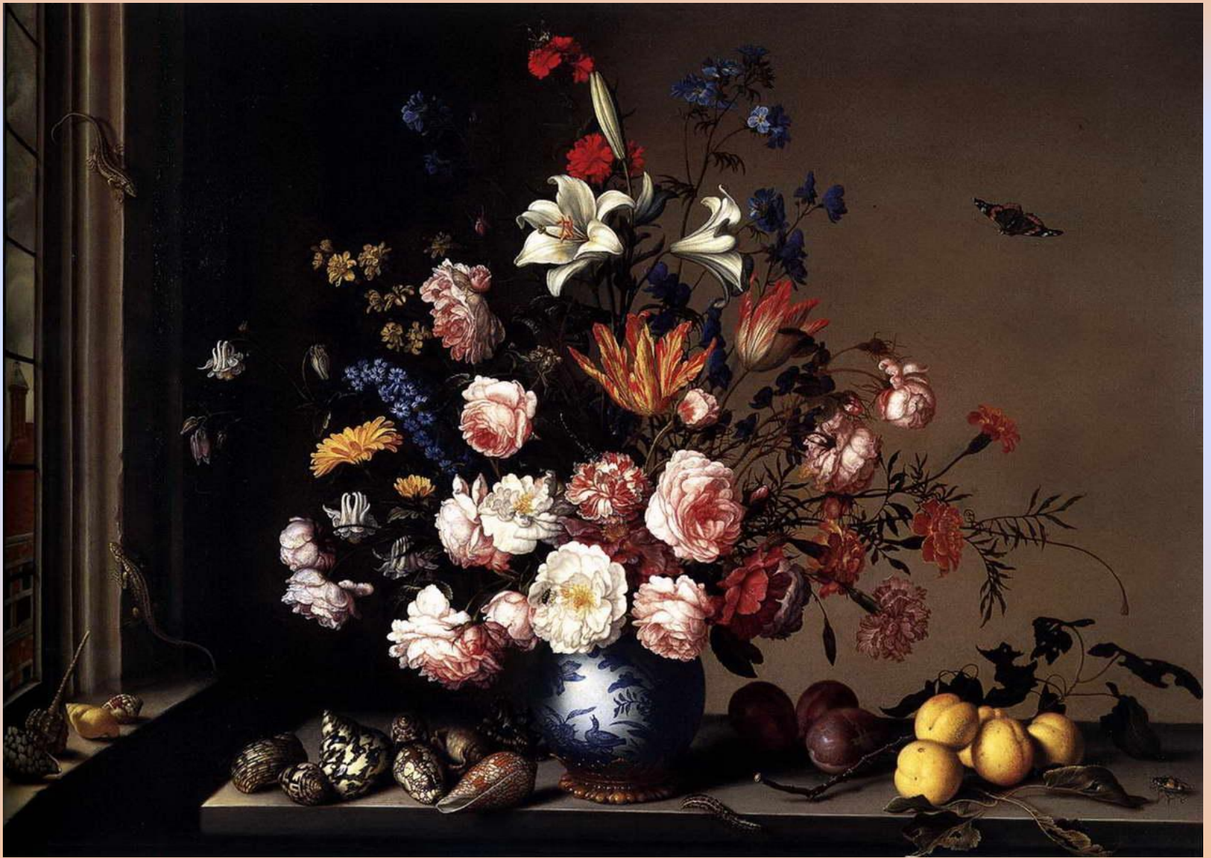
Балтазар ван дер Аст. Ваза с цветами у окна. 1650