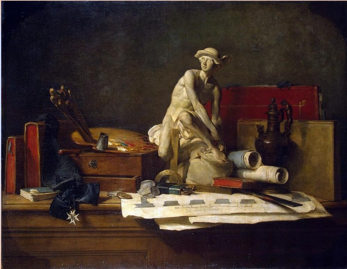
Ж. Б. С. Шарден. Натюрморт с атрибутами искусств. 1766