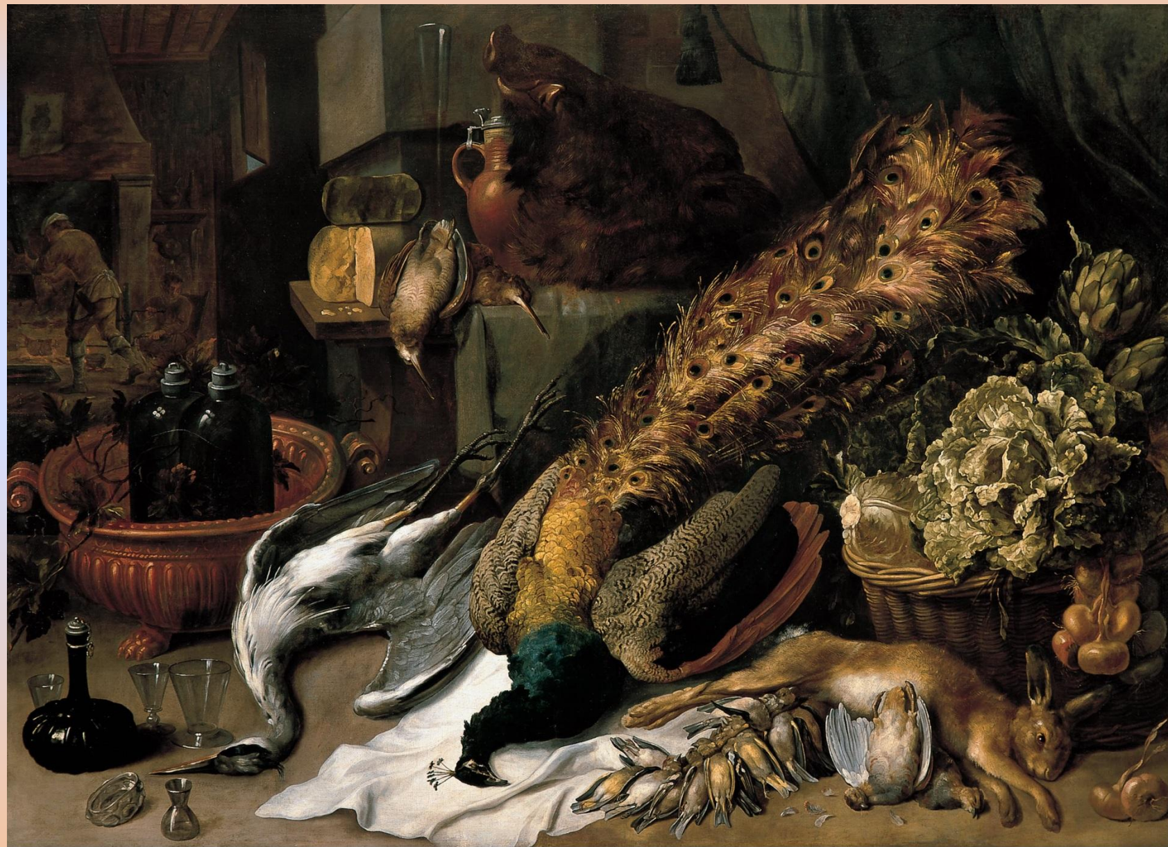
Франс Снейдерс. Натюрморт с битой дичью.