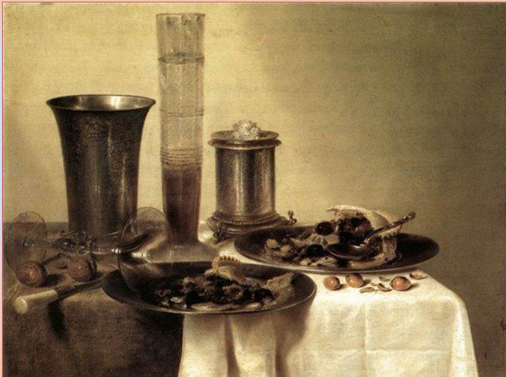
Виллем Клас Хеда. Десерт. 1637