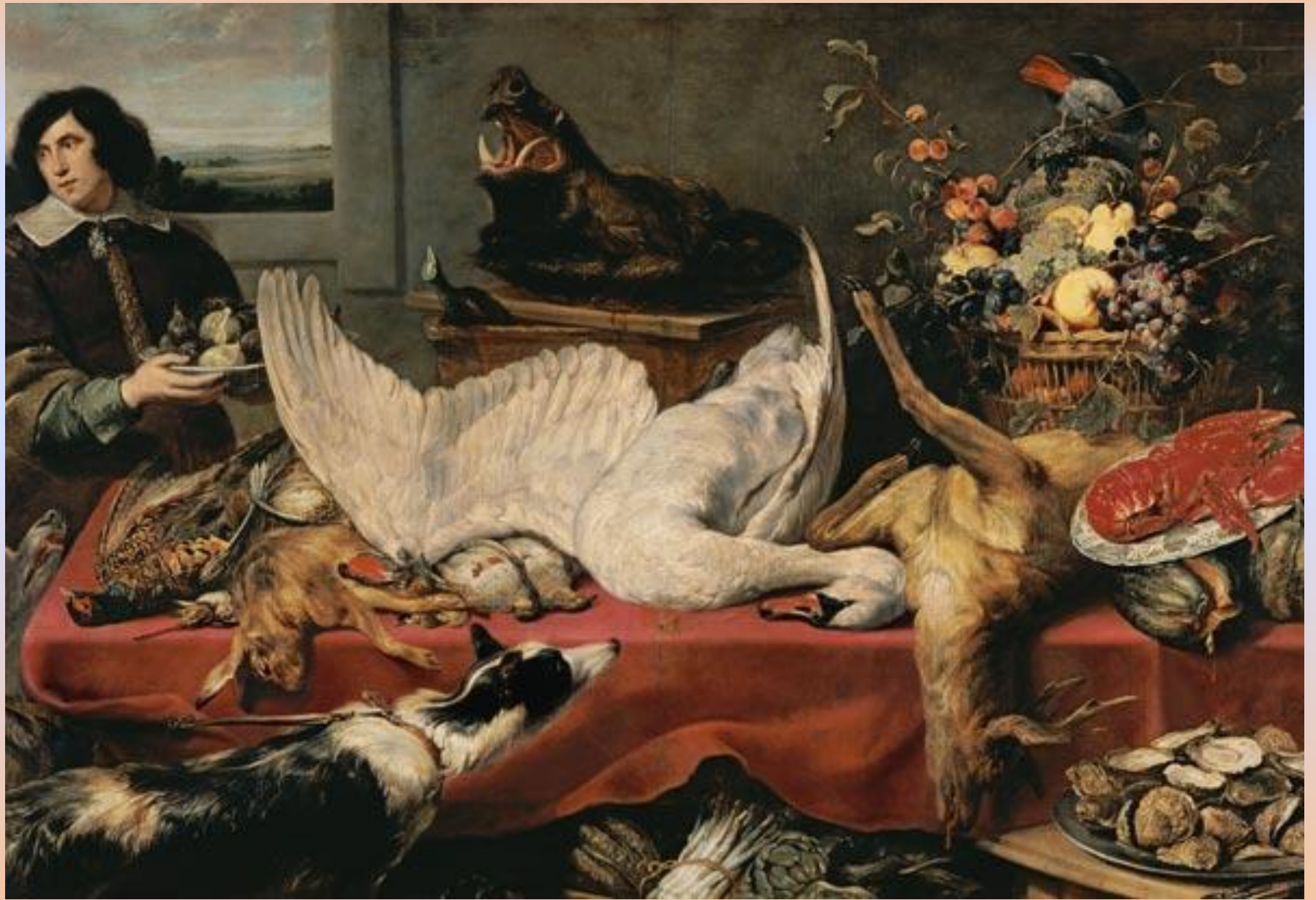
Франс Снейдерс. Натюрморт с лебедем. 1640-е