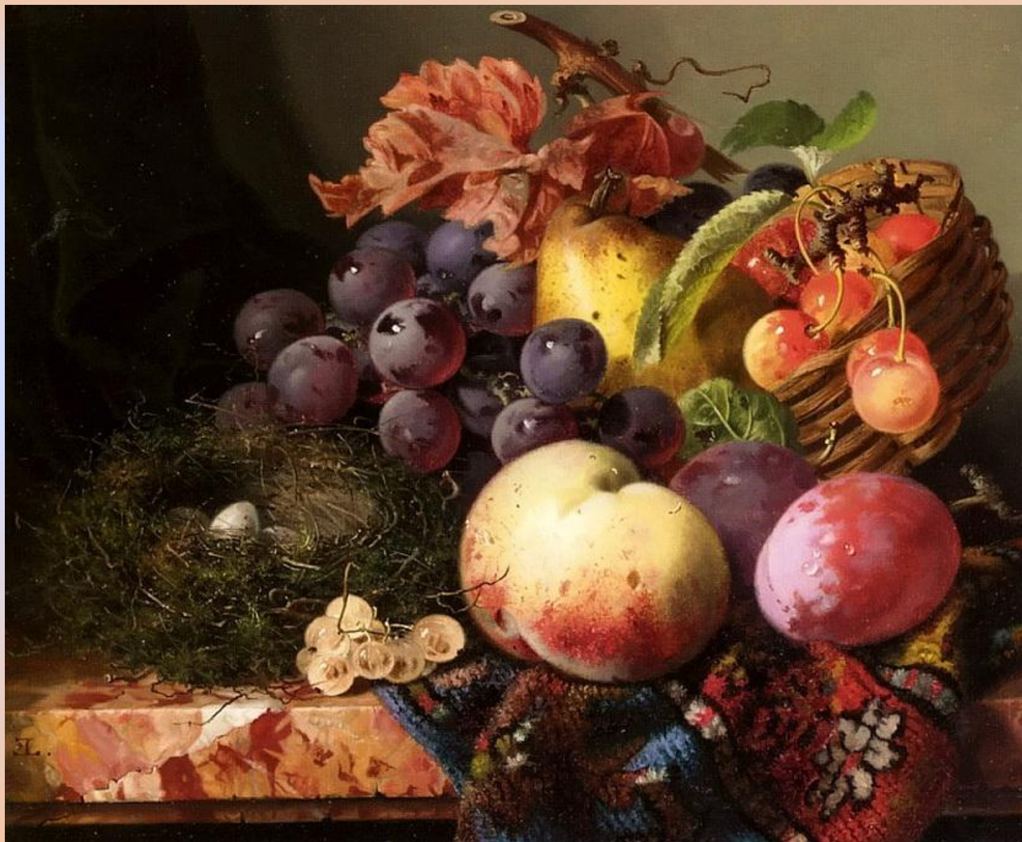
Эдвард Ладелл. Натюрморт с гнездом птицы. 1800-е