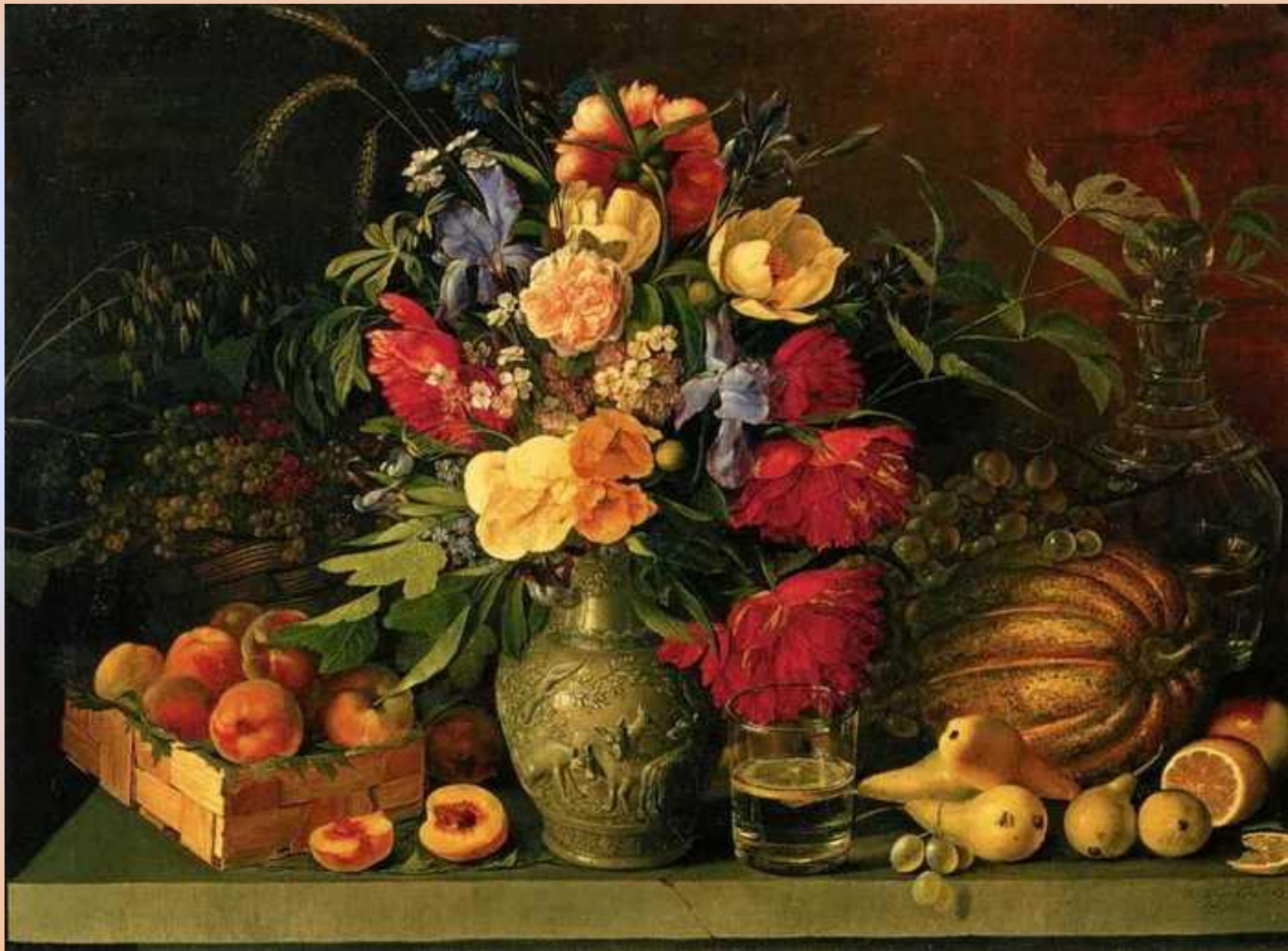
Т. Хруцкий. Плоды и цветы. 1836