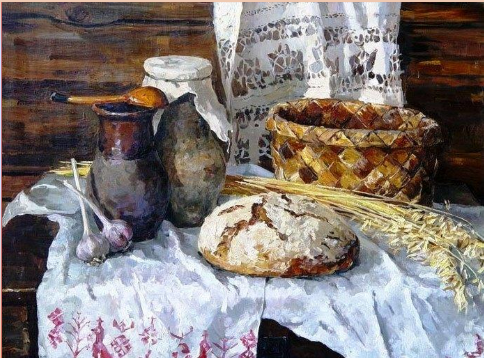
Кирилл Дацук. Хлеб