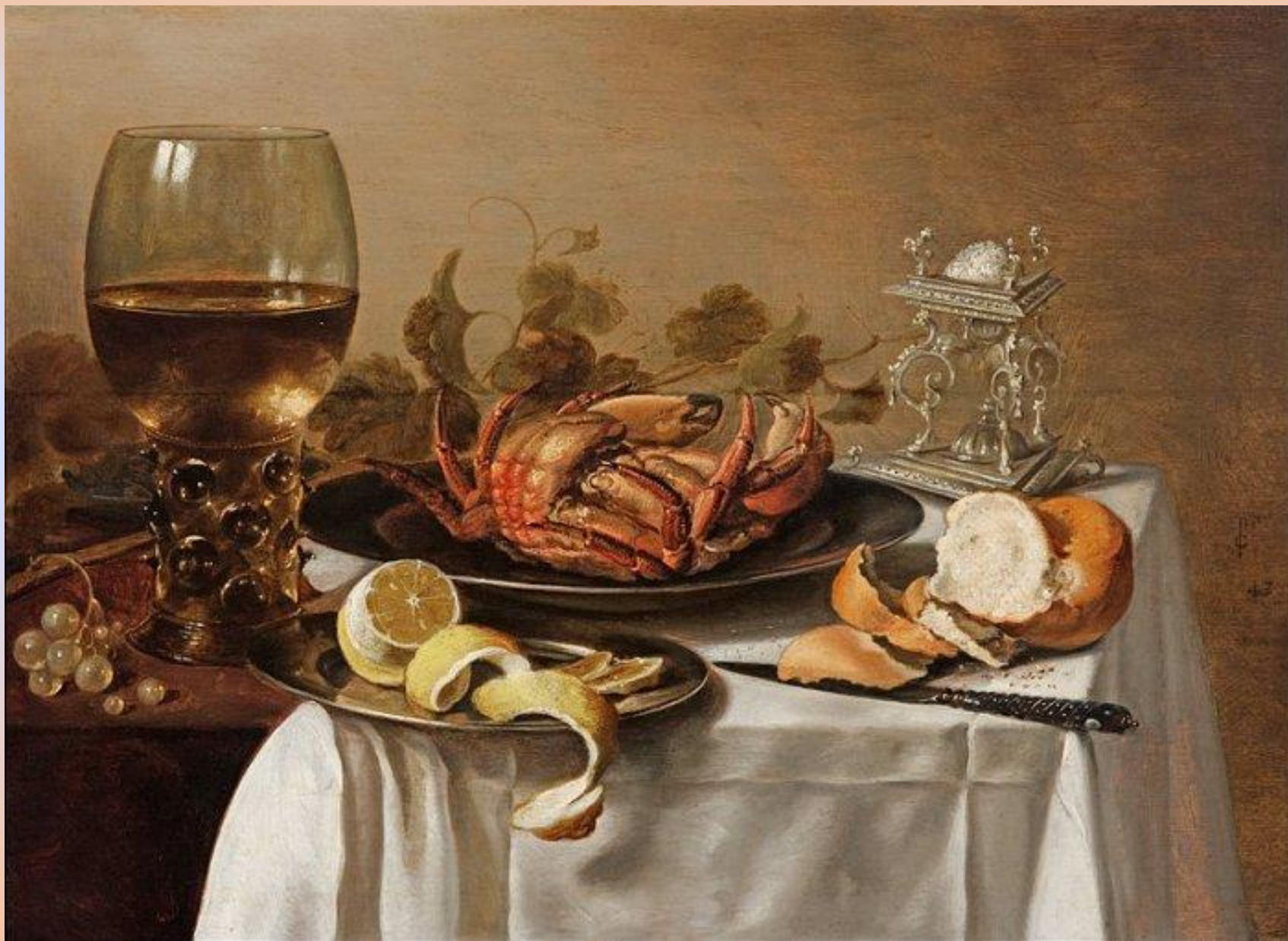
Питер Клас. Натюрморт с крабом. 1643