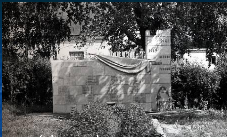
(сфотографирован в настоящее время)