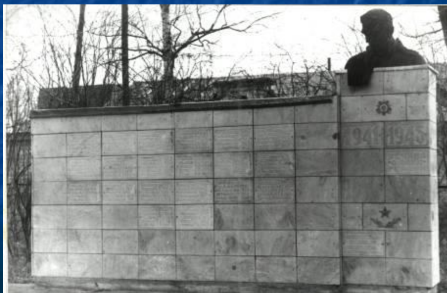
(сфотографирован во время сооружения)