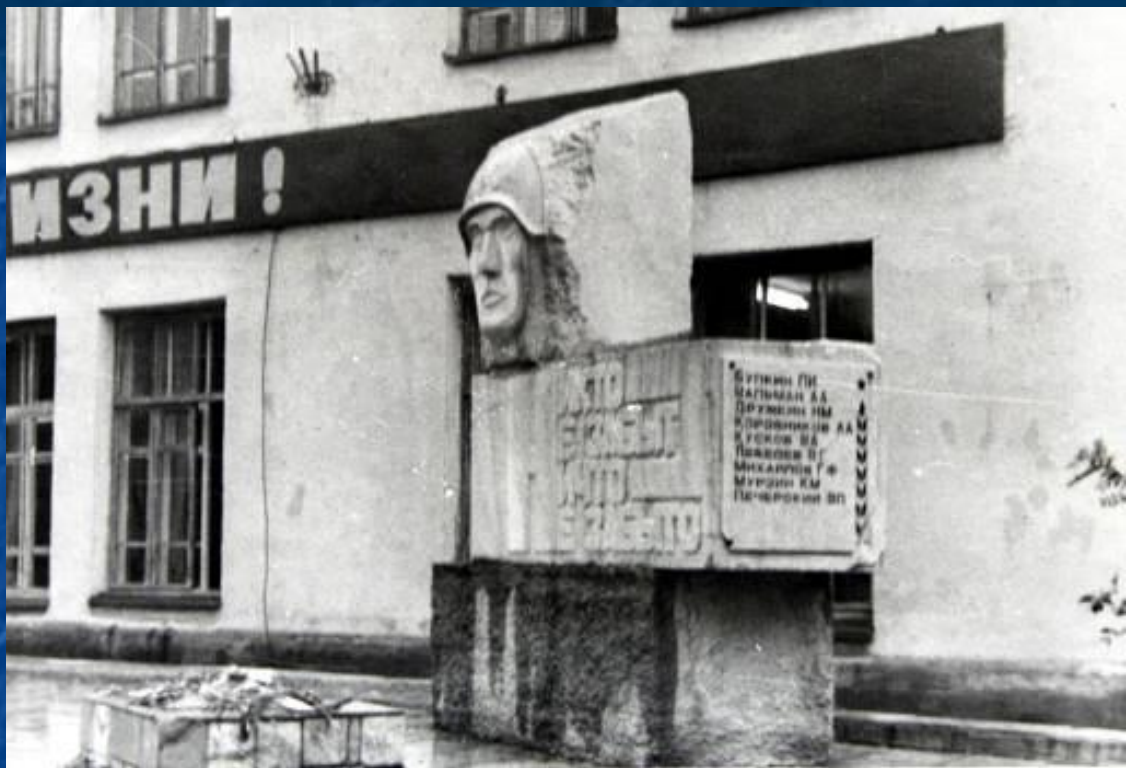
Автор – Косолапов В. Г.

Нет, никто не забыт И ничто не забыто. Сколько пало в сражениях Наших славных ребят! Но остались в сердцах Молодых поколений И на мраморных плитах Имена их горят.