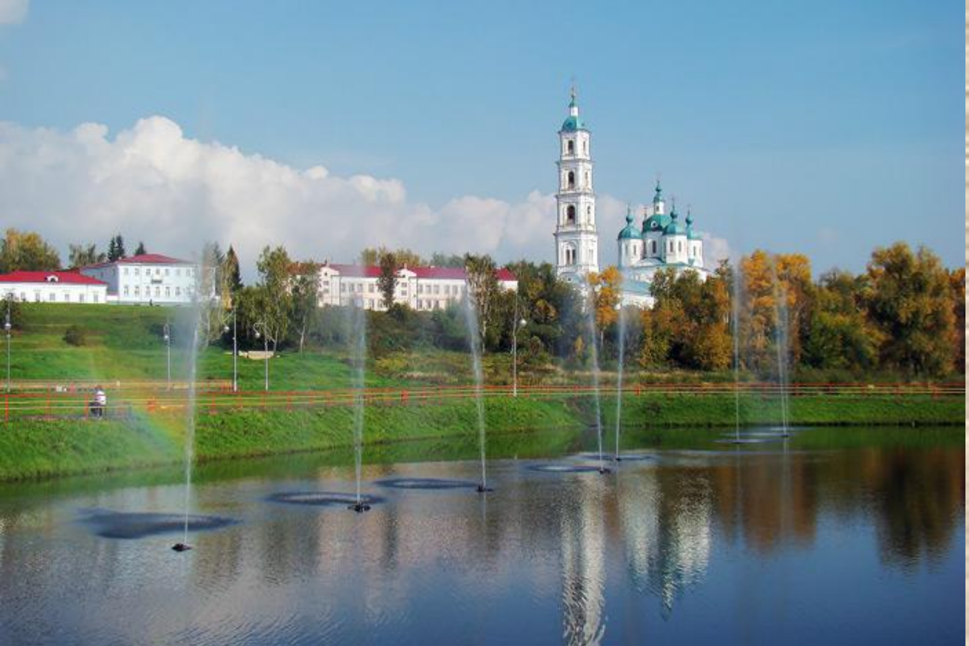
Шишкинские пруды в Елабуге