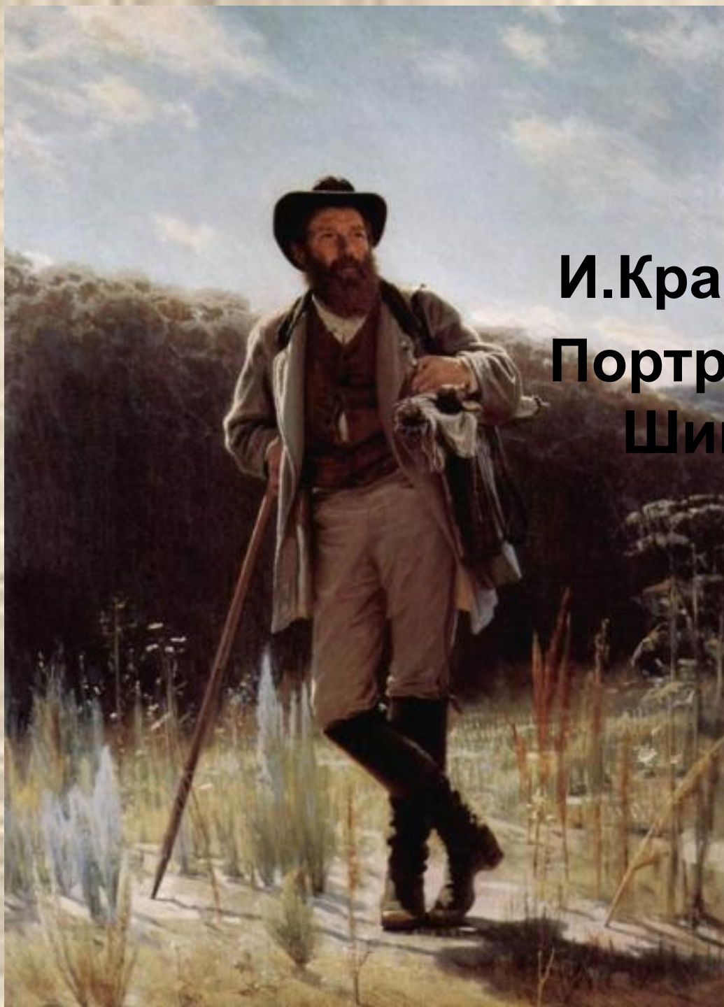
И.Крамской. Портрет И.И. Шишкина