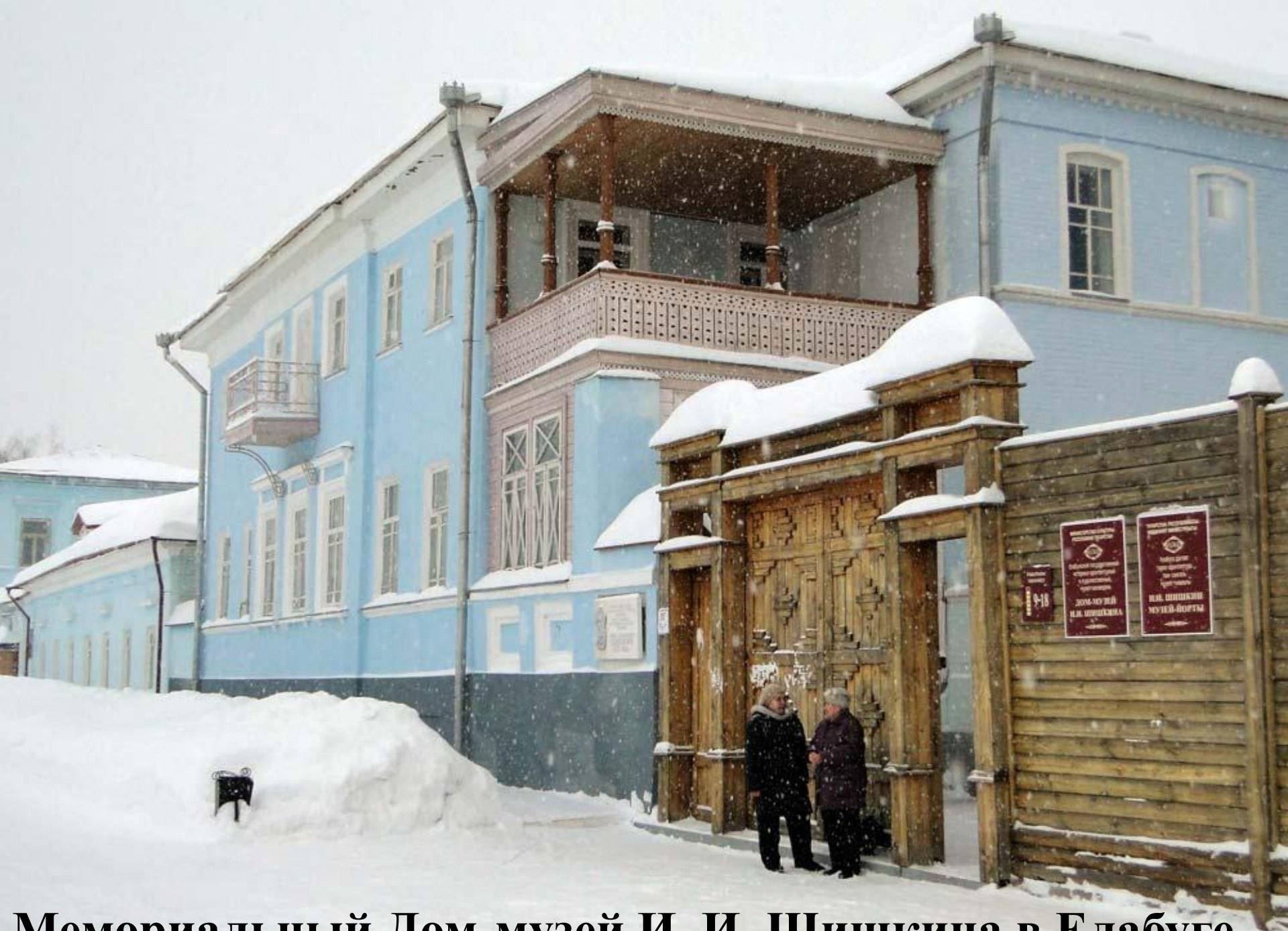
Мемориальный Дом-музей И. И. Шишкина в Елабуге