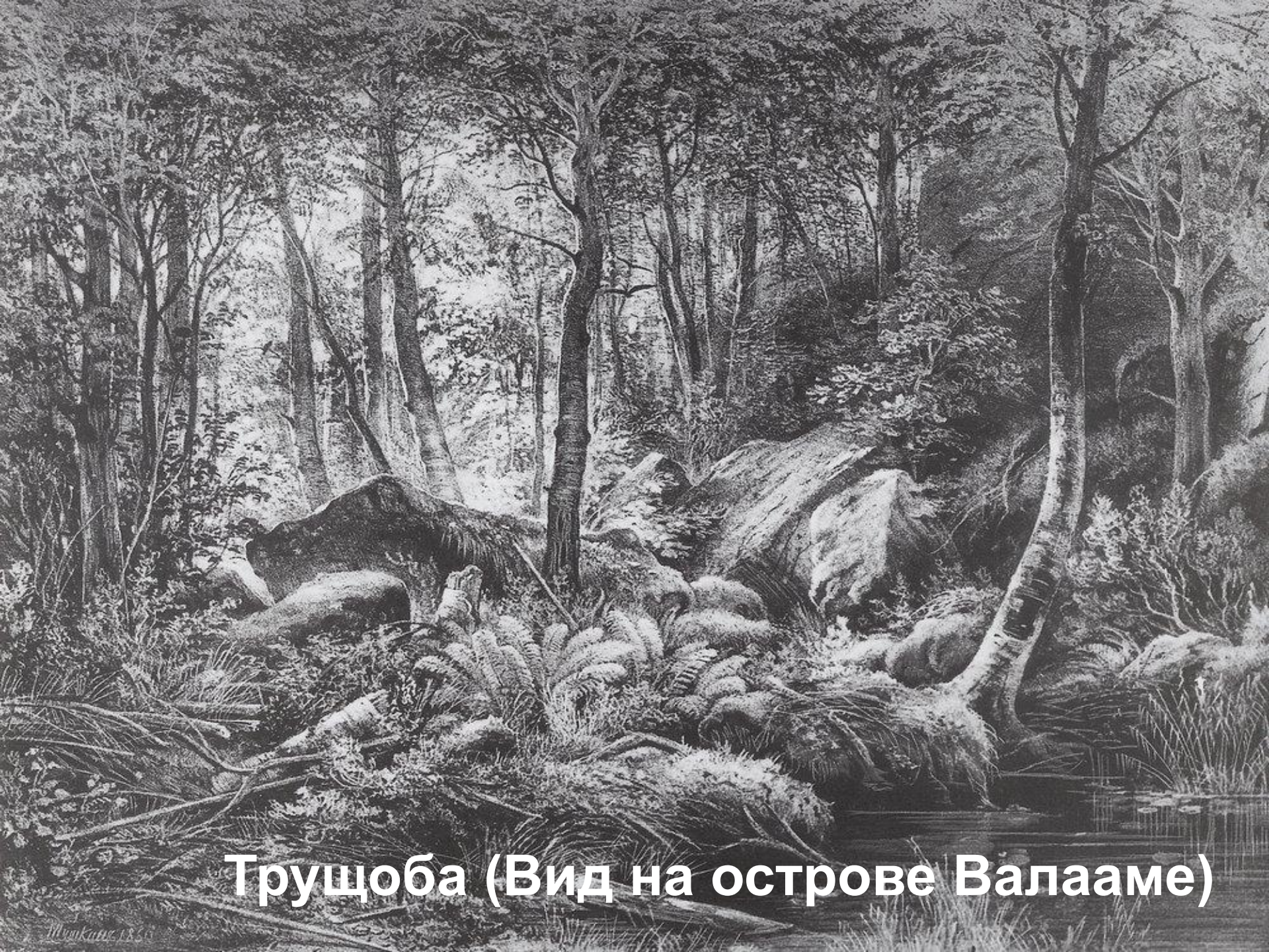
Трущоба (Вид на острове Валааме)