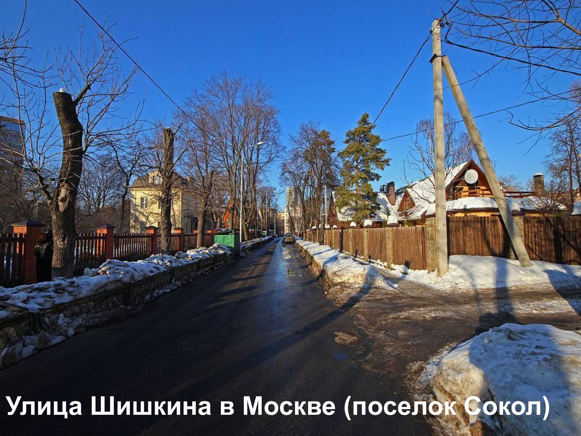
Улица Шишкина в Москве (поселок Сокол)