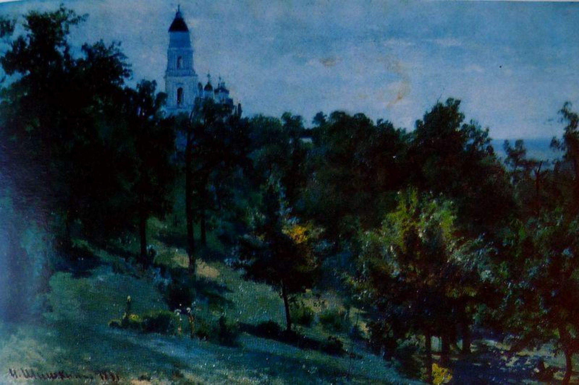
И.И. Шишкин. На острове Валааме.