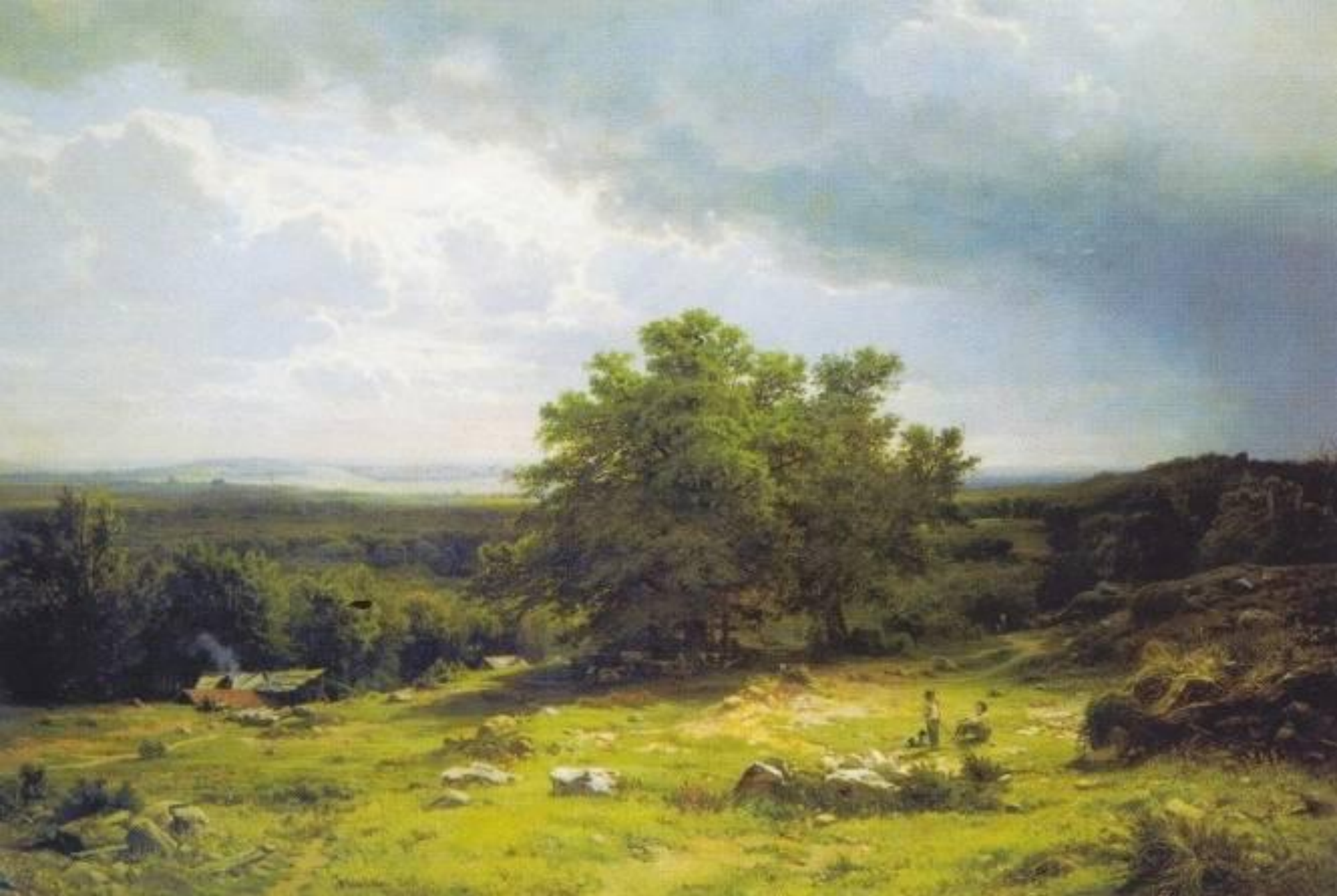
И.И. Шишкин. Вид в окрестностях Дюссельдорфа