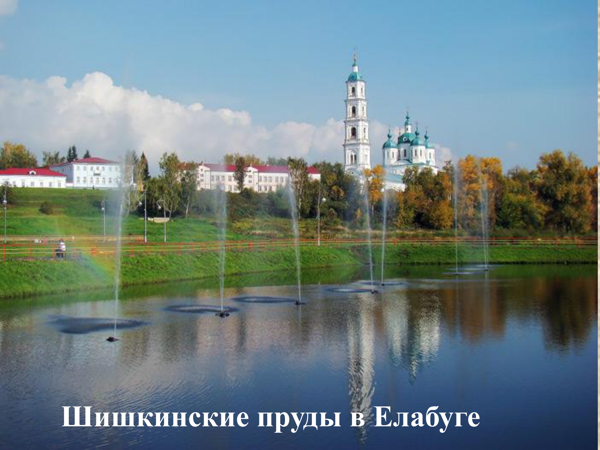
Шишкинские пруды в Елабуге