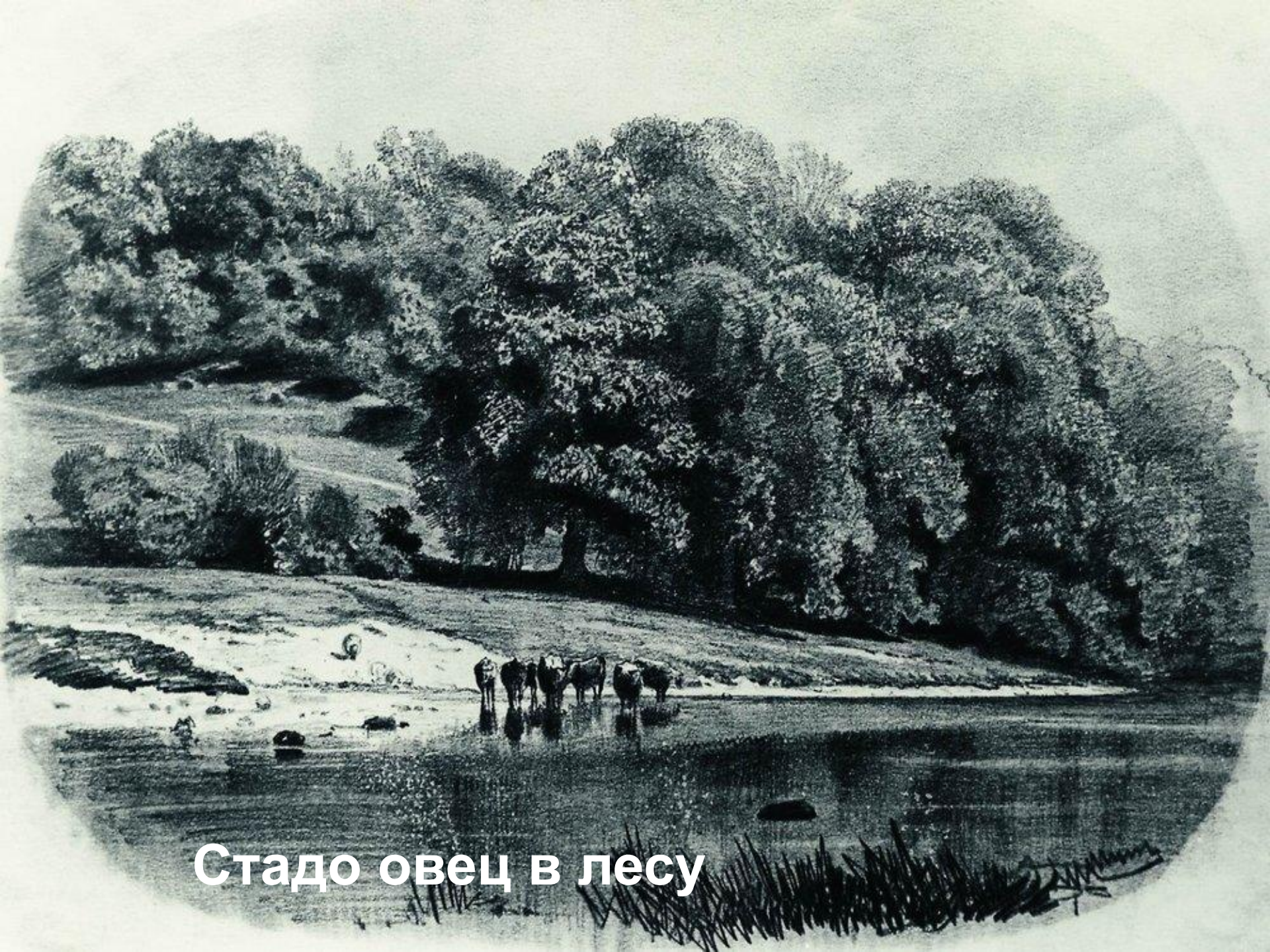
Стадо овец в лесу