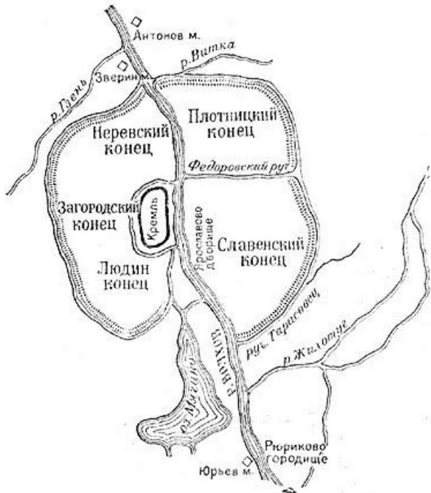
План средневекового Новгорода

Используя перо и тушь, начертите план-схему средневекового города. Передайте характерные черты русского, европейского и восточного средневекового города (по выбору).