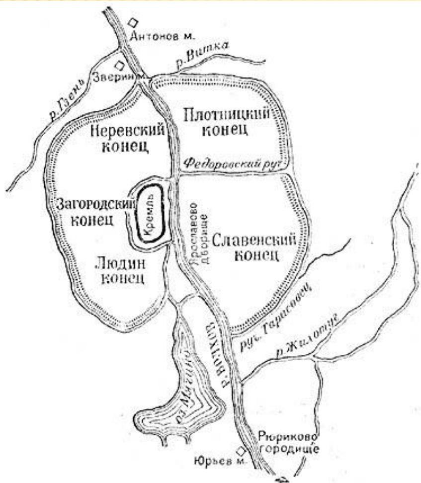
План средневекового Новгорода

Используя перо и тушь, начертите план-схему средневекового города. Передайте характерные черты русского, европейского и восточного средневекового города (по выбору).