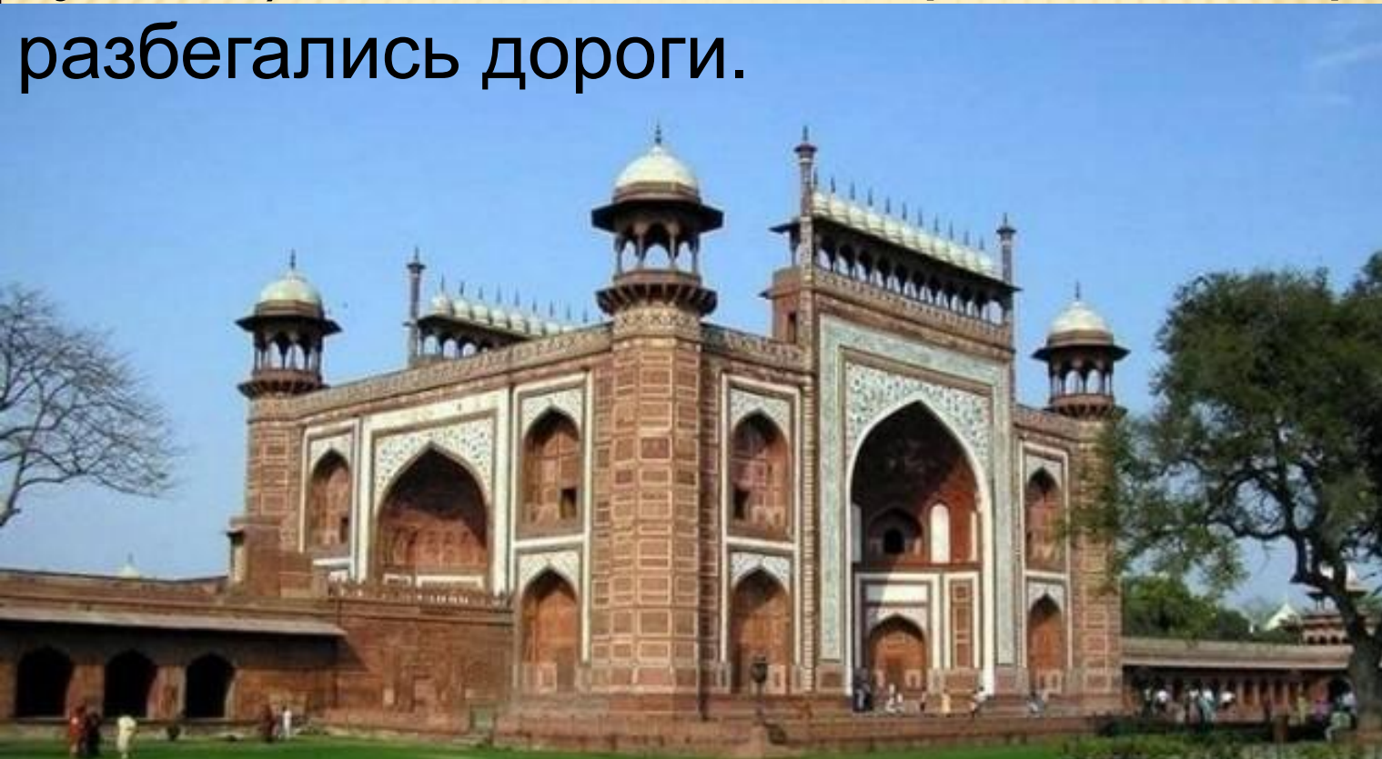
Караван-сарай у входа в Тадж Махал.

с которых мусульман призывали на молитву. Важную роль в архитектурной композиции города играл дворец правителя и торговая часть — караван-сарай, базар (торговые купола). От площади к городским воротам разбегались дороги.