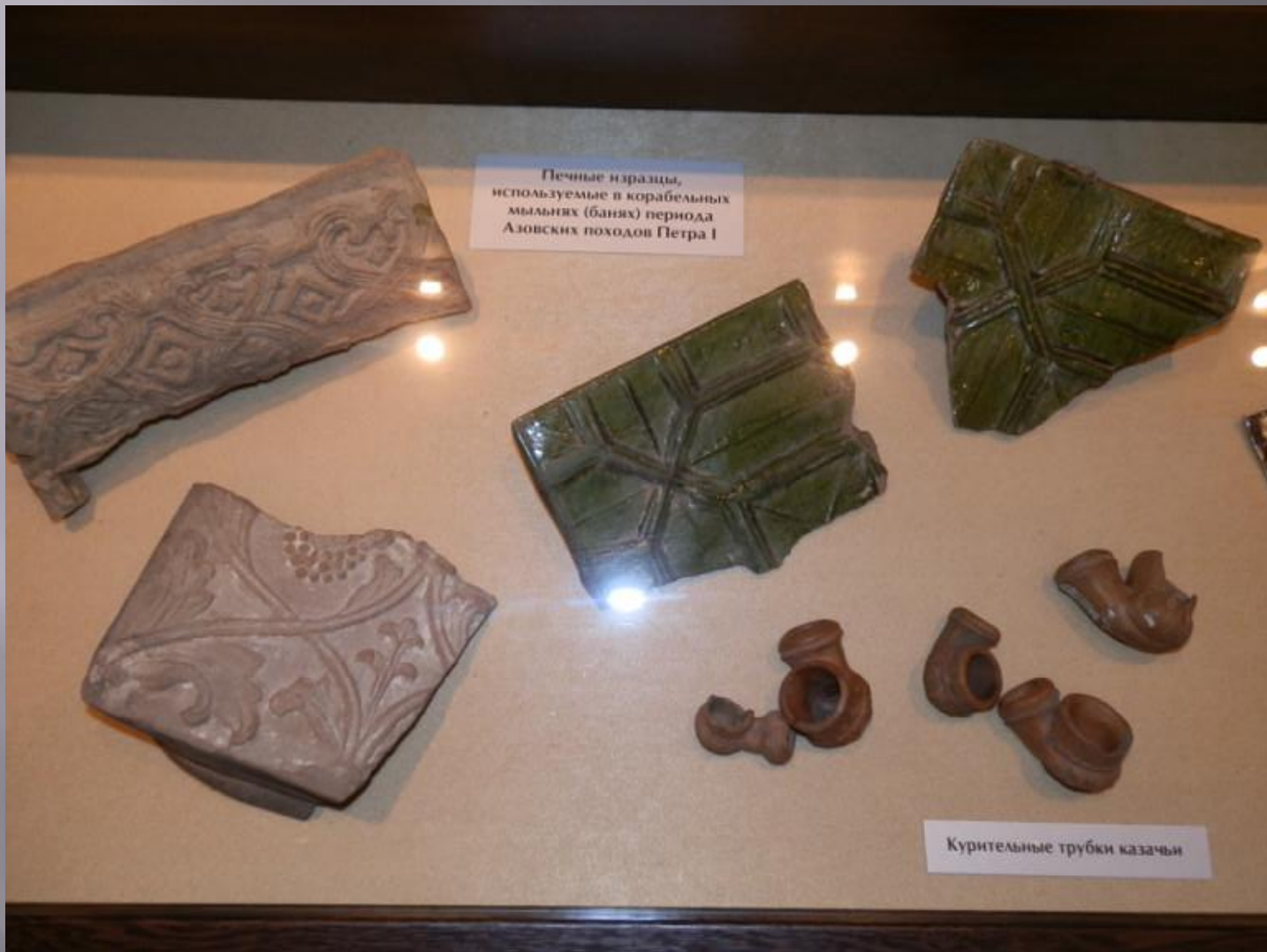
Печные изразцы, используемые в корабельных мыльнях (банях) периода Азовских походов Петра I