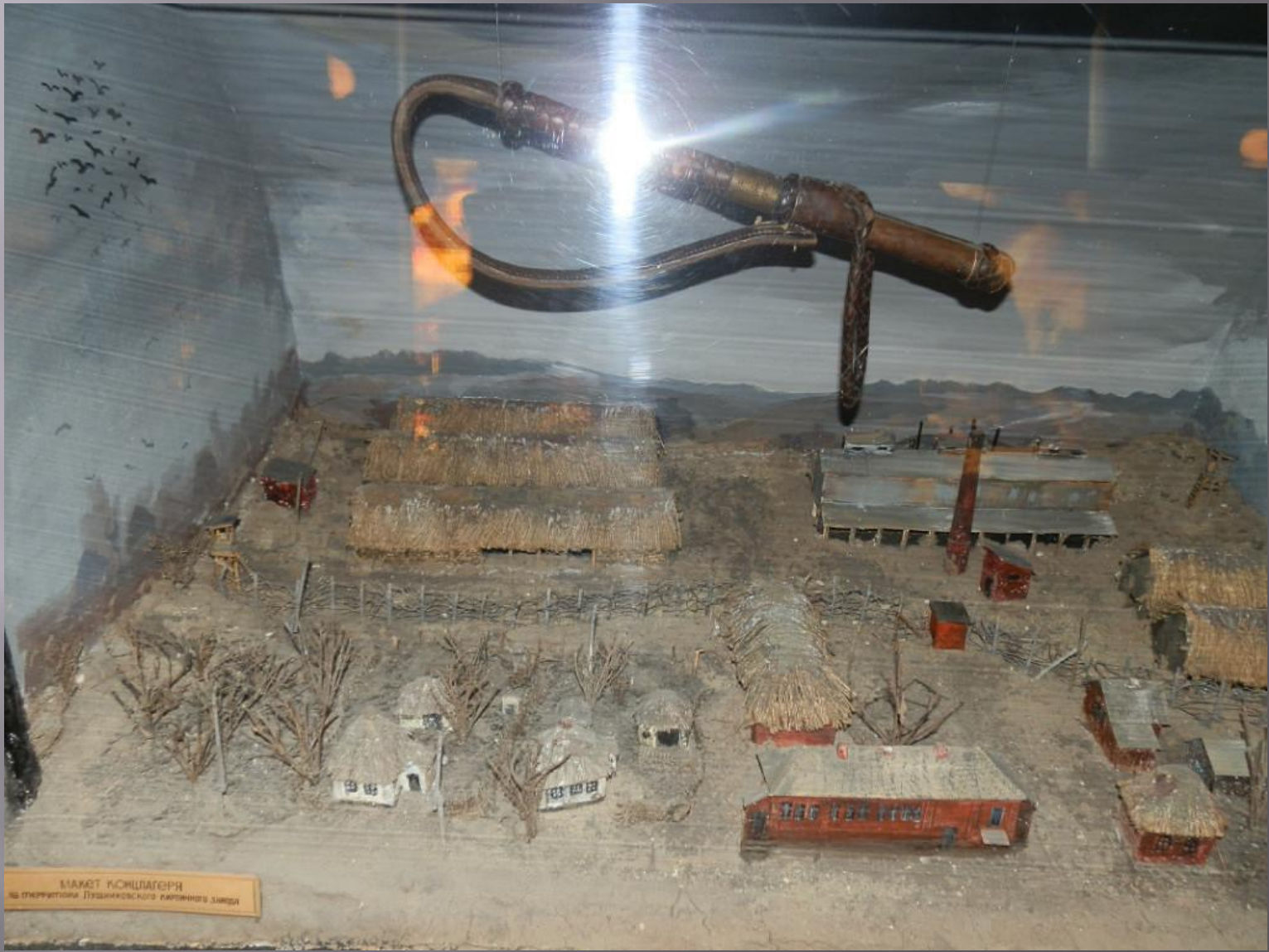
МАКЕТ КОМШЛАГЕРЯ НА ТЕРРИТОРИИ ПУШКИНСКОГО ЗАПОВЕДНИКА