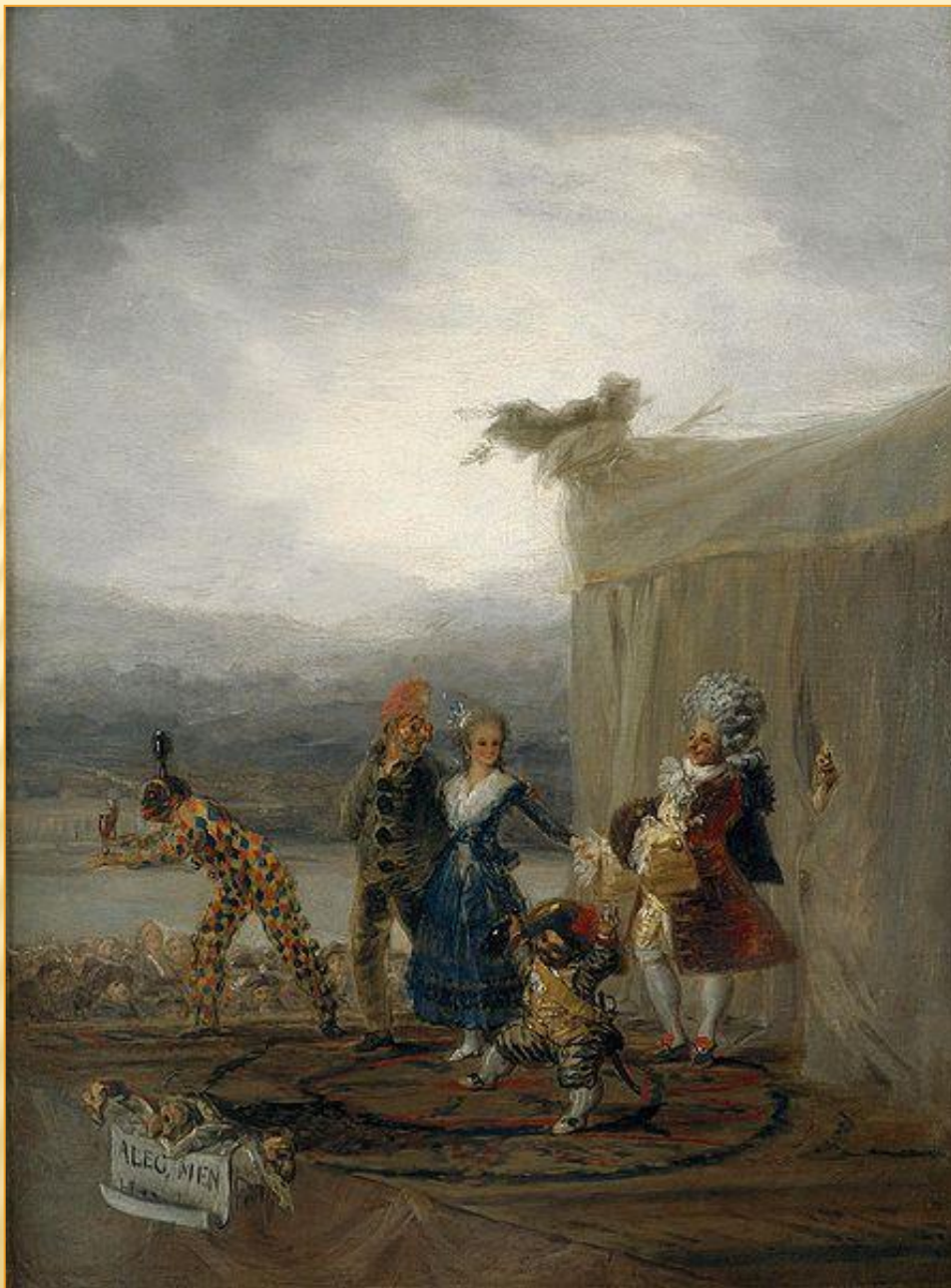
Франсиско Гойя. Бродячие комедианты. 1793 г.