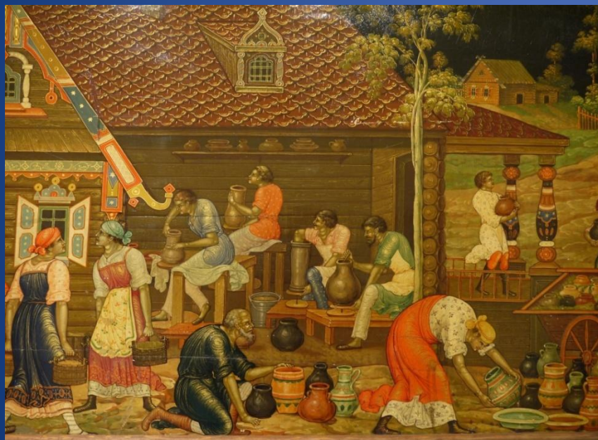
Гончарное производство, XV век