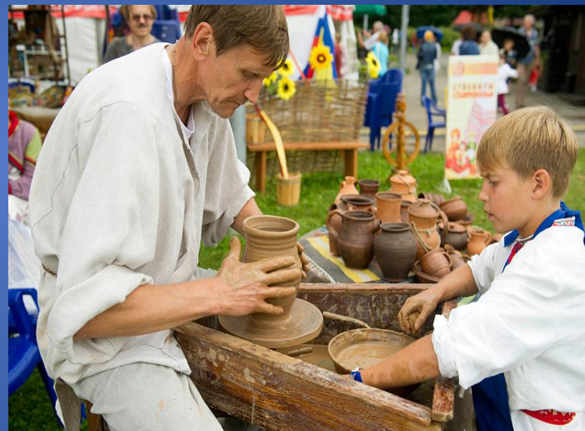
Гончарное производство, XXI век