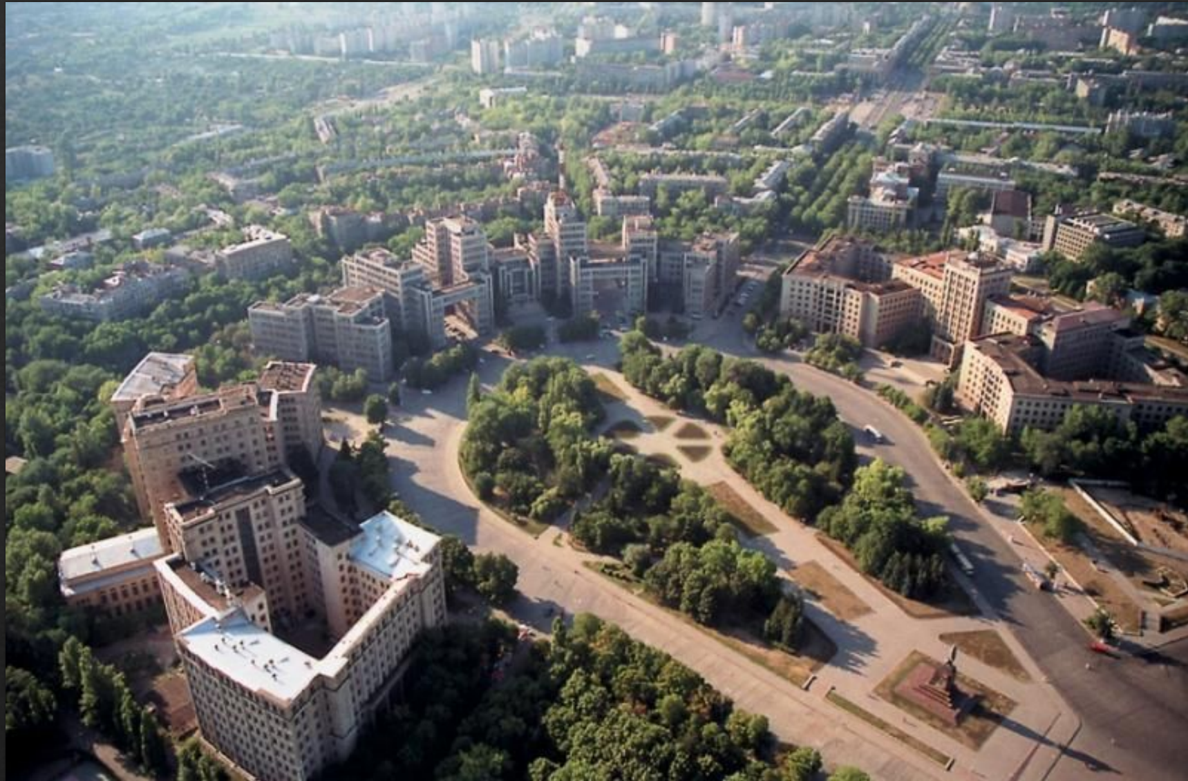
Вид на харьковский Госпром с вертолѐта