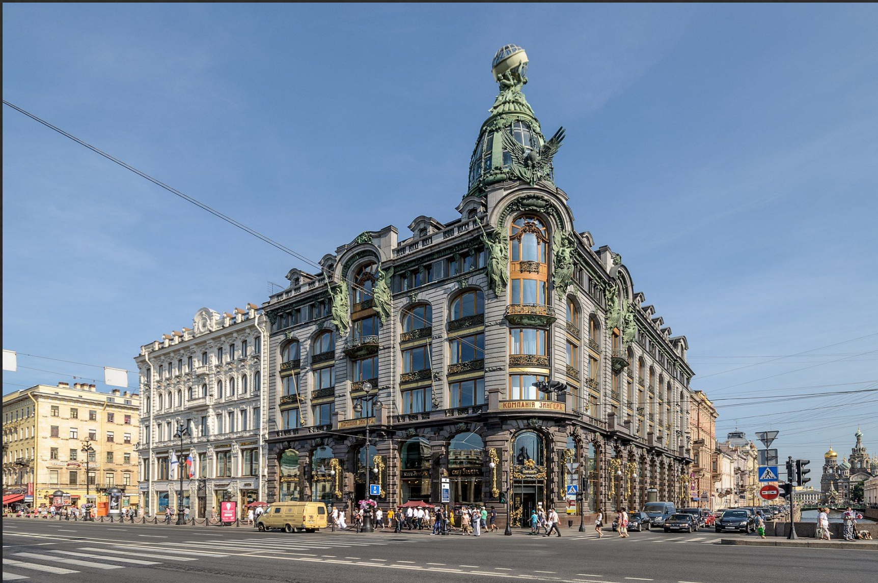
Дом компании «Зингер» (ныне — Дом книги в Санкт-Петербурге Архитектор: Сюзор Павел Юльевич