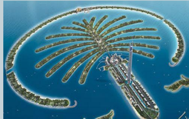
Динамическая архитектура. С нач. 21 века