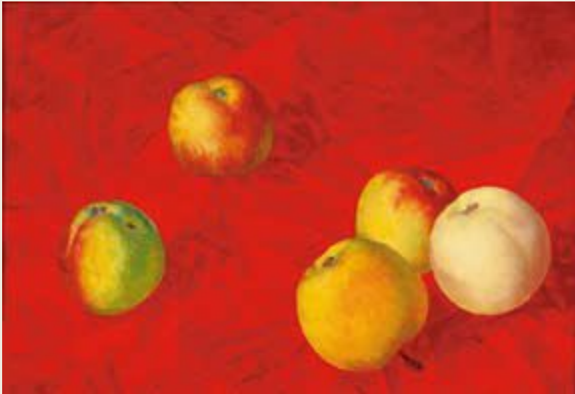
К. Петров-Водкин. Яблоки