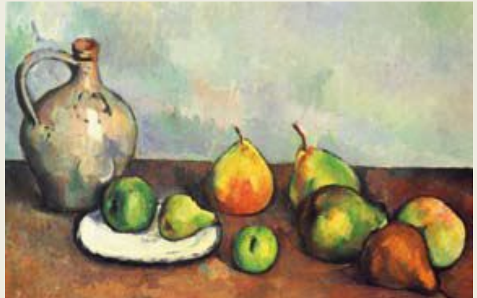
П. Сезанн. Натюрморт с белым кувшином