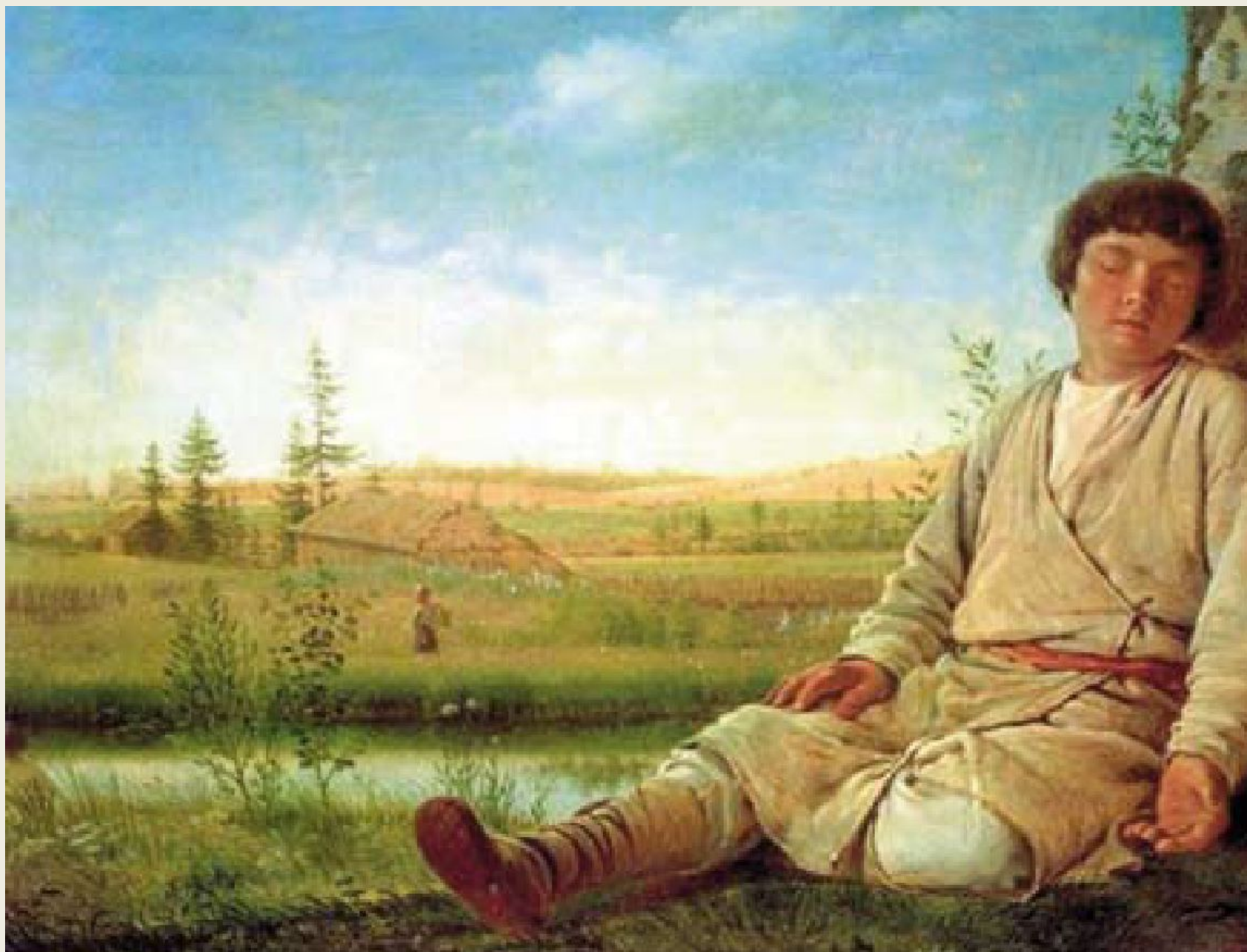
А. Венецианов. Спящий пастушок