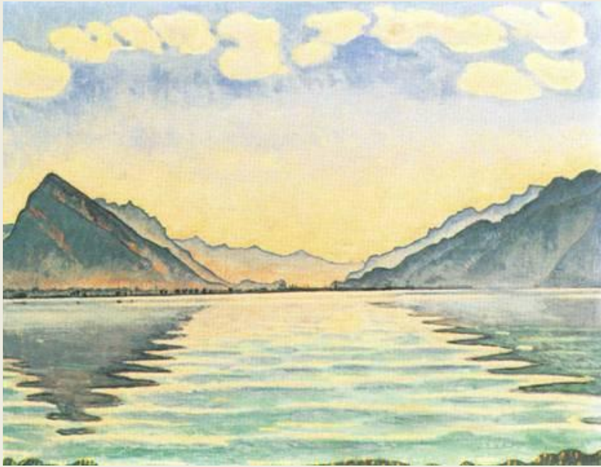
Ф. ХОДЛЕР. Озеро Тан

В симметричной композиции люди или предметы расположены почти зеркально по отношению к центральной оси картины.