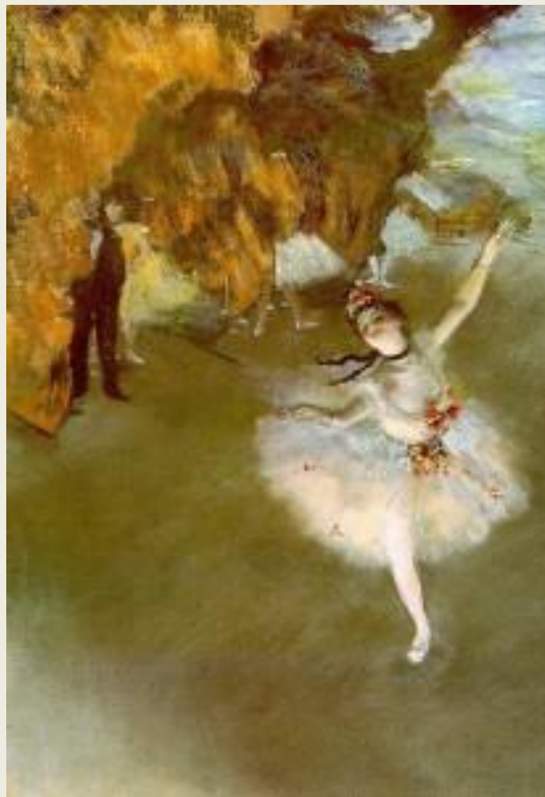
Э.Дега «Прима – балерина»

В отличие от симметричной композиции, в асимметричной композиции необходимо достичь зрительного равновесия. Асимметричная композиция более гибка по сравнению с симметричной, она дает возможность неповторимого сочетания элементов и поэтому всегда индивидуальна .