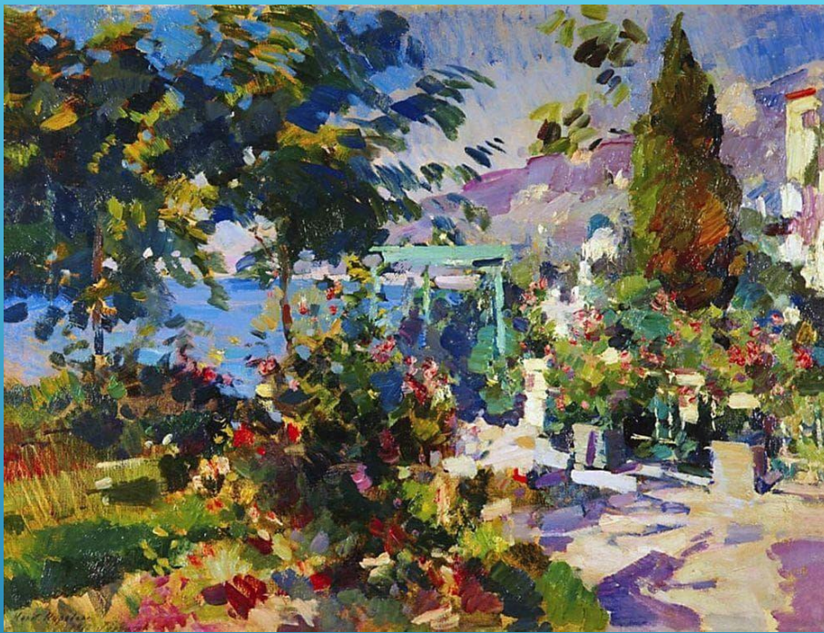
К.А. КОРОВИН. «ЦВЕТЫ». ЭТЮД