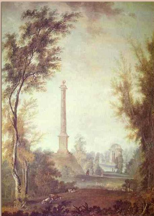
«Колонна с орлом в Гатчине»