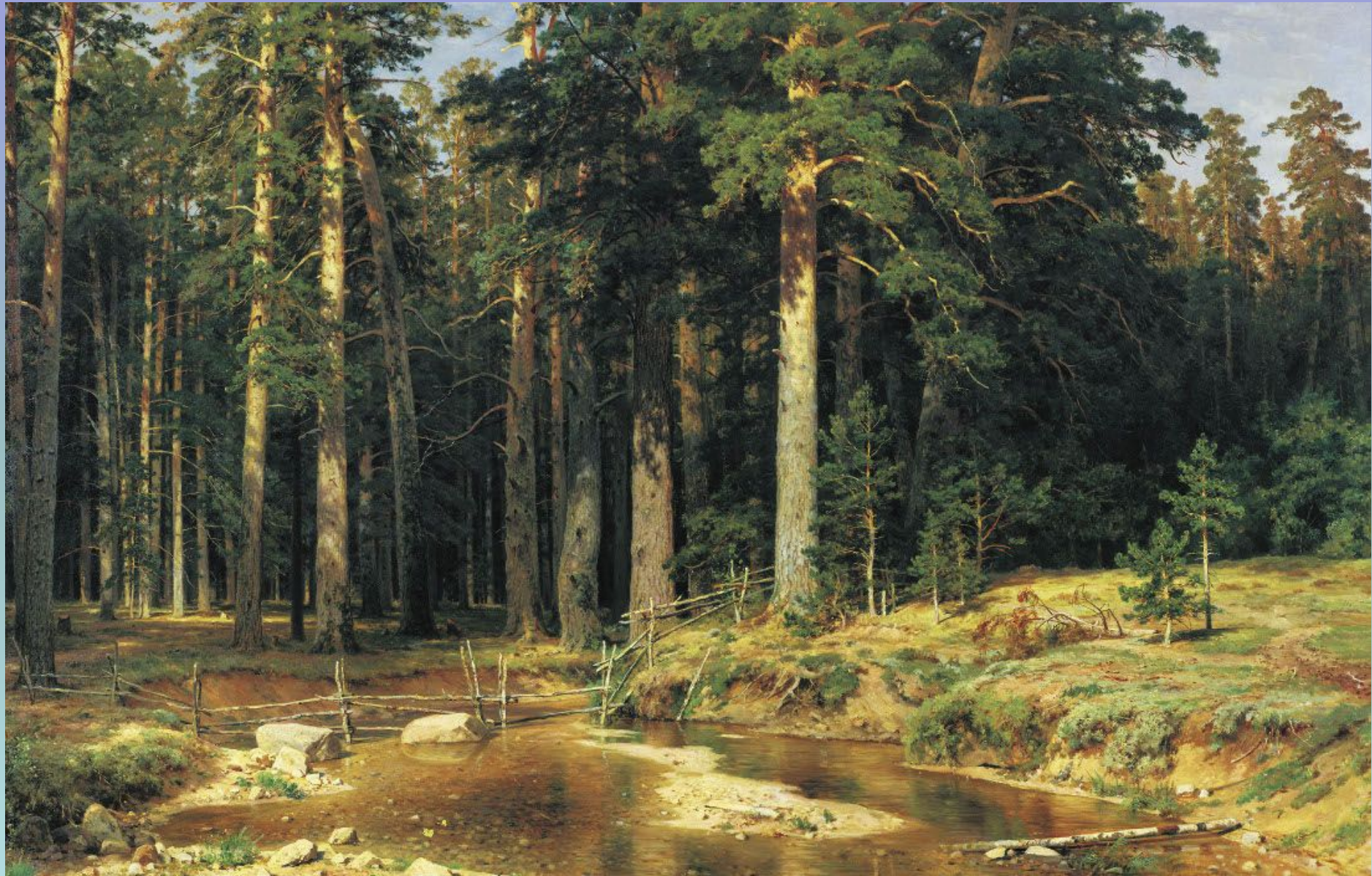
Иван Иванович Шишкин «Корабельная роща»