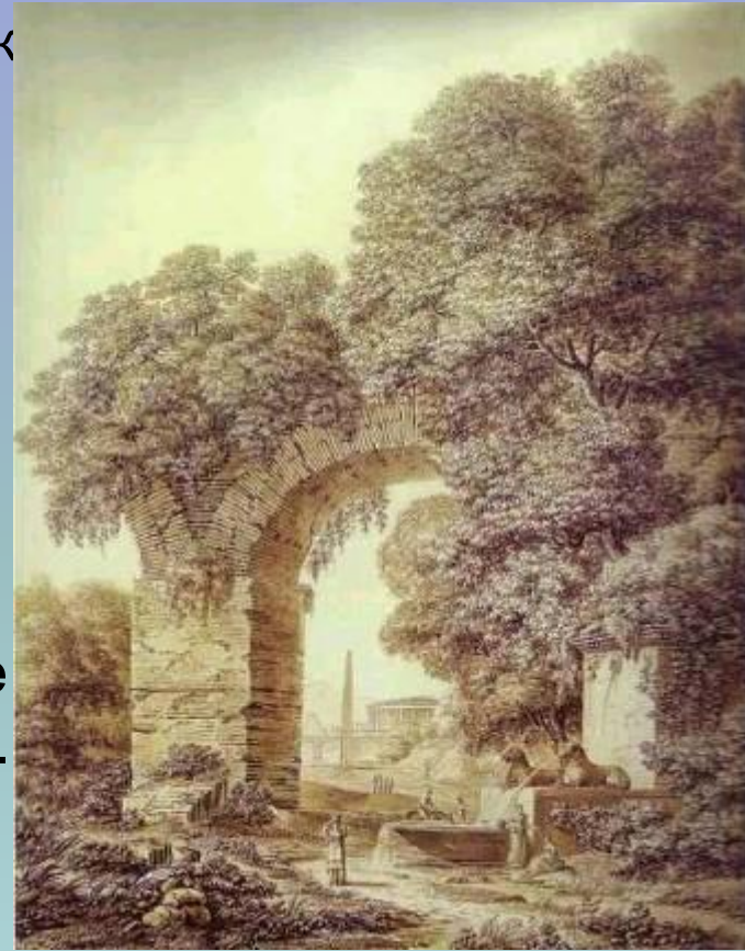
«Пейзаж с руинами»