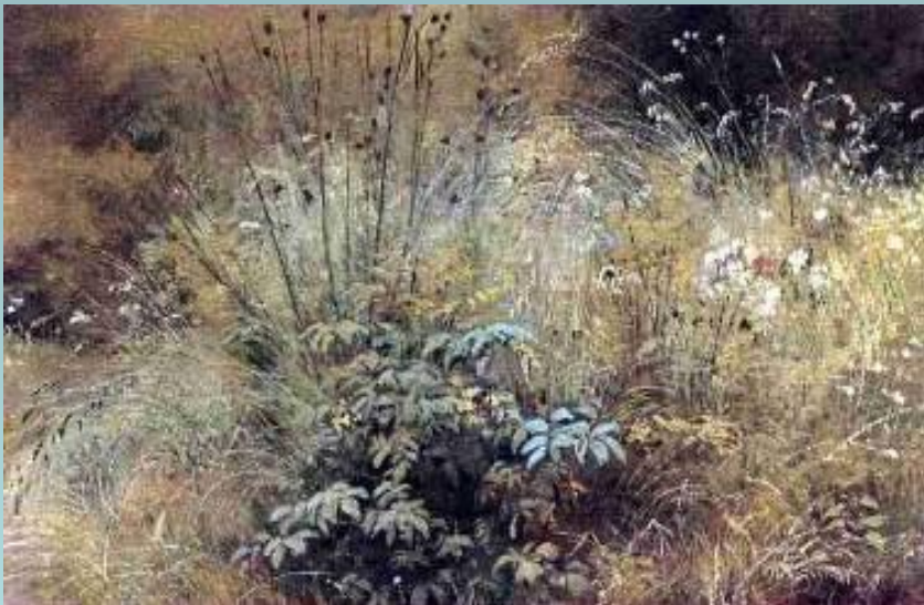
И.И. Шишкин. «Травки»