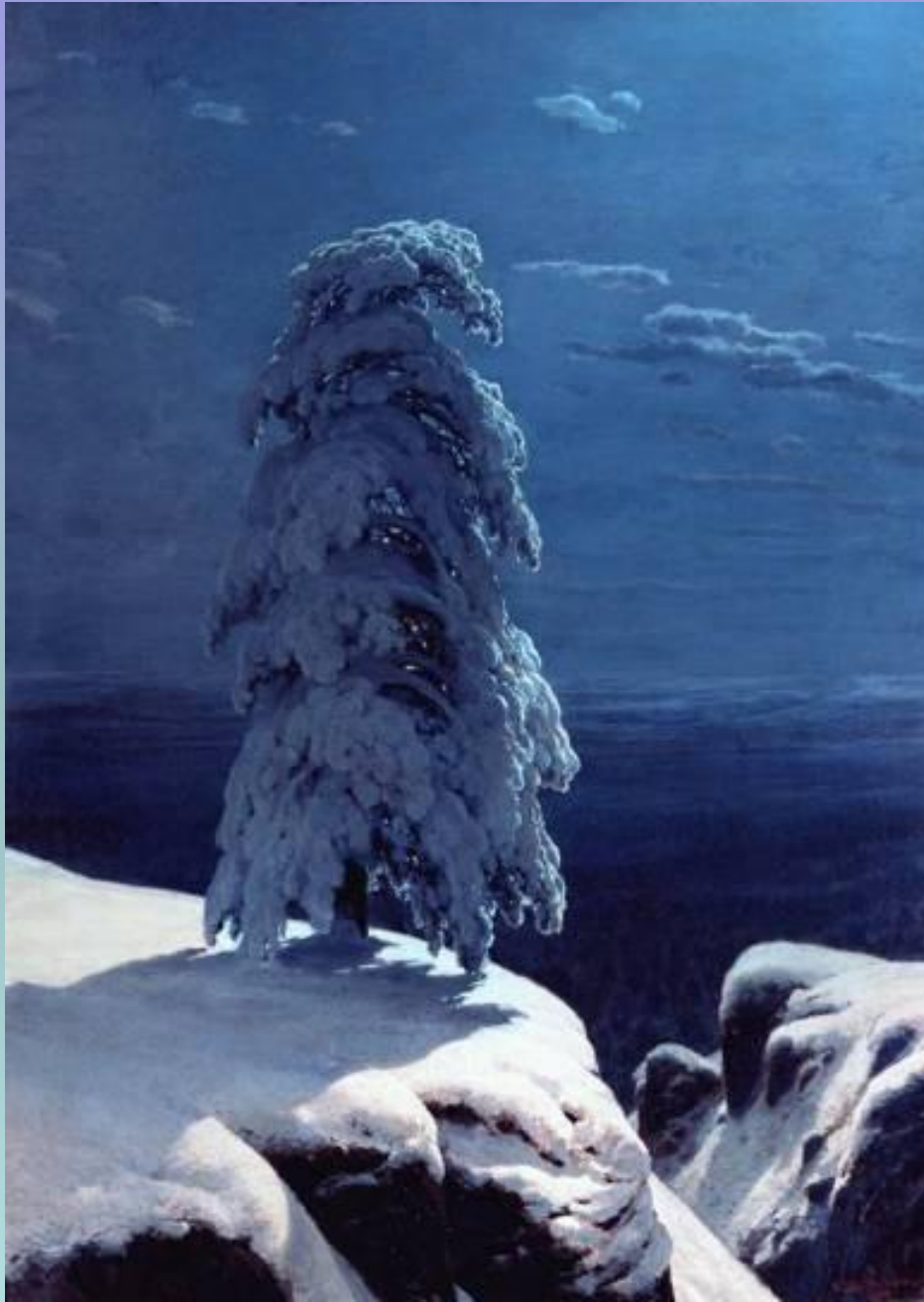
И. И. Шишкин

На севере диком стоит одиноко На голой вершине сосна. И дремлет, качаясь, и снегом сыпучим Одета, как ризой, она.