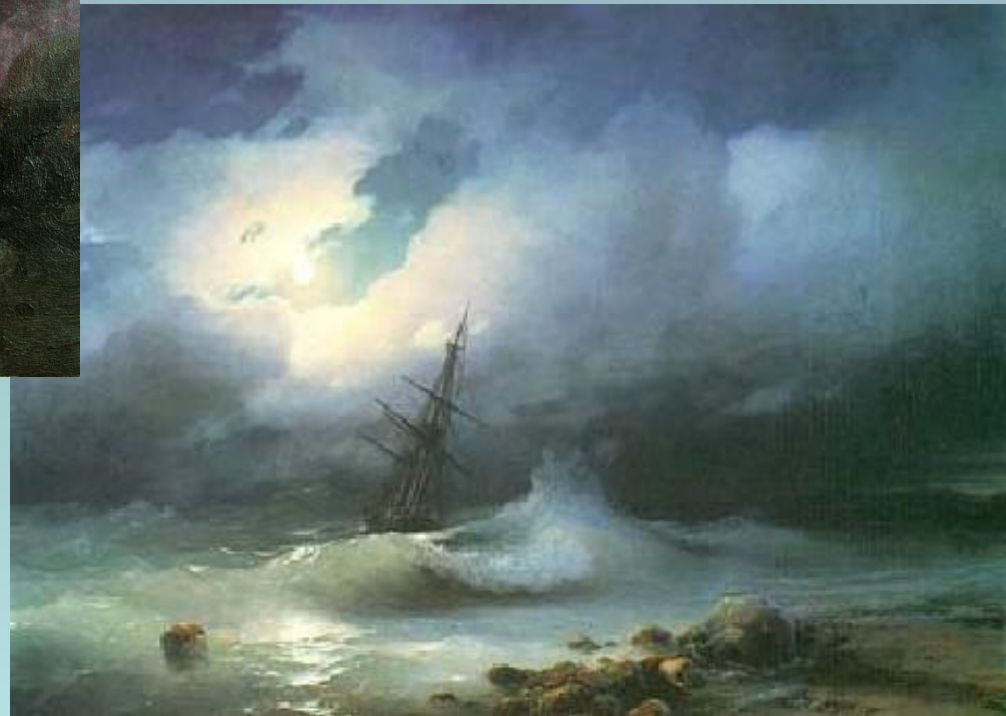
«Бурное море ночью»