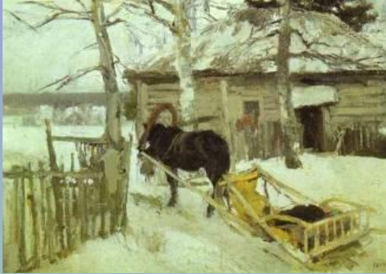
Константин Алексеевич Коровин «Зима»

В сельском пейзаже художника привлекает поэзия деревенского быта, его естественная связь с окружающей средой