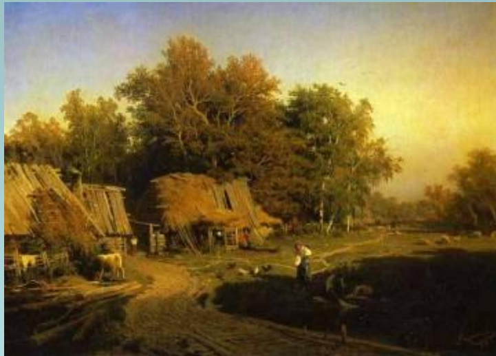
Федор Александрович Васильев «Деревня»

В сельском пейзаже художника привлекает поэзия деревенского быта, его естественная связь с окружающей средой