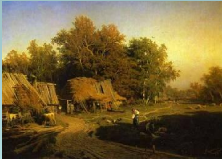
Федор Александрович Васильев «Деревня»

В сельском пейзаже художника привлекает поэзия деревенского быта, его естественная связь с окружающей средой