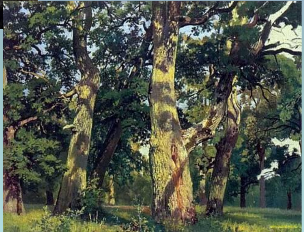
И.И. Шишкин. «Дубы. Вечер»