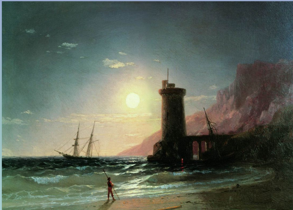
«Морской пейзаж при луне»