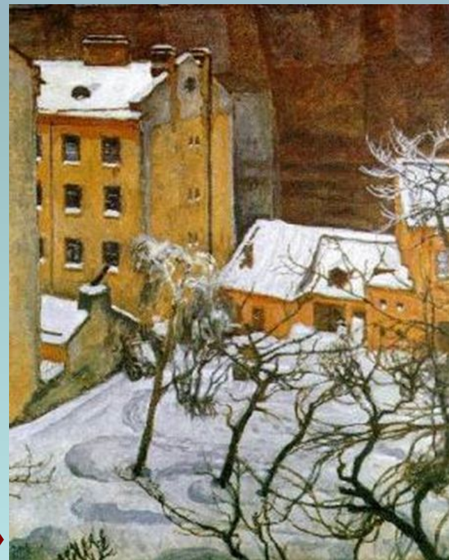
Мстислав Валерианович Добужинский «Петербург»