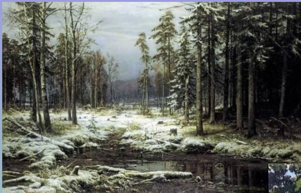
И.И. Шишкин «Первый снег»