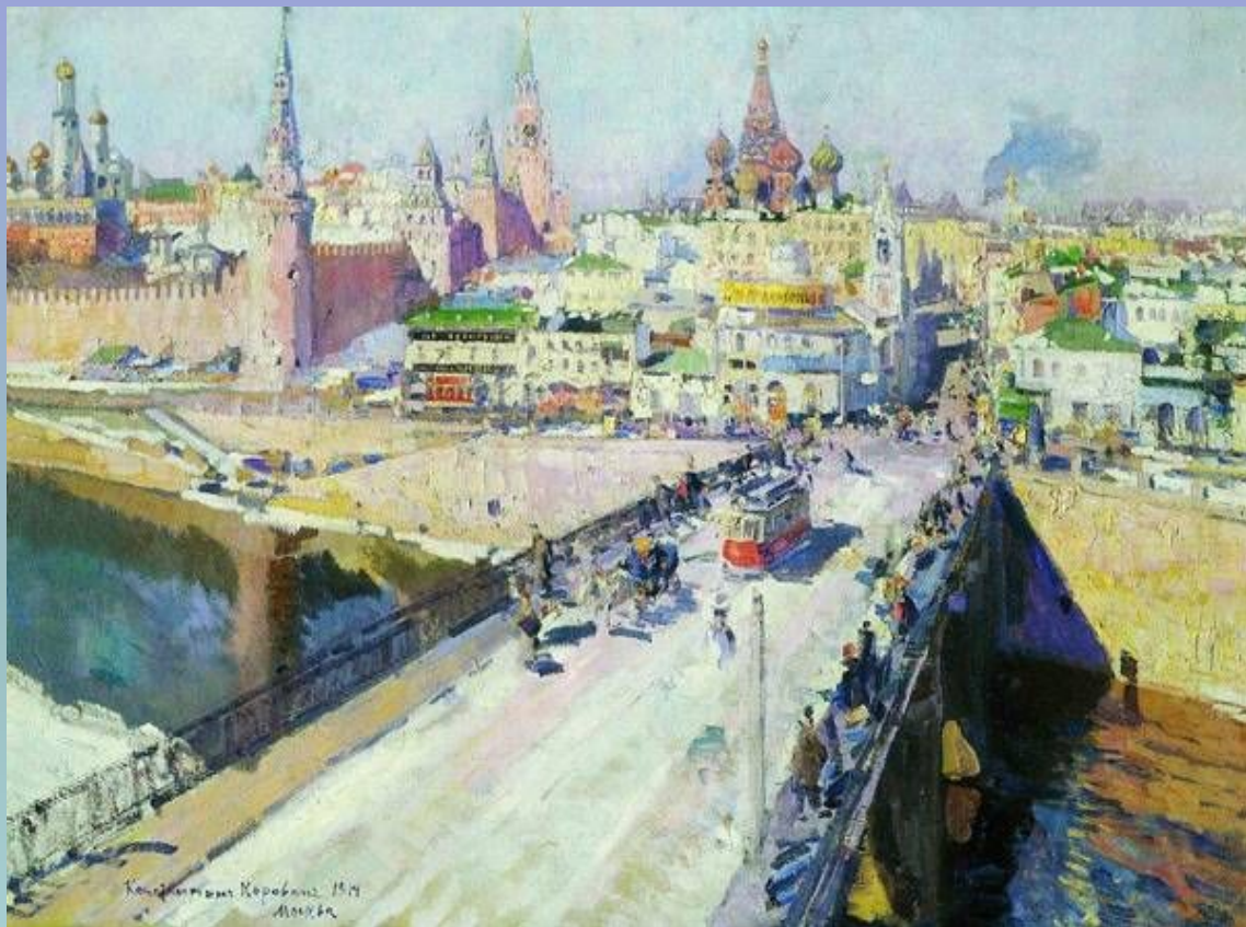
Константин Алексеевич Коровин «Москва»