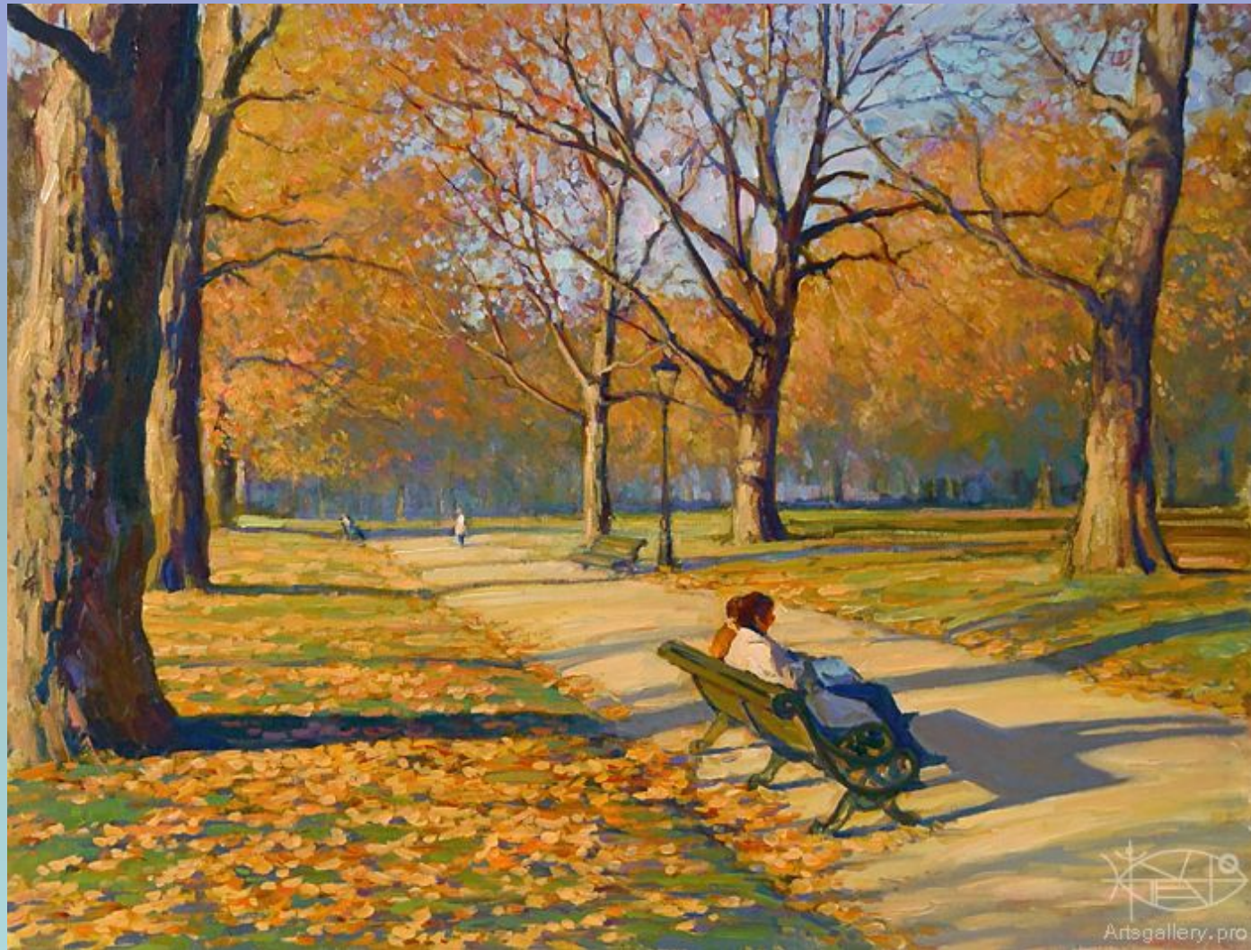
Исаак Ильич Левитан «В парке»

В нем изображают уголки природы, созданные для отдыха и удовлетворения эстетических потребностей людей