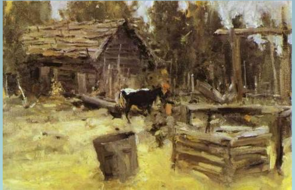
Константин Алексеевич Коровин «Двор»