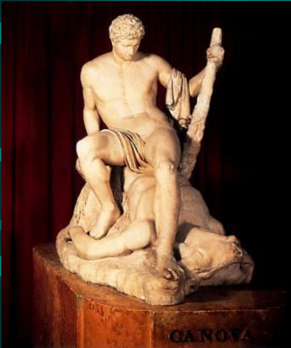
Антонио Канова. Тесей и минотавр.