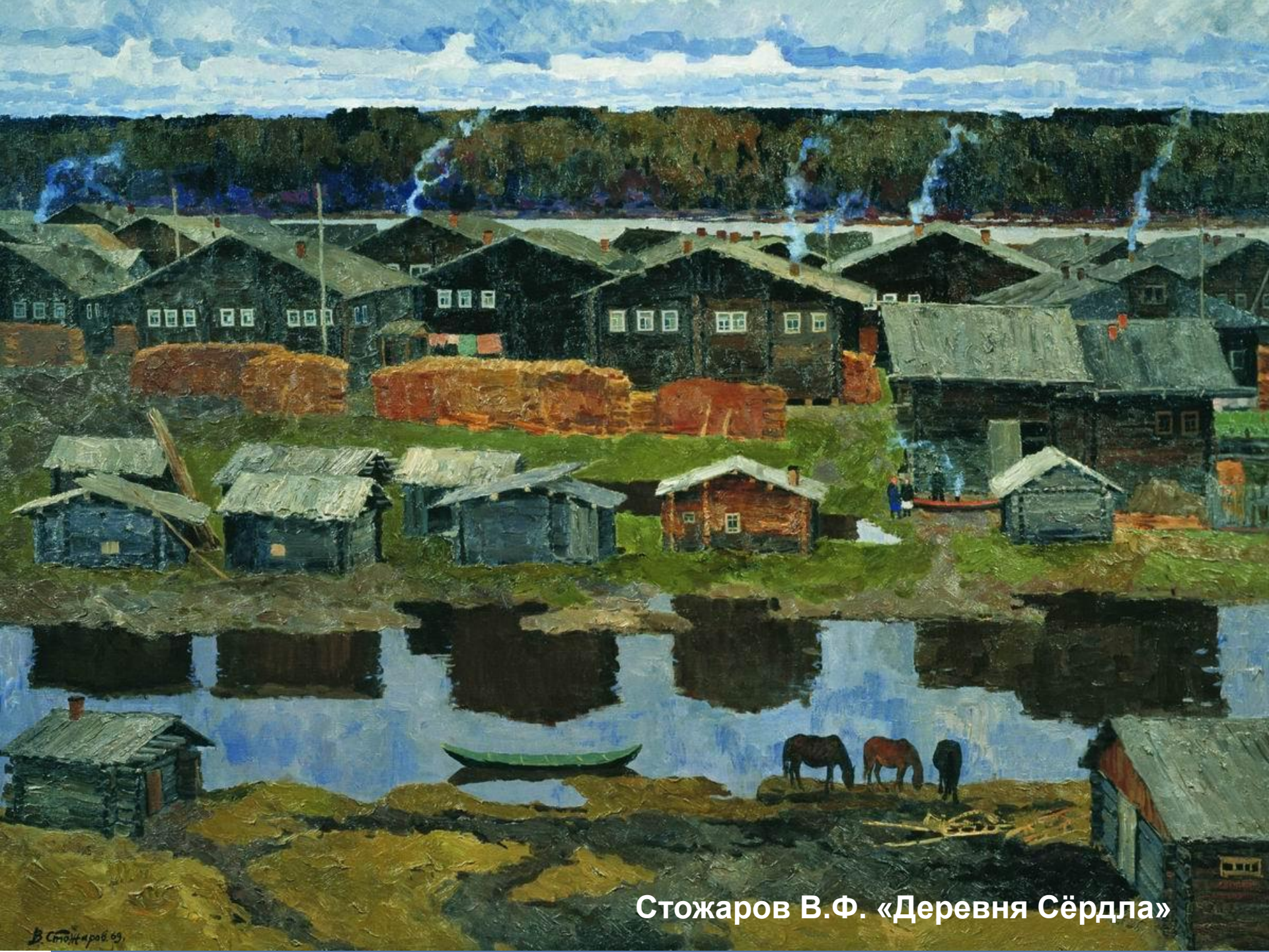
Стожаров В.Ф. «Деревня Сёрдла»