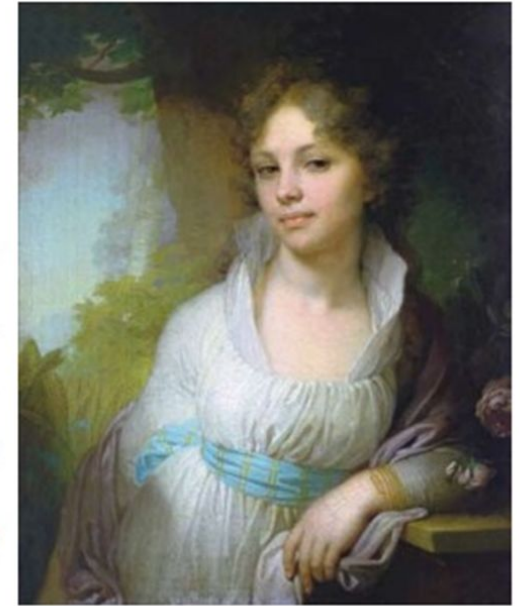
В. Боровиковский. Портрет Марии Лопухиной