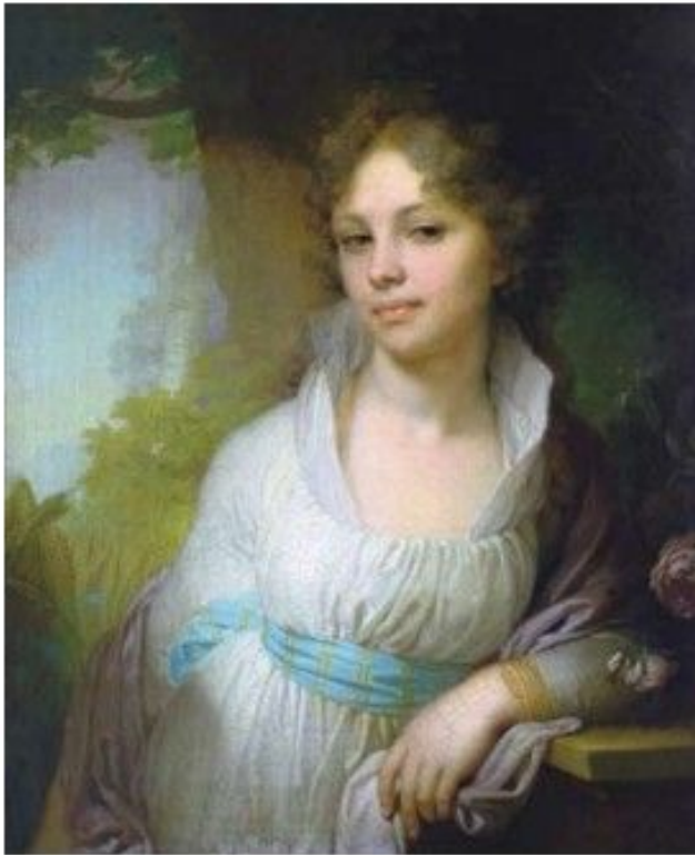
В. Боровиковский. Портрет Марии Лопухиной