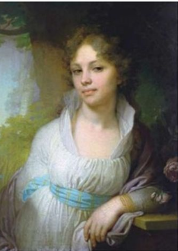
Викторовский. Портрет Марии Лопухиной