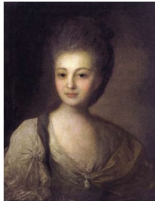
Ф. Рокотов. Портрет А. Струйской

Когда потемки наступают И приближается гроза, Со дна души моей мерцают Ее прекрасные глаза.