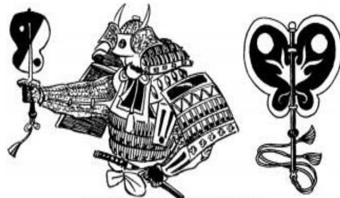
рис. 2.2. Типы вееров гумбаи-учива