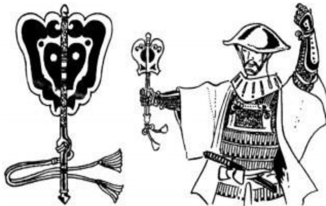
рис. 2.1. Типы вееров гумбаи-учива