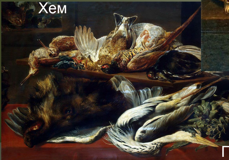
Пауль де Вос