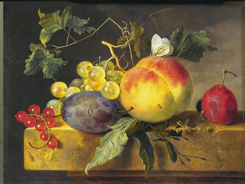
Ян ван Хёйсум