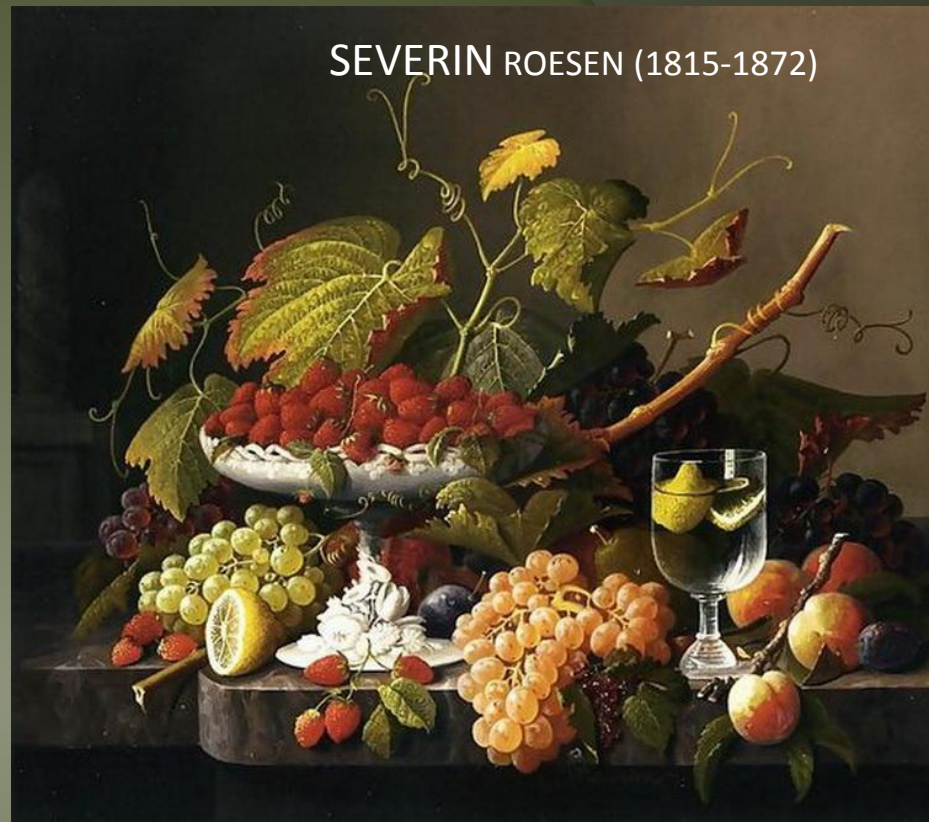
SEVERIN ROESEN (1815-1872)