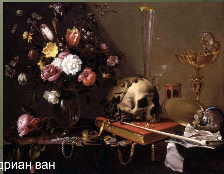
Адриан ван Утрехт