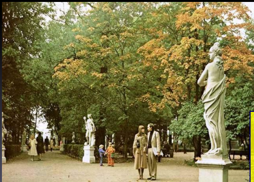
Санкт-Петербург. Летний сад