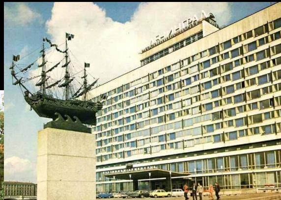
Санкт-Петербург. Гостиница «Ленинград»