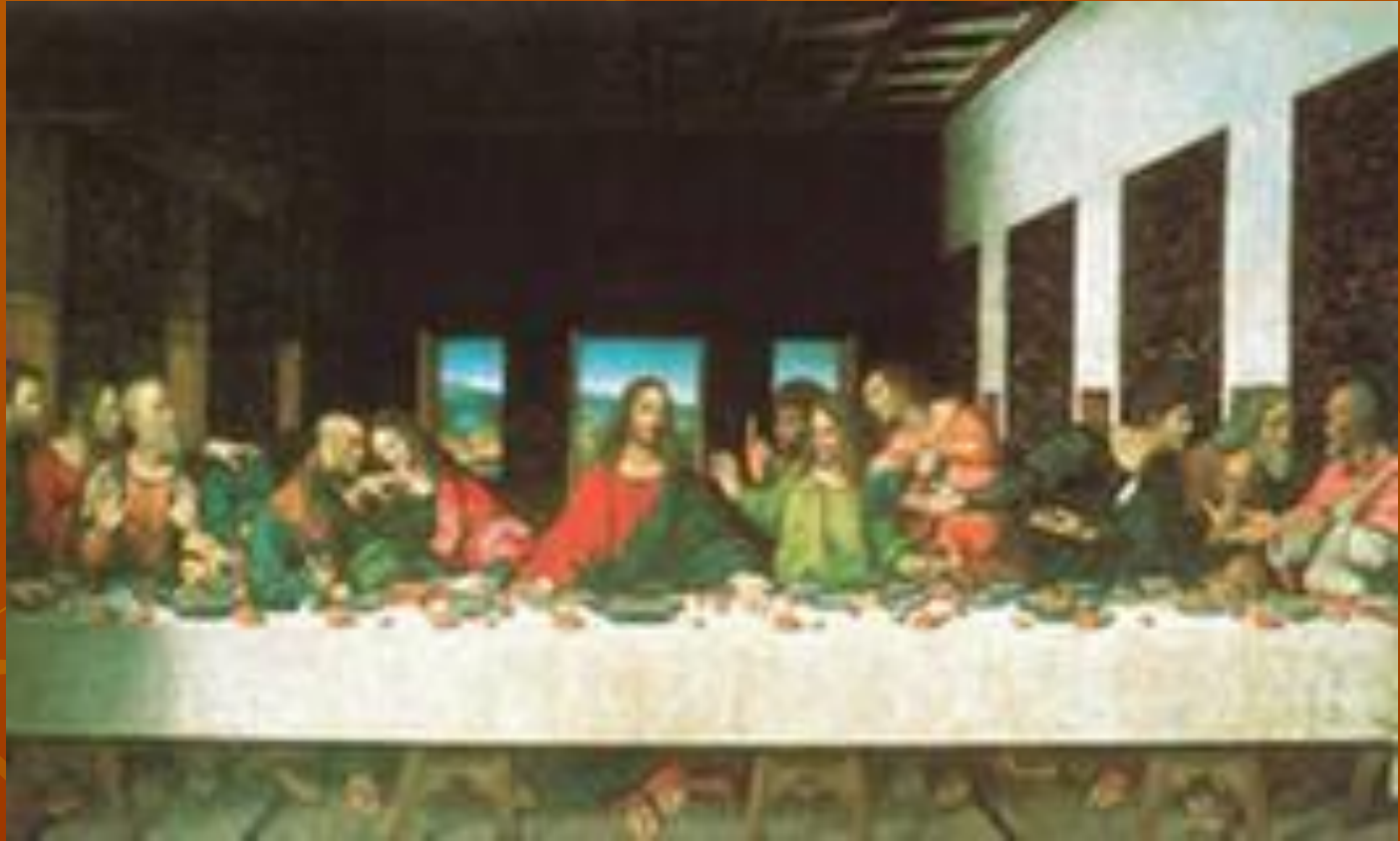
Леонардо да Винчи «Тайная вечеря»