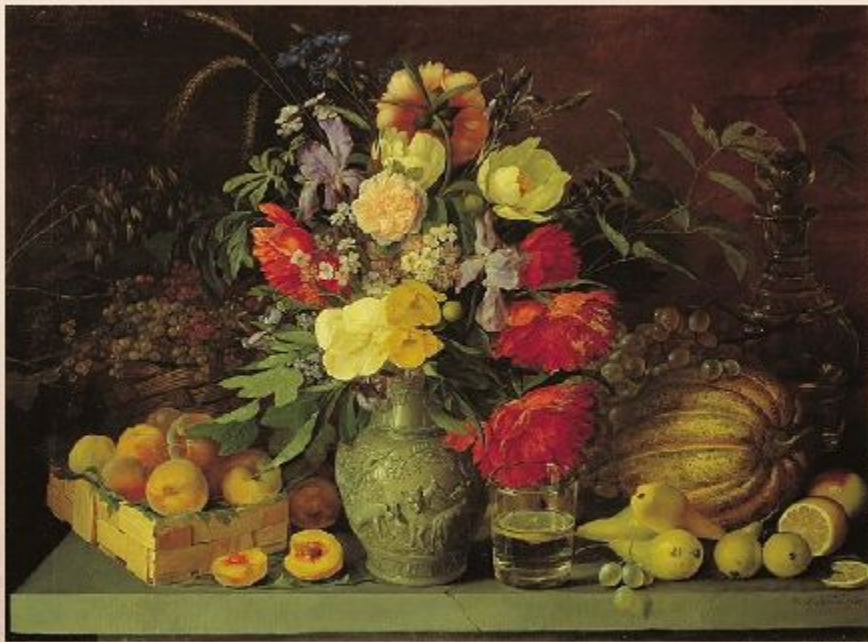
Хруцкий И.Ф. «Цветы и плоды». 1839

В симметричных композициях чаще всего имеется ярко выраженный центр.