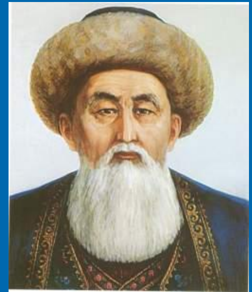
Кіші жүздің төбе биі