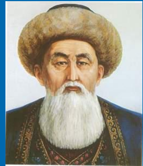
Кіші жүздің төбе биі