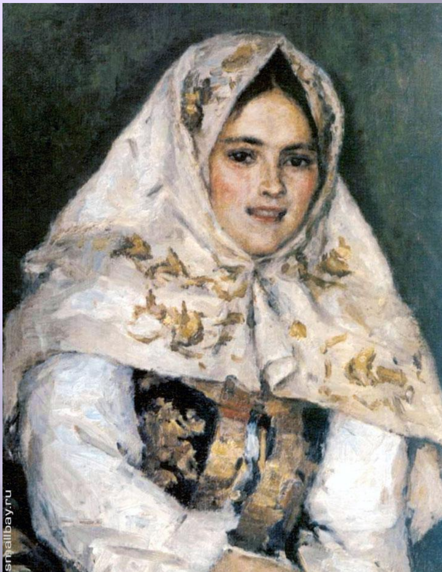
СИБИРСКАЯ КРАСАВИЦА 1891 ГОД.