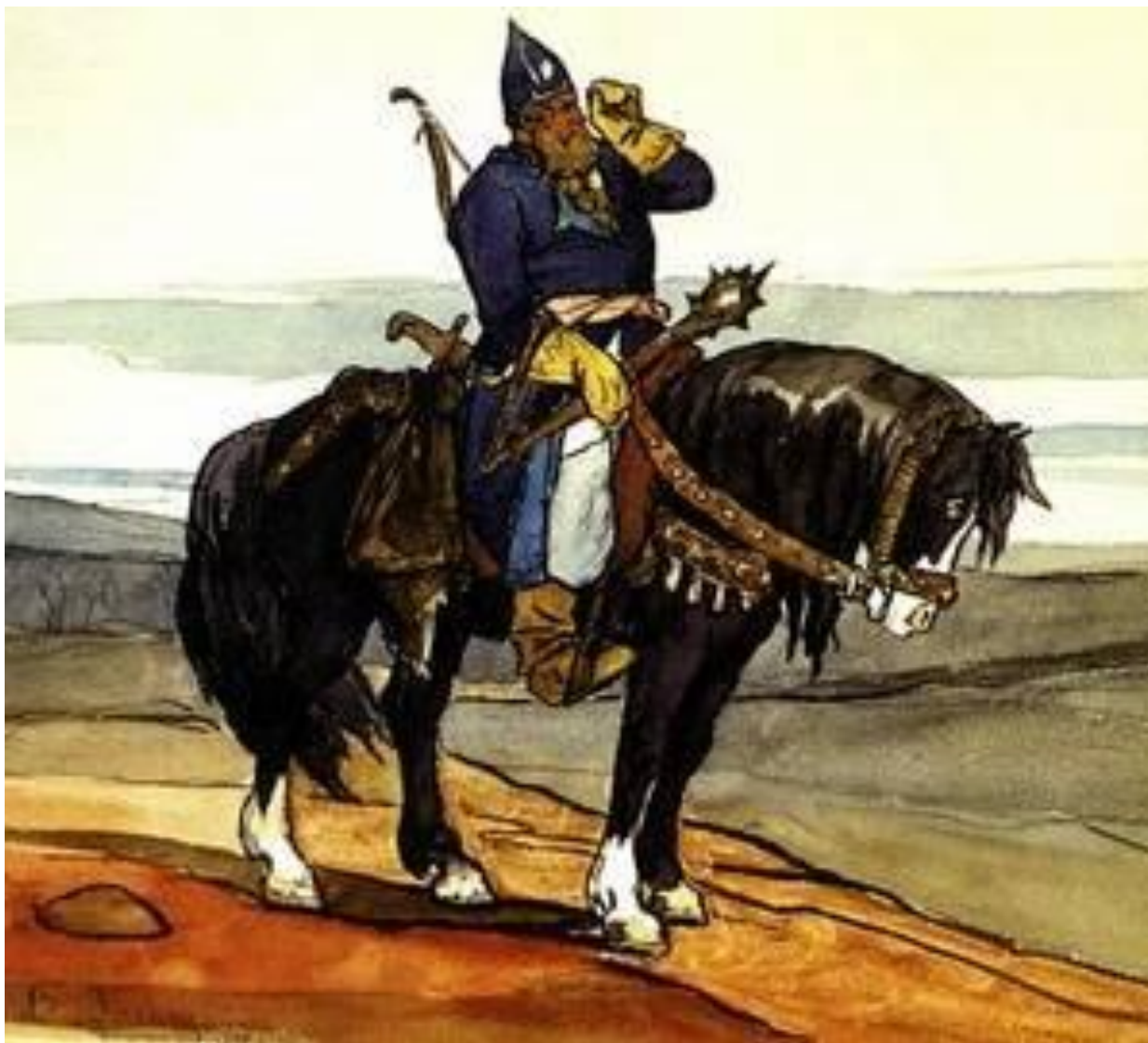
В. М. Васнецов. «Богатырь. Эскиз». 1870 г.