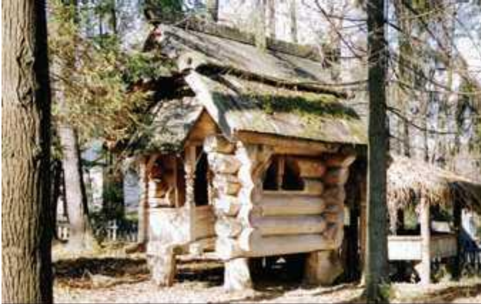
В. М. Васнецов. «Избушка на курьих ножках» в Абрамцево. 1883 г.