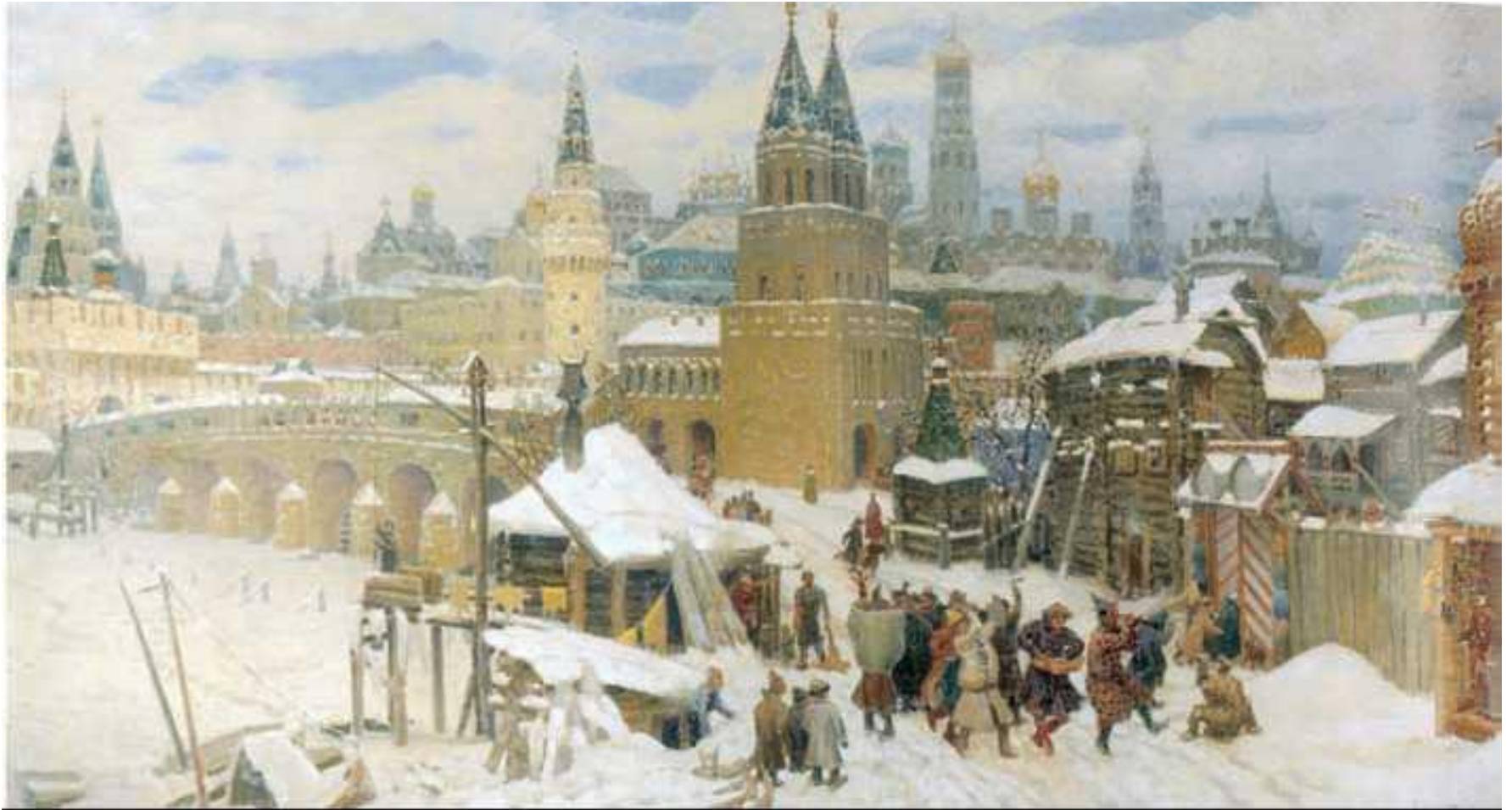
А. М. Васнецов. «Всехсвятский каменный мост. Конец 17 в.». 1901 г. Художественный музей. Ярославль