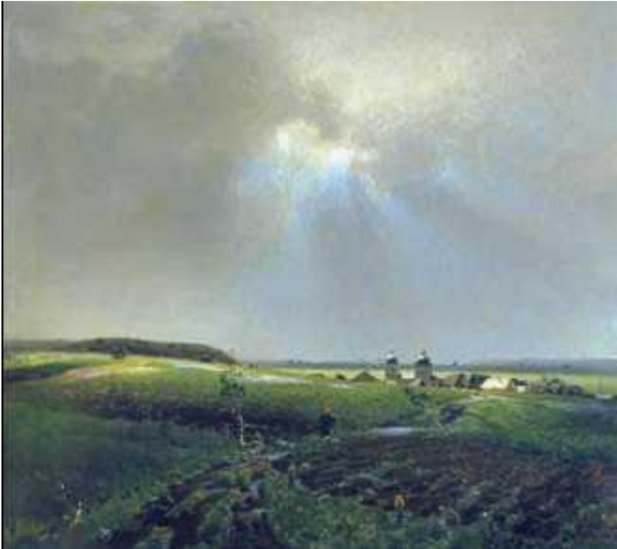
А. М. Васнецов. «После дождя». 1887 г. Музей русского искусства. Киев