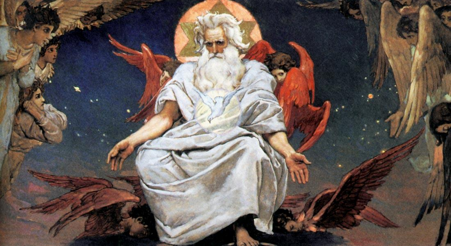
В. М. Васнецов "Бог Саваоф" 1885-1896 годы