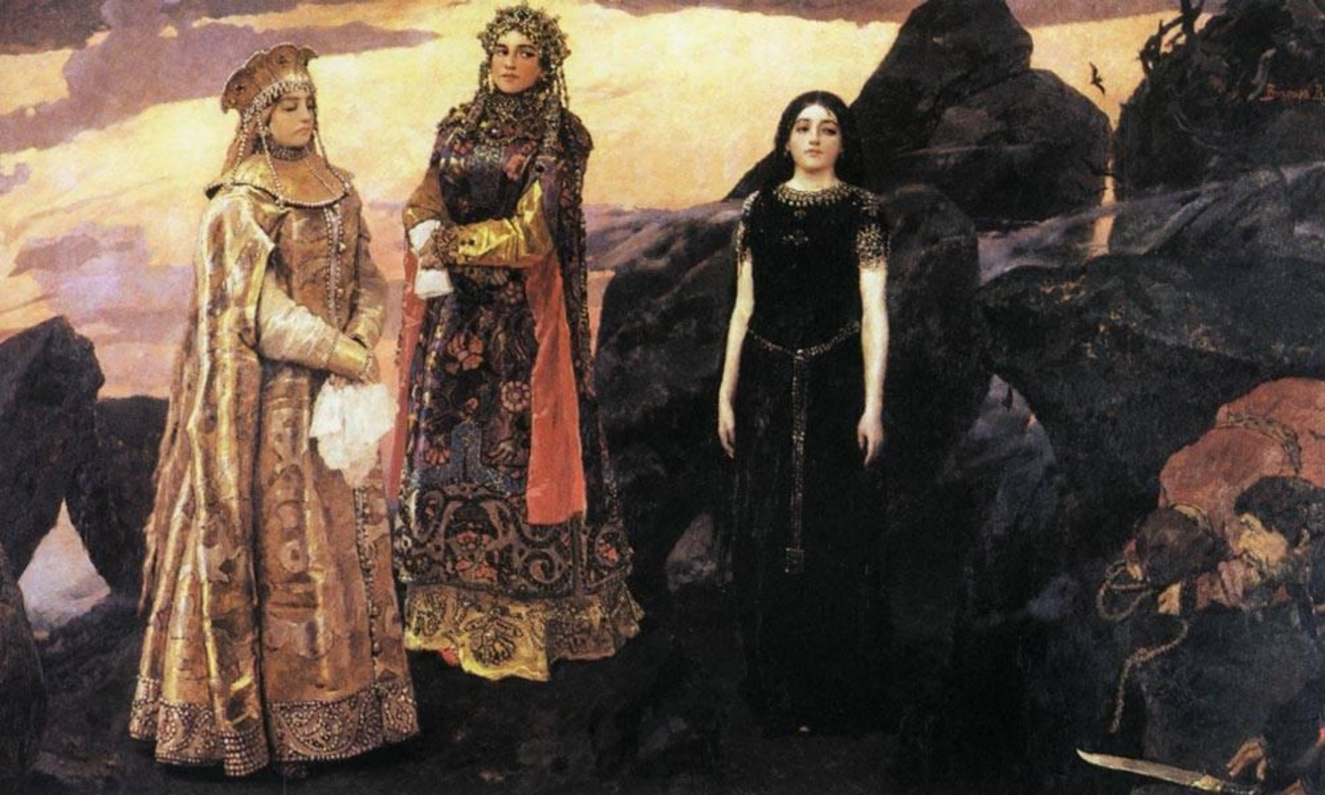
В. М. Васнецов. Три царевны подземного царства. 1881 г.