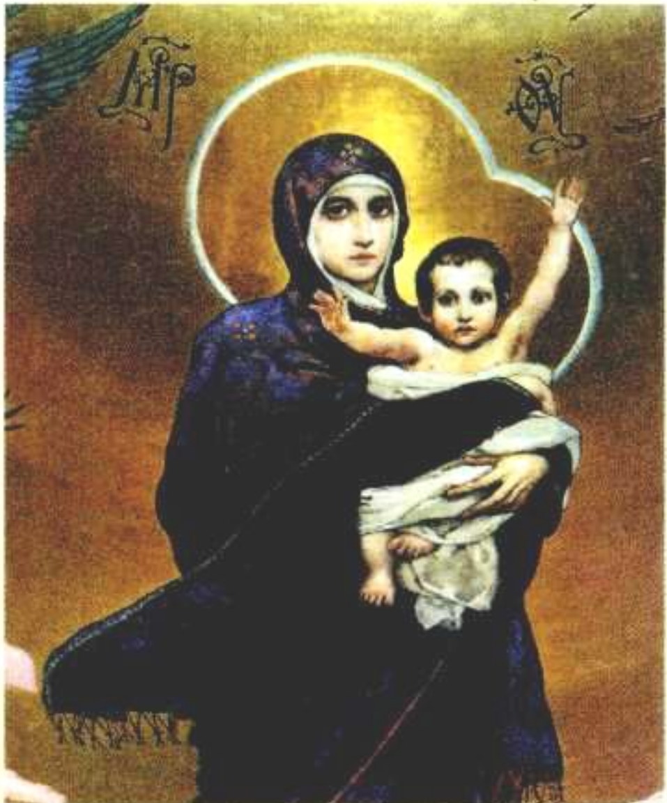
В. М. Васнецов. Богоматерь. Фрагмент. 1885—1896 гг. Владимирский собор, Киев.