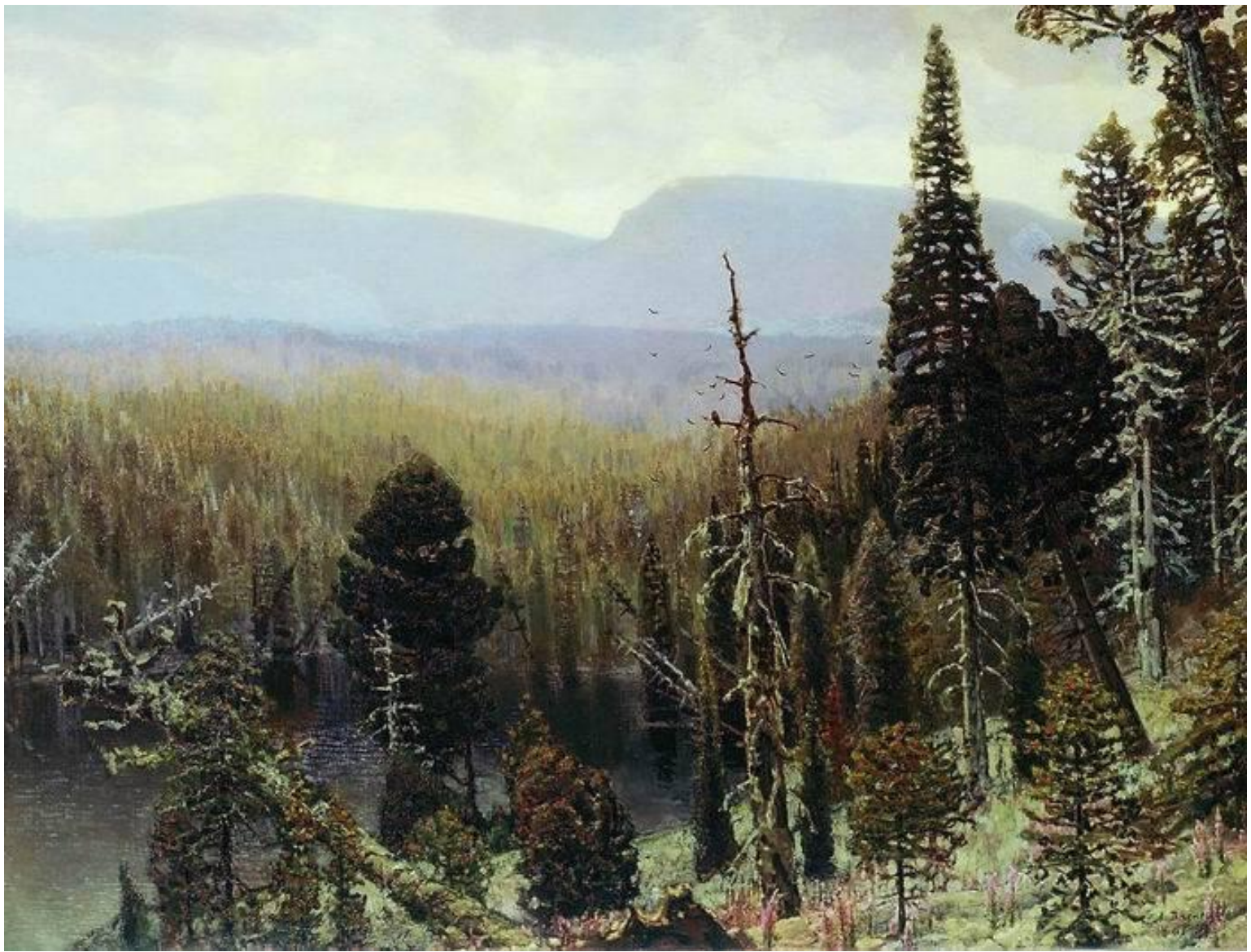
А. М. Васнецов. «Тайга на Урале. Лес. Синяя гора». 1891 г.