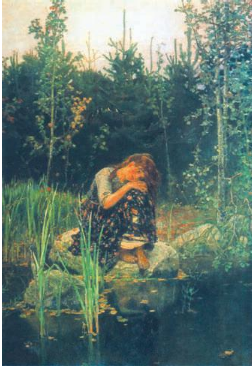
В. М. Васнецов. «Алёнушка». 1881 г. Государственная Третьяковская галерея