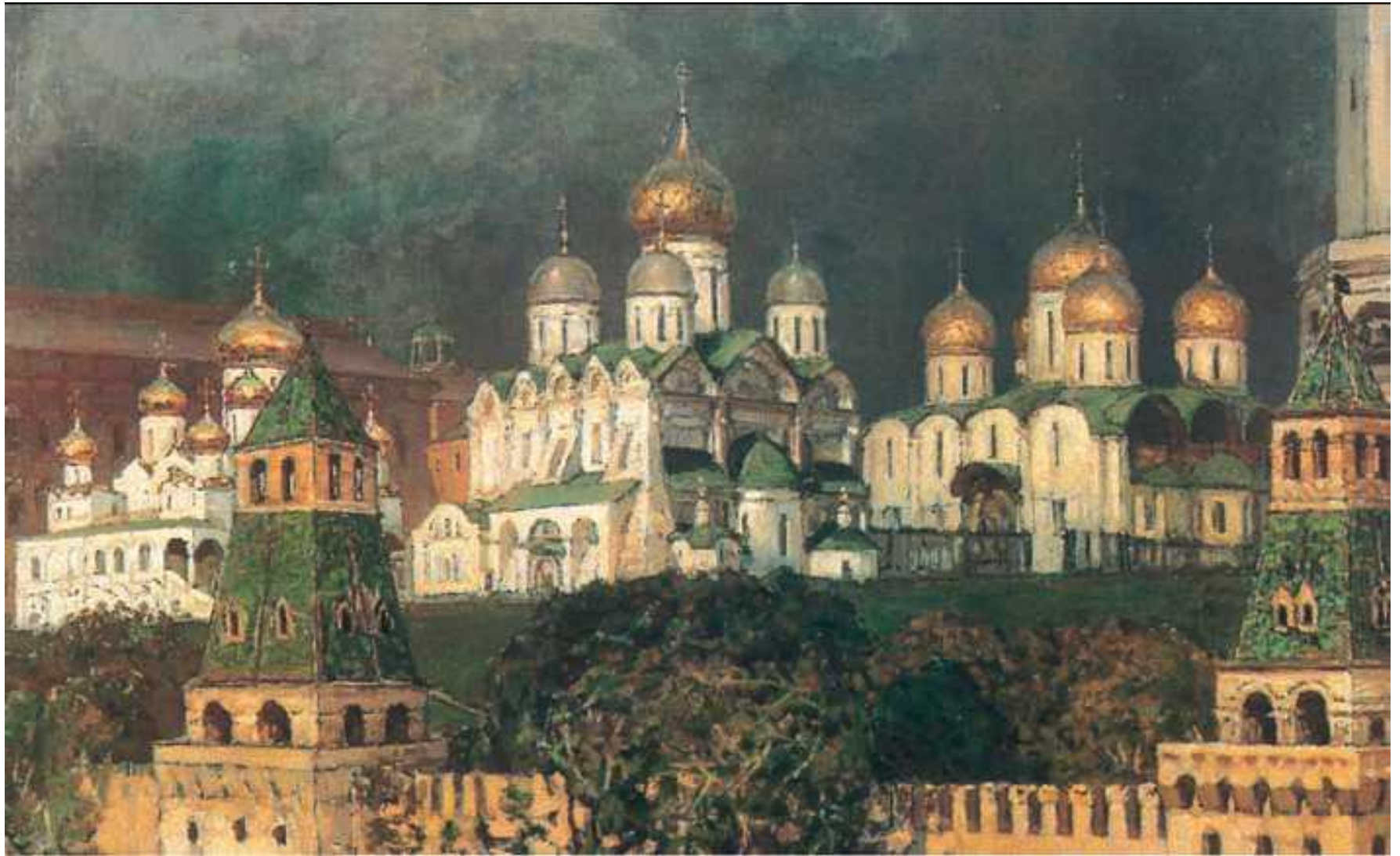
А. М. Васнецов. «Московский Кремль». 1897 г. Киров. Фрагмент