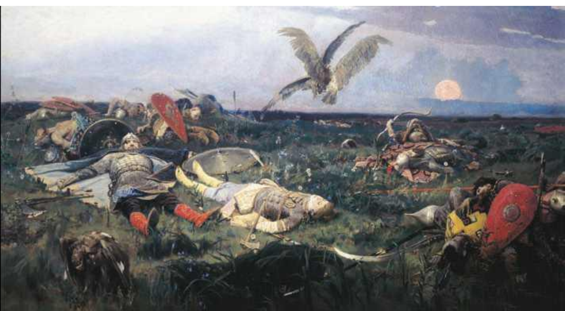
В. М. Васнецов. «После побоища Игоря Святославича с половцами». 1880 г. Государственная Третьяковская галерея