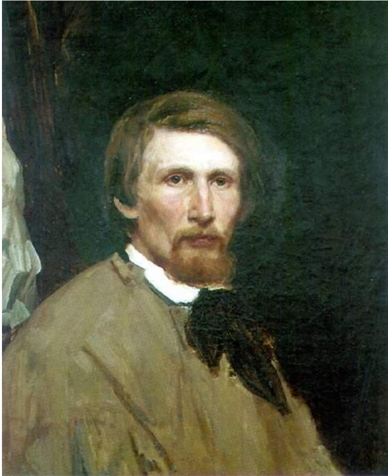
В. М. Васнецов. Автопортрет, 1873 г.

Васнецов Виктор Михайлович (1848, село Лопьял Вятской губернии – 1926, Москва), русский живописец, график, театральный декоратор, монументалист, автор архитектурных и дизайнерских проектов; представитель неорусского стиля в рамках модерна. Старший брат А. М. Васнецова. Родился в семье священника. Учился в духовной семинарии в Вятке (1862—67), посещал Рисовальную школу при Обществе поощрения художеств в Санкт-Петербурге, где учился у И. Н. Крамского (1867—68). Обучался в Петербургской академии художеств (1868—74). В 1876—77 гг. жил во Франции. В 1878 г. вместе с семьёй переехал в Москву, где обрёл плодотворную творческую и дружескую среду.. художественного кружка. С 1878 г. – член Товарищества передвижных художественных выставок, с 1918 г. – Союза русских художников.