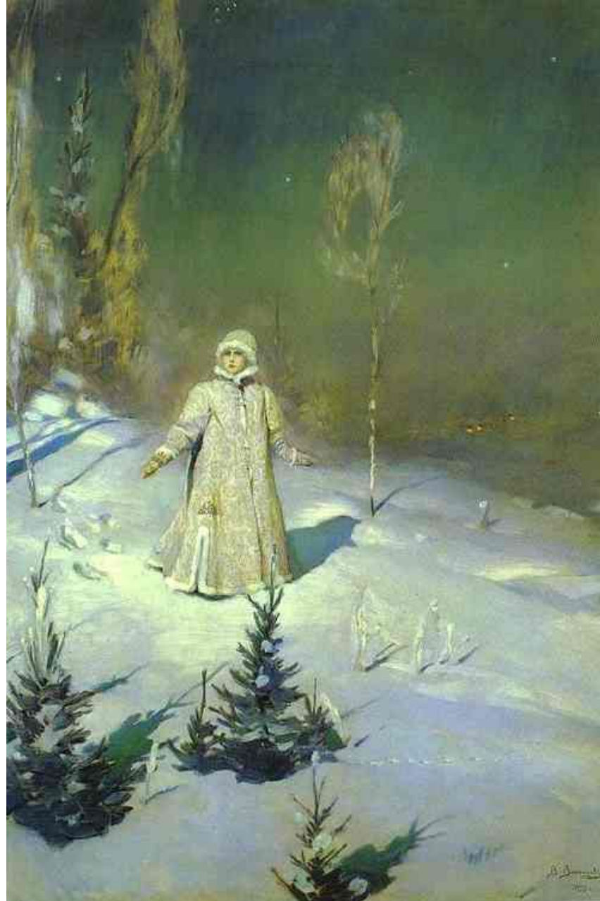
В. М. Васнецов. Снегурочка. 1899 г.