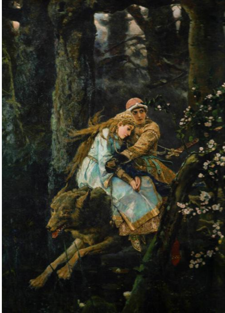
В. М. Васнецов "Иван Царевич на Сером волке"