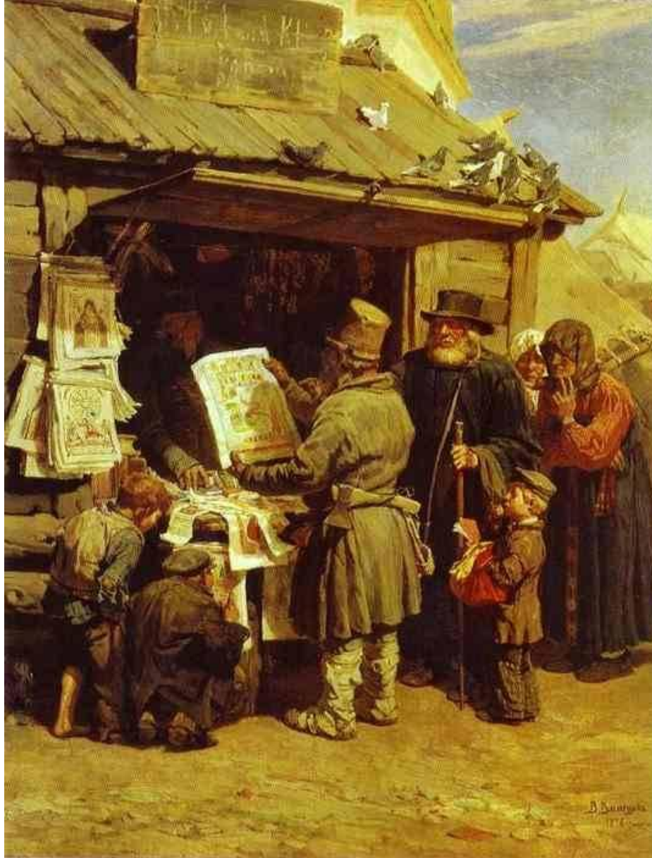
В. М. Васнецов. Книжная лавочка. 1876 г.