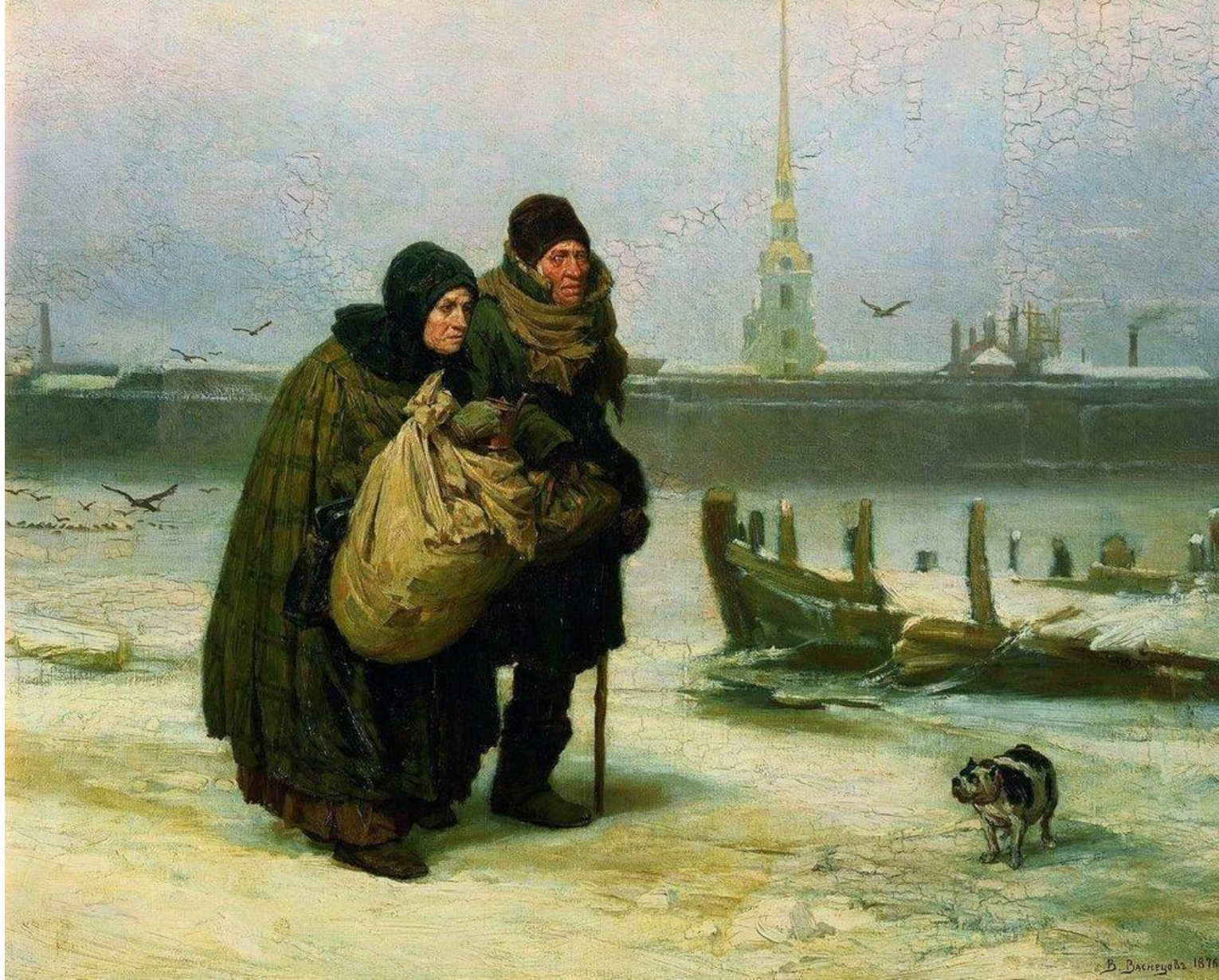
В. М. Васнецов. С квартиры на квартиру. 1876 г.