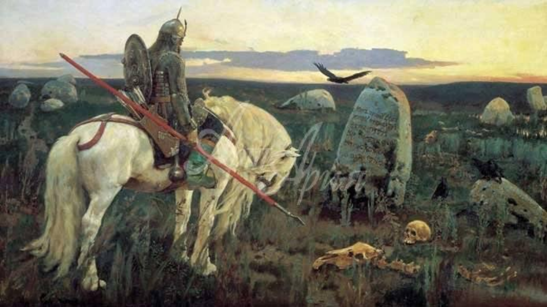
В. М. Васнецов. «Витязь на распутье». 1882 г.