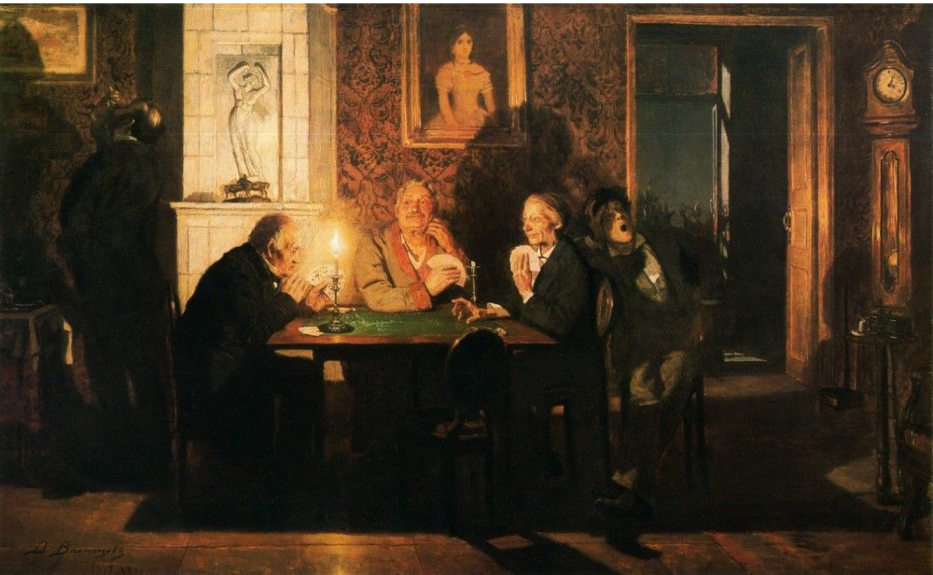
В. М. Васнецов. Преферанс. 1879 г.