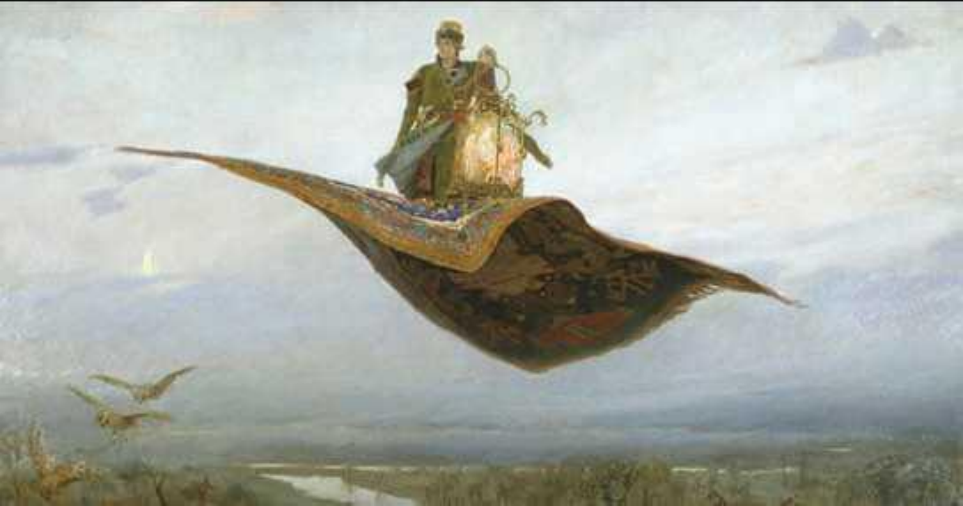
В. М. Васнецов. «Ковёр-самолёт». 1880 г. Государственный художественный музей. Нижний Новгород