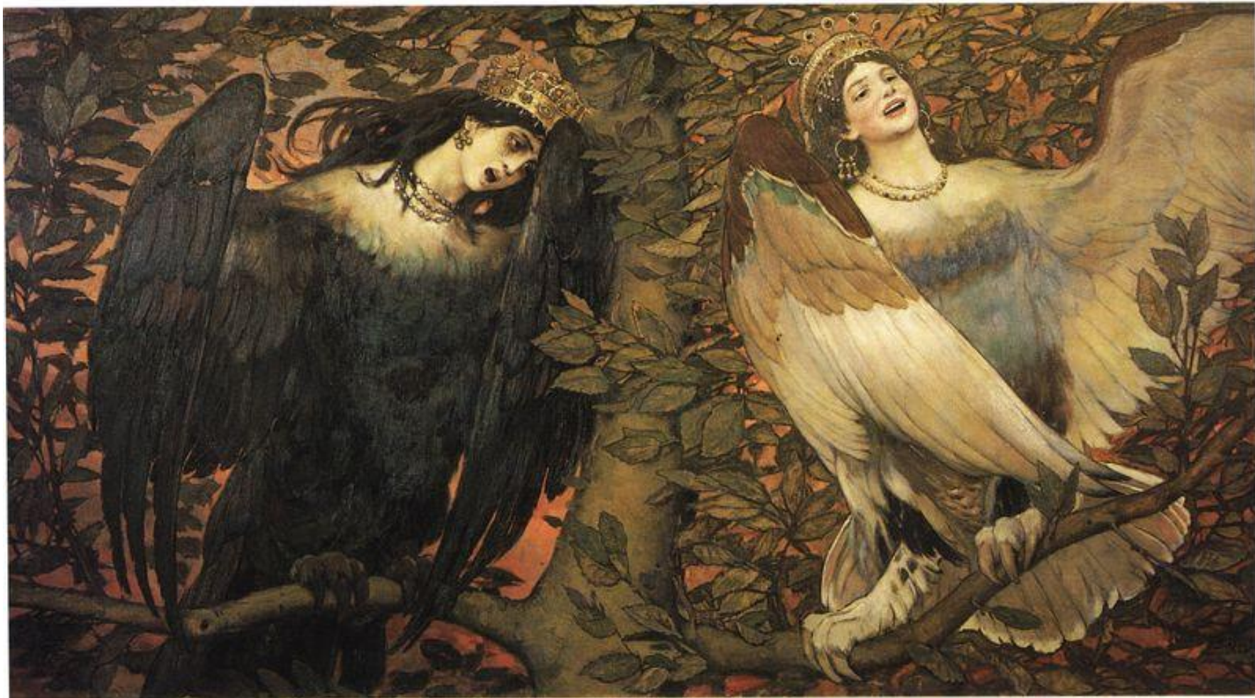
В. М. Васнецов "Сирин и Алконост. Птица радости и птица печали"