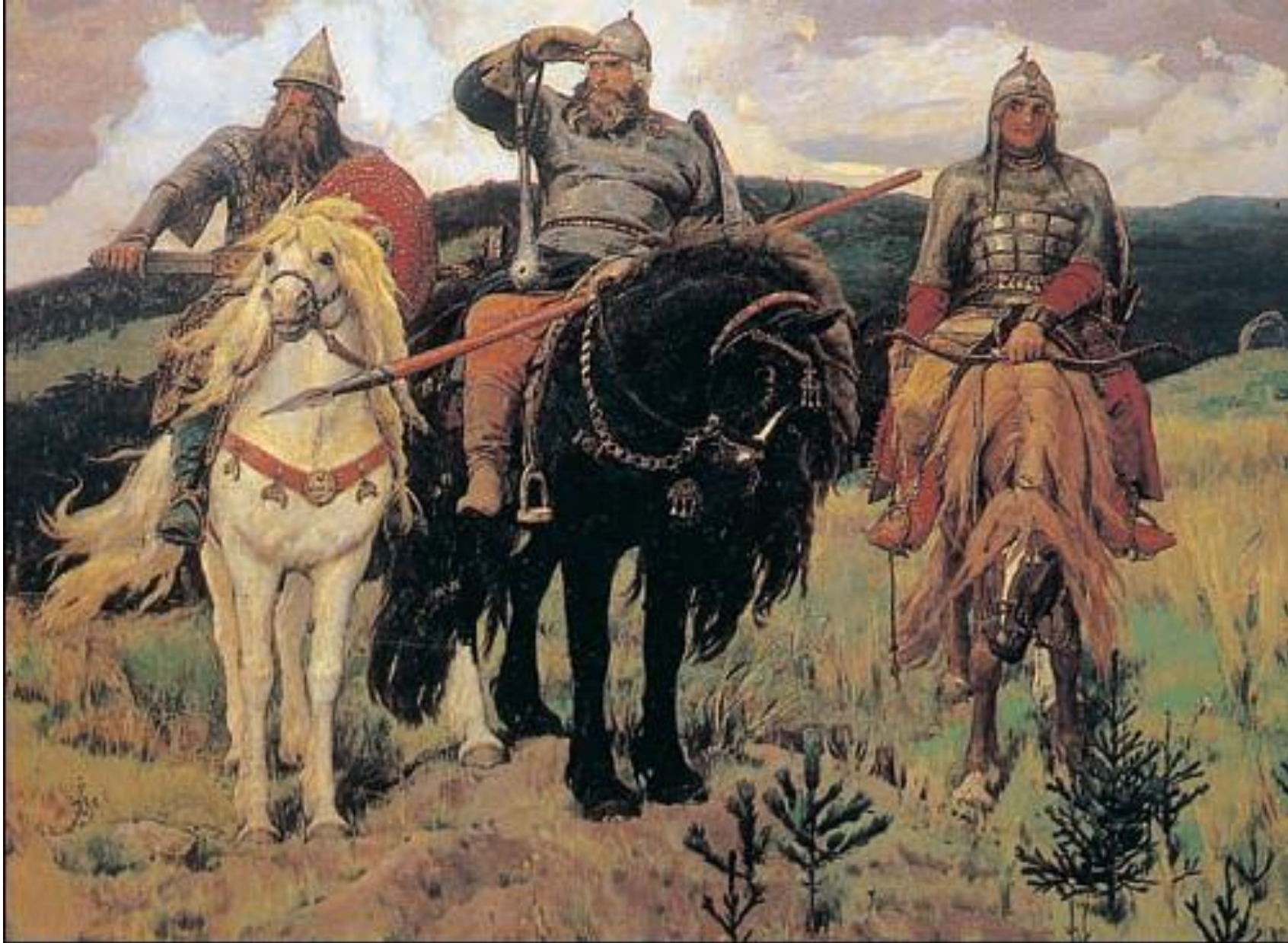
В. М. Васнецов. «Богатыри». 1881—98 гг. Государственная Третьяковская галерея