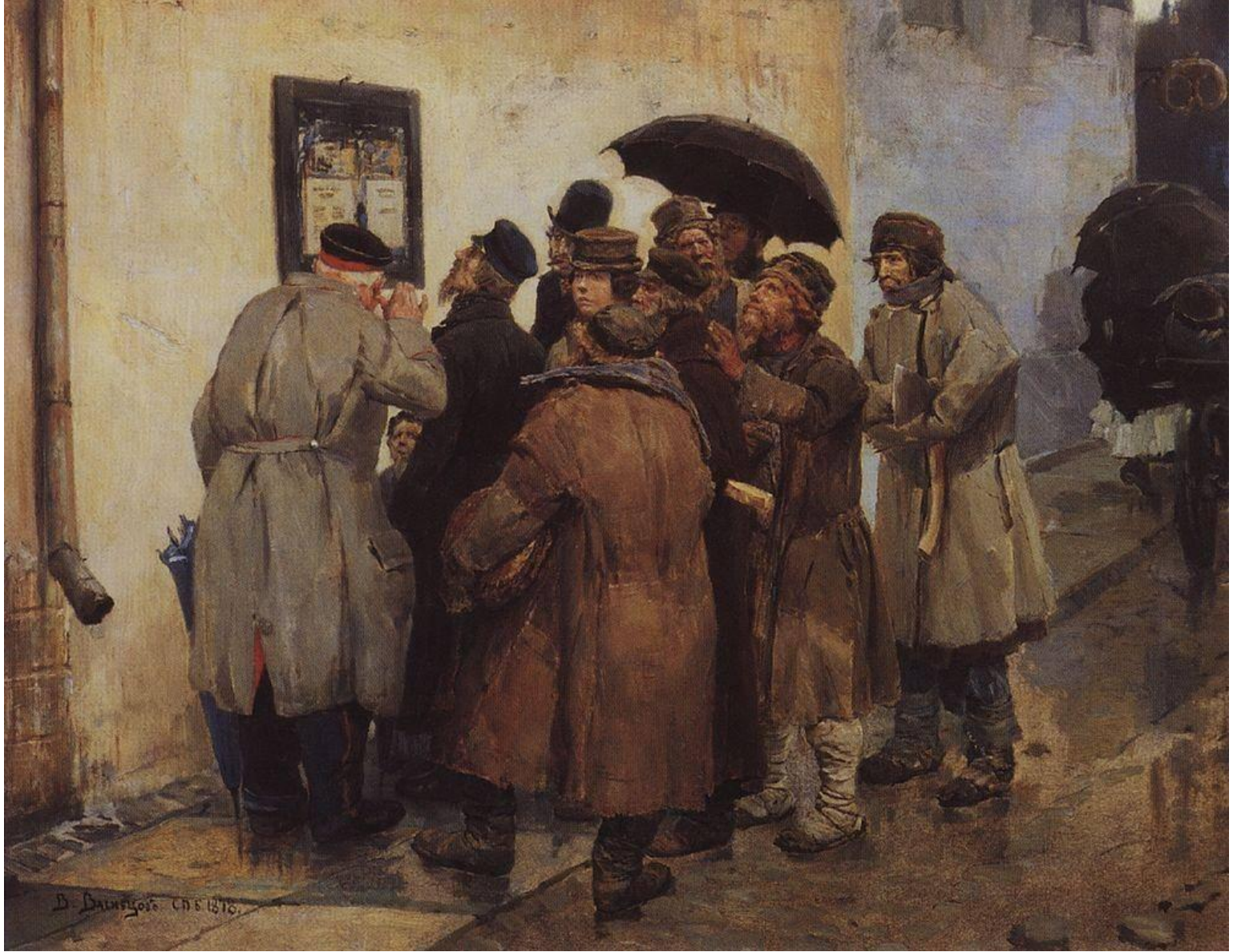
В. М. Васнецов. «Военная телеграмма». 1878 г.