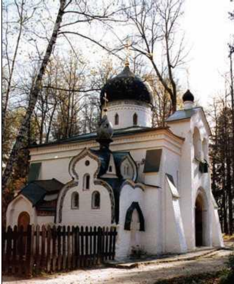
В. М. Васнецов. Церковь Спаса Нерукотворного в Абрамцево. 1881—82 гг.