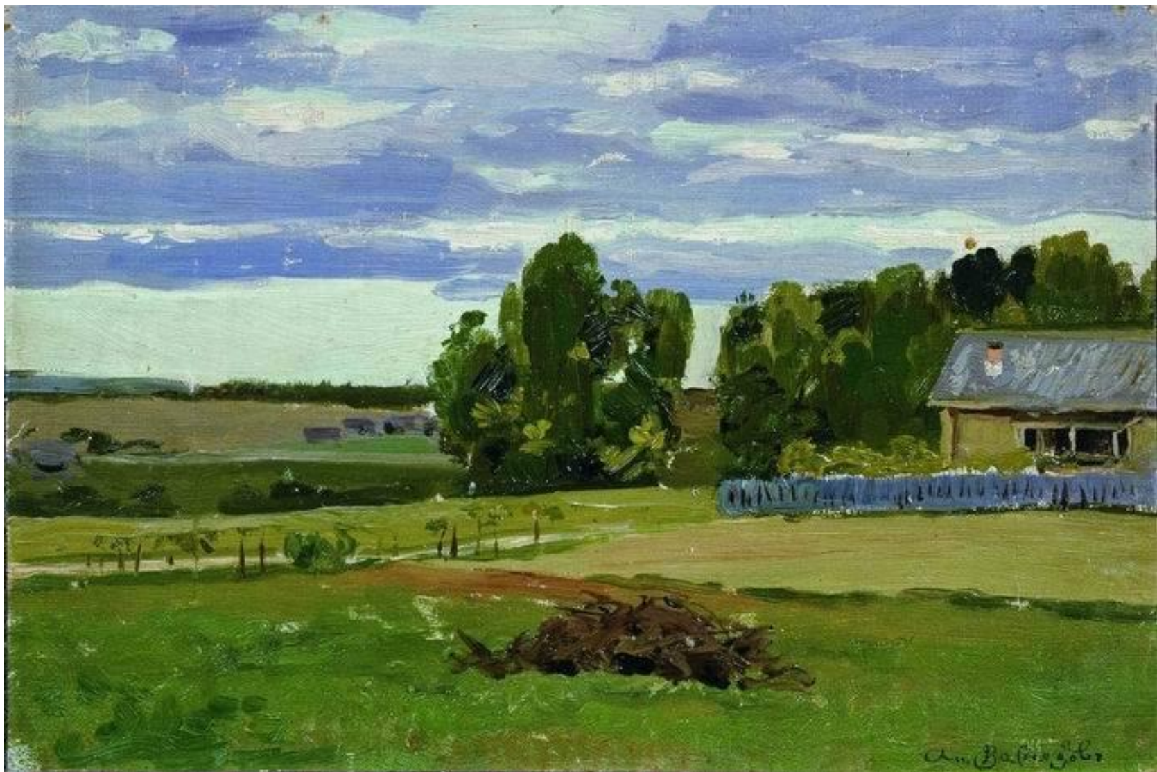
А. М. Васнецов. «Яшкин дом». 1886 г.