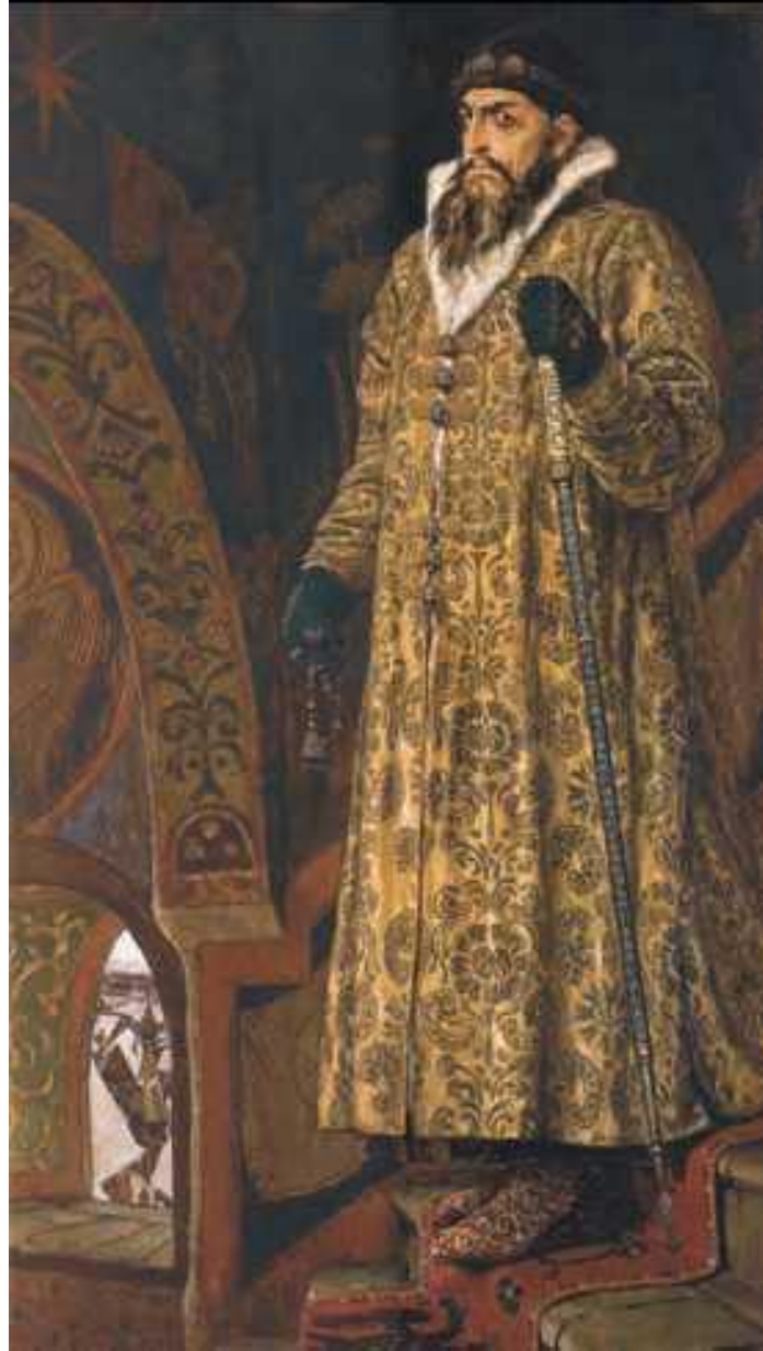
В. М. Васнецов. «Царь Иван Васильевич Грозный». 1897 г. Государственная Третьяковская галерея