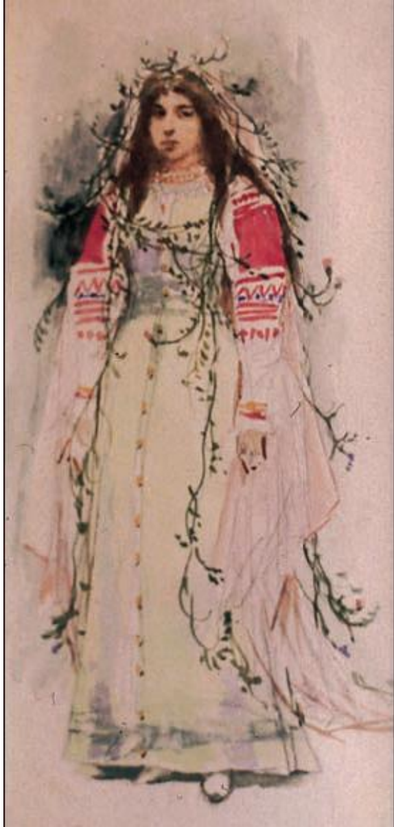
В. М. Васнецов. Эскиз костюма Весны к «Снегурочке» А. Н. Островского. 1886 г.