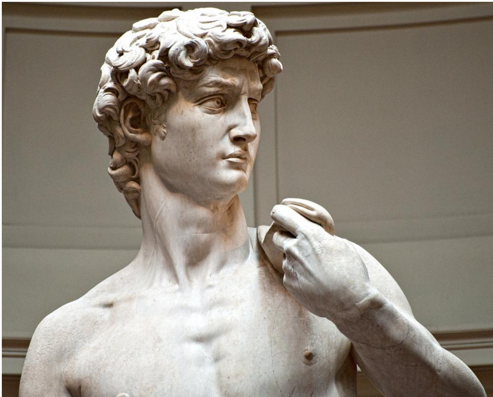
Микеланджело. Давид. Мрамор.