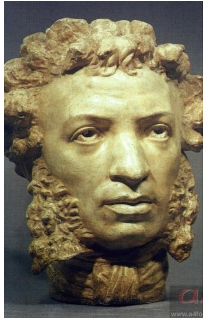
А.М. Опекушин. Пушкин.