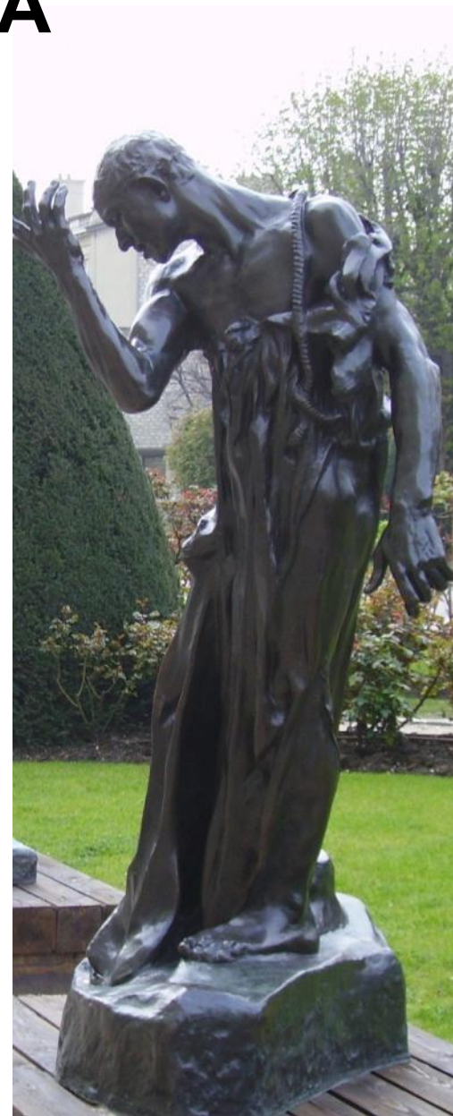
О. Роден. Граждане Кале. Бронза.