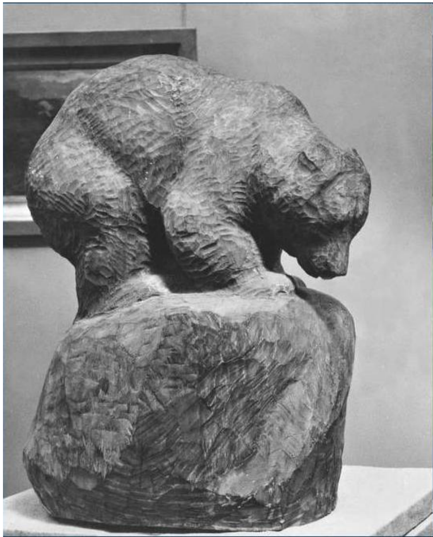
В.А. Ватагин. Медведь. Дерево.