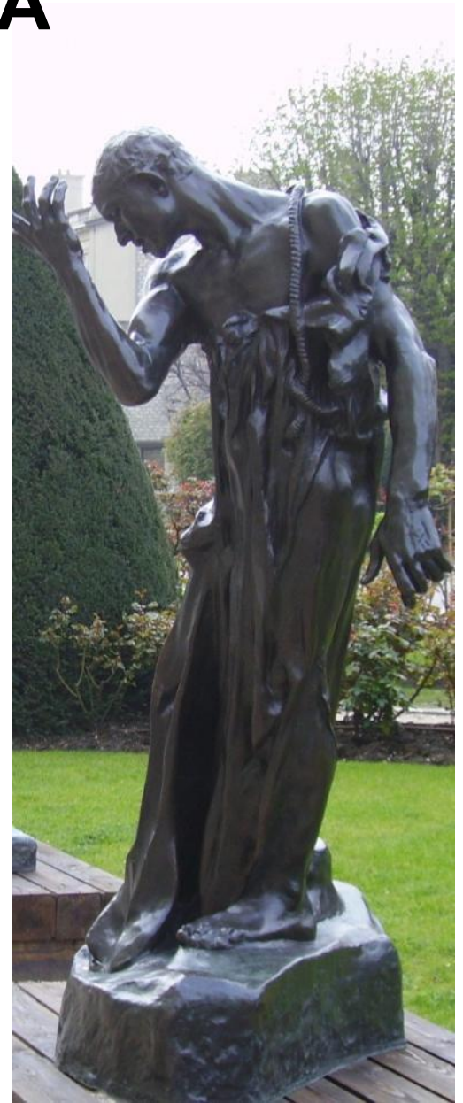
О. Роден. Граждане Кале. Бронза.