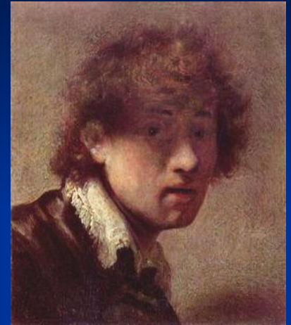
« Юношеский автопортрет »