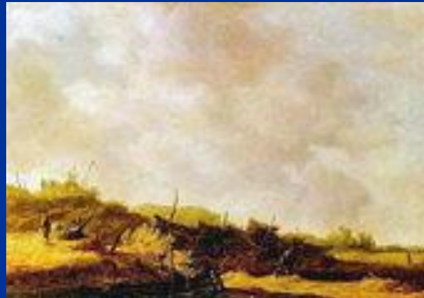
«Пейзаж с дюнами»