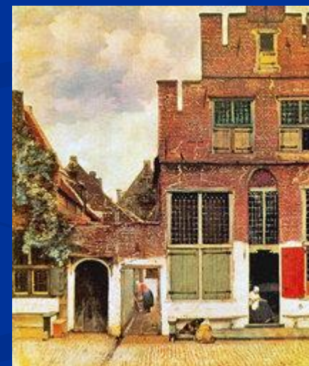
«Маленькая улочка в Дельфте» Вермер Ян Дельфтский