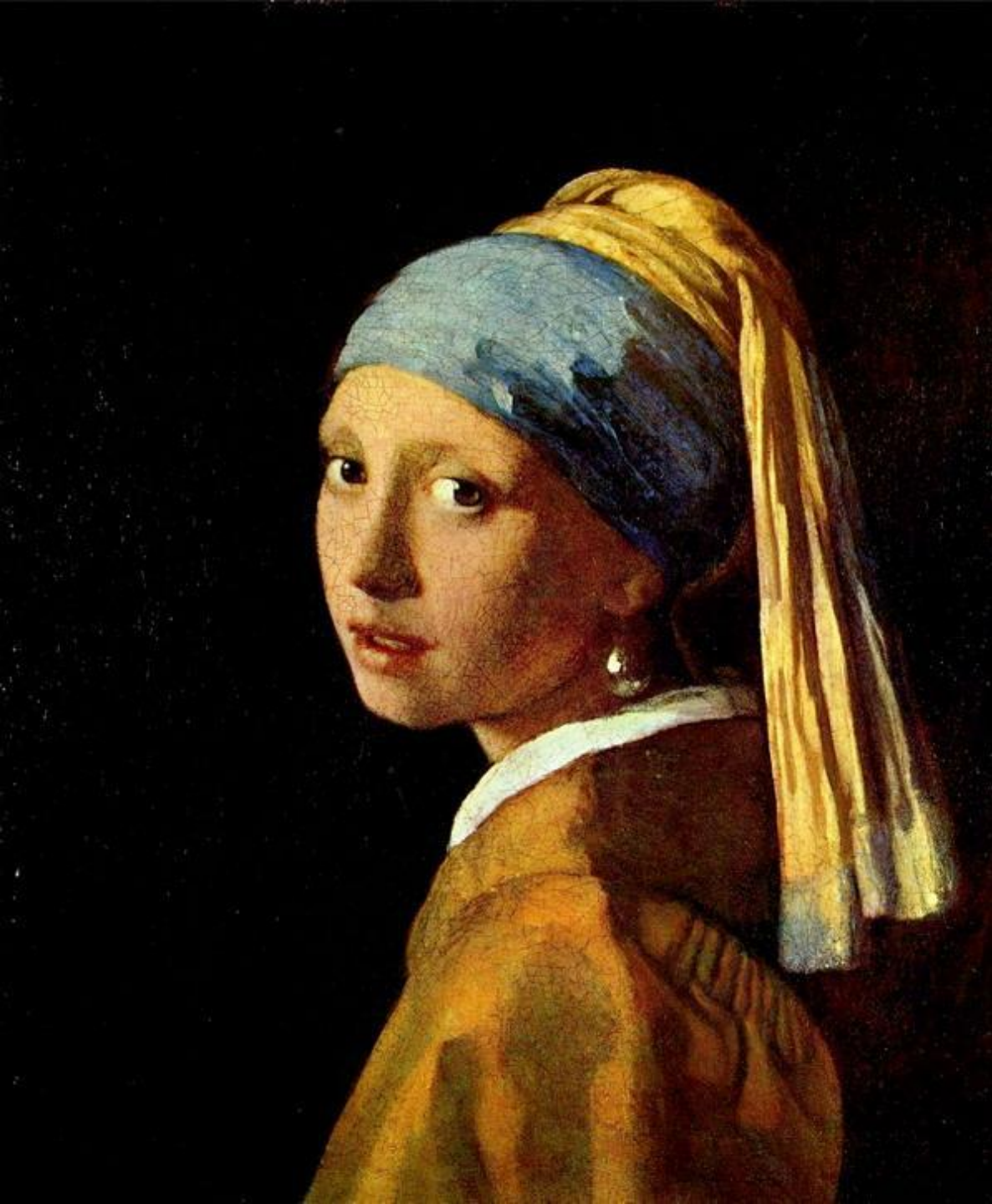
« Девушка с жемчужными серьгами » Вермер Ян Дельфтский