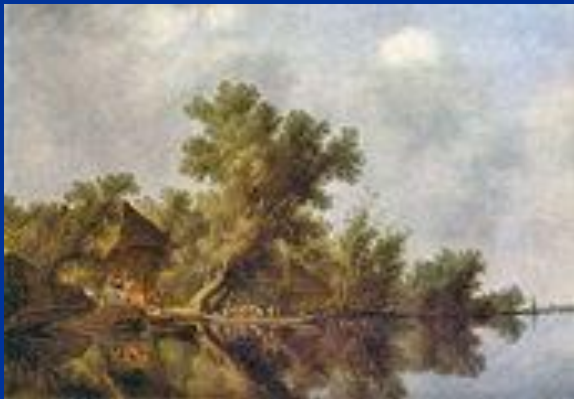
«Речной пейзаж с паромом»