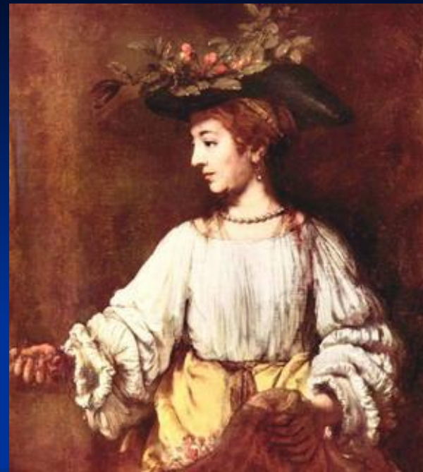
« Хендрикье в виде Флоры »