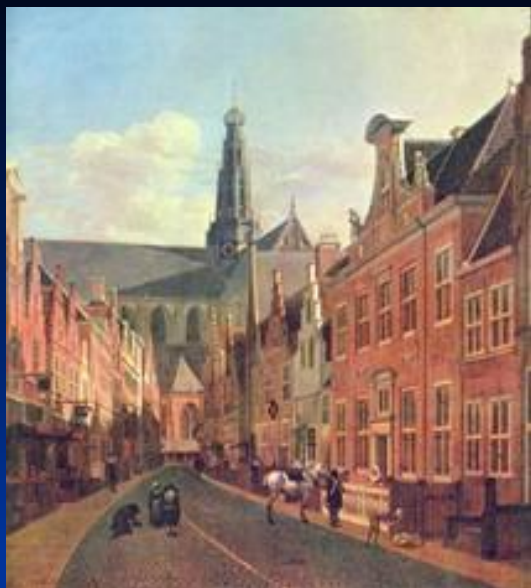
«Улица в Гарлеме» Беркхейд Геррит Адриенс