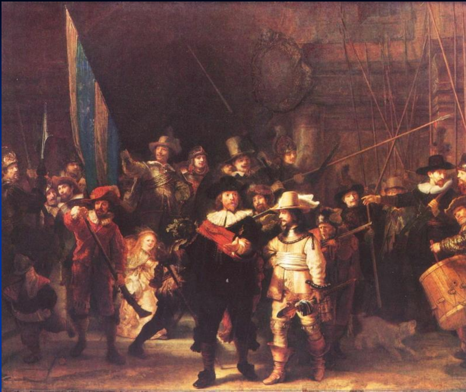
« Ночная стража »