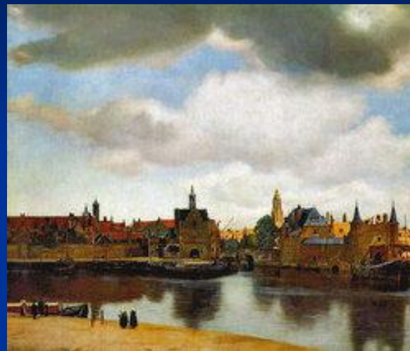
«Вид Дельфта» Вермер Ян Дельфтский