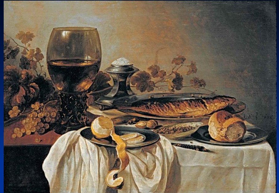
«Завтрак» Клас Питер