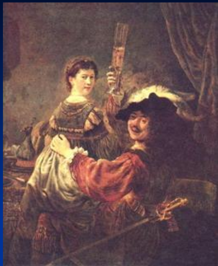
« Автопортрет с Саскией на колених »