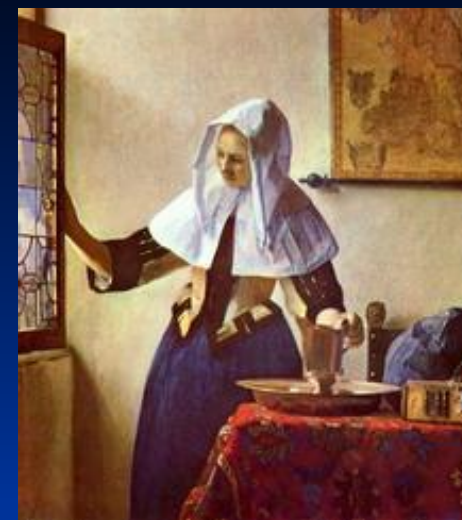
« Молодая женщина с кувшином у окна » Вермер Ян Дельфтский