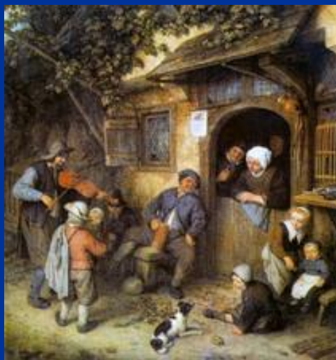
« Скрипач » Остаде Адриан