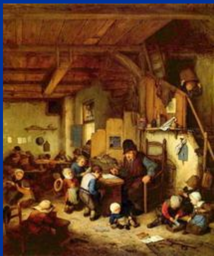
« Учитель » Остаде Адриан