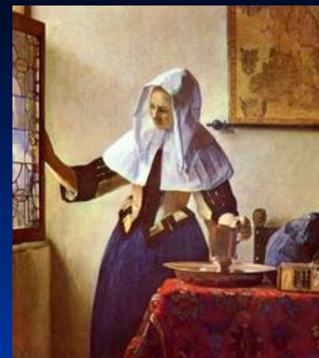
« Молодая женщина с кувшином у окна » Вермер Ян Дельфтский