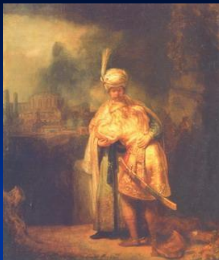
« Прощание Давида с Ионафаном »