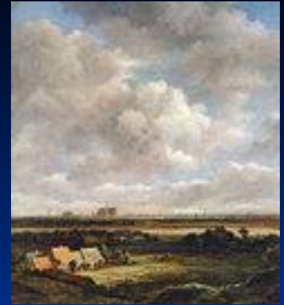
«Вид на Харлем»