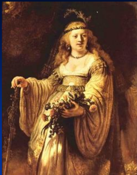
« Портрет Саскии в виде Флоры »