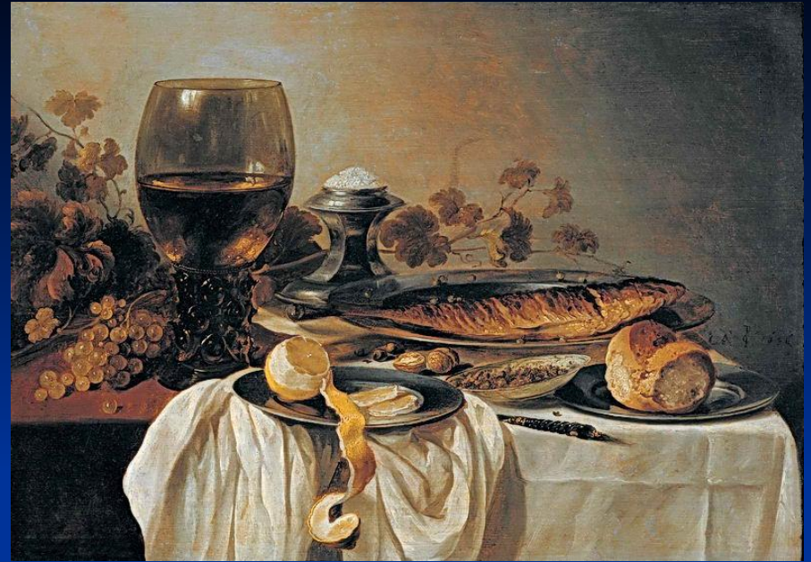
«Завтрак» Клас Питер