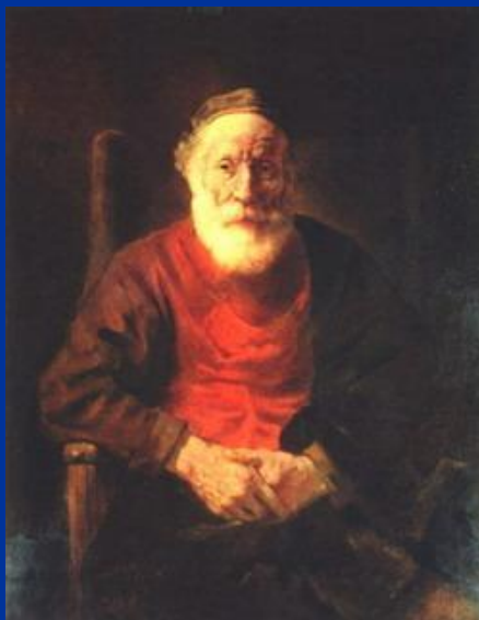
« Старик в кресле »