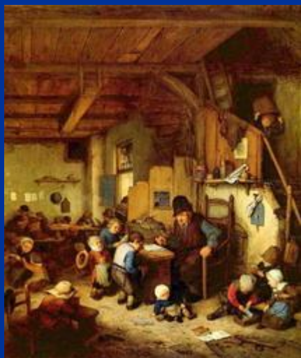
« Учитель » Остаде Адриан