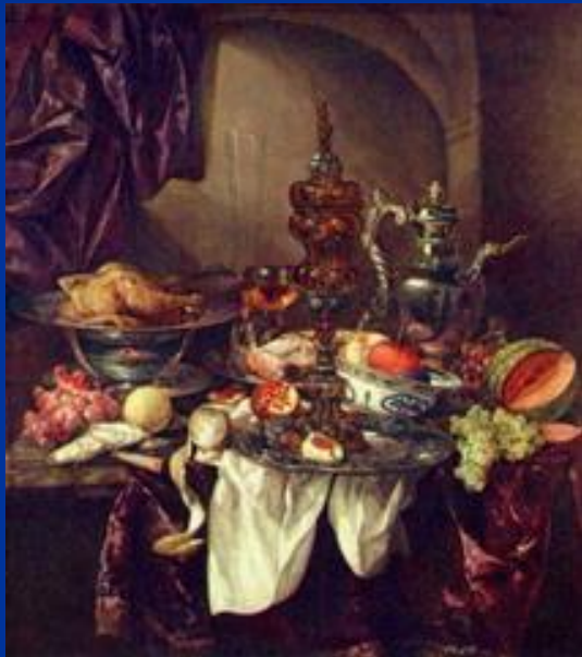
«Роскошный натюрморт» Бейерен Абрахам Хендрикс