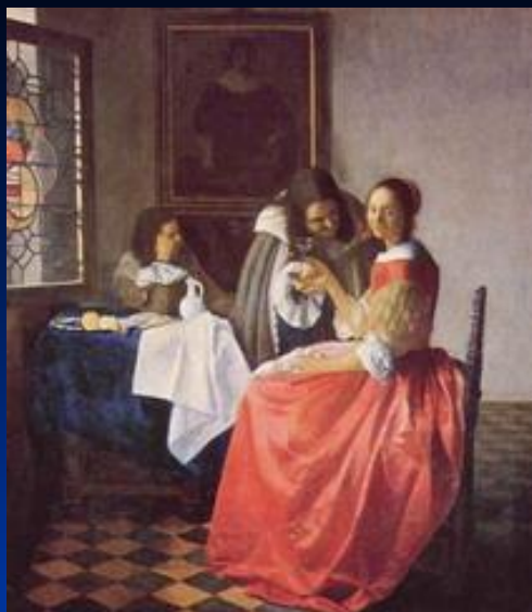
« Девушка с винным бокалом » Вермер Ян Дельфтский