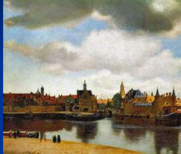
«Вид Дельфта» Вермер Ян Дельфтский