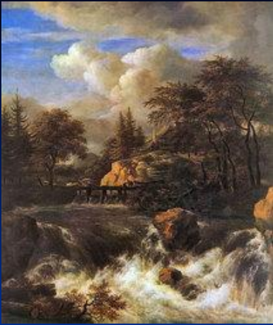
«Скалистый пейзаж с водопадом»