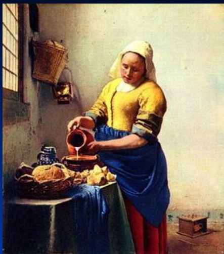
« Служанка, наливающая молоко » Вермер Ян Дельфтский