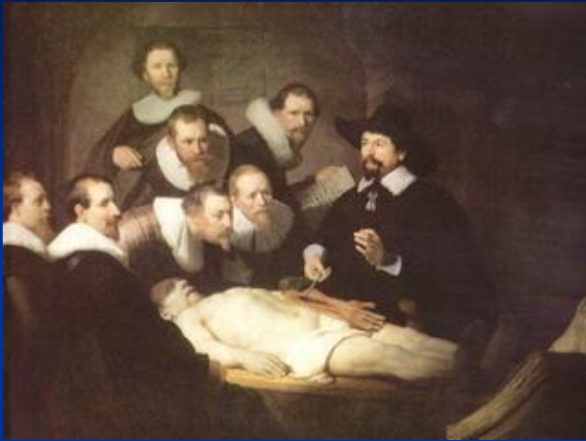
« Урок анатомии доктора Тулпа »