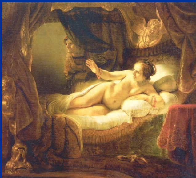
« Даная »