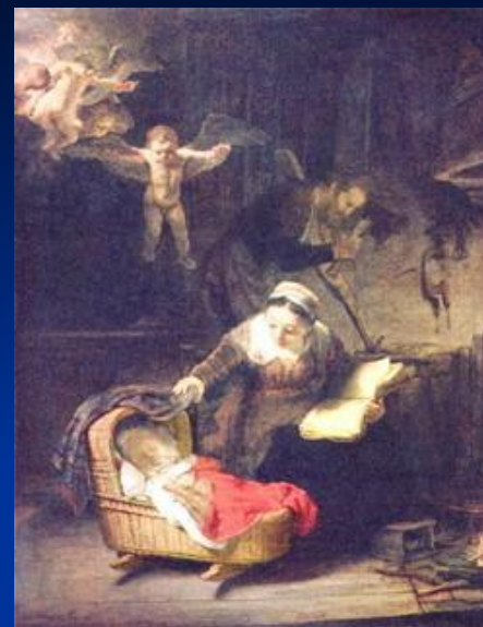
« Святое семейство »