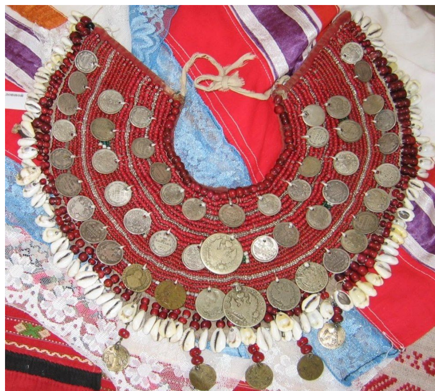
Су́ха (ворот) - девичье шейно-наплечное украшение. 19 в.