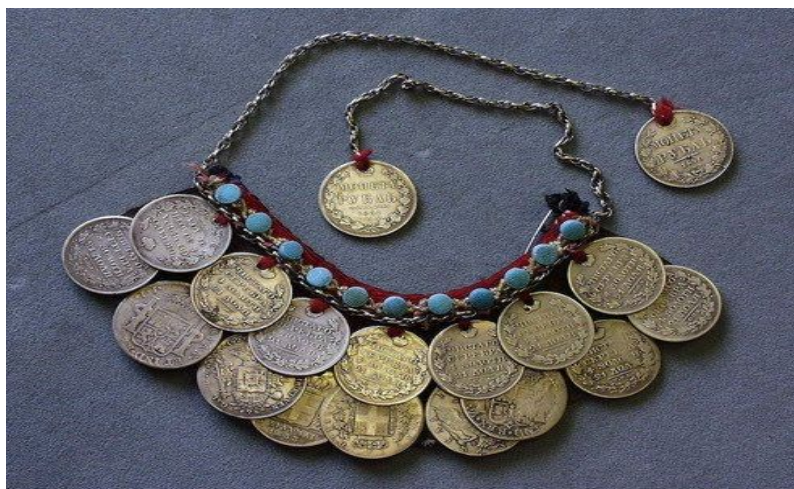
Шейное украшение пус хыҫ. 19в.