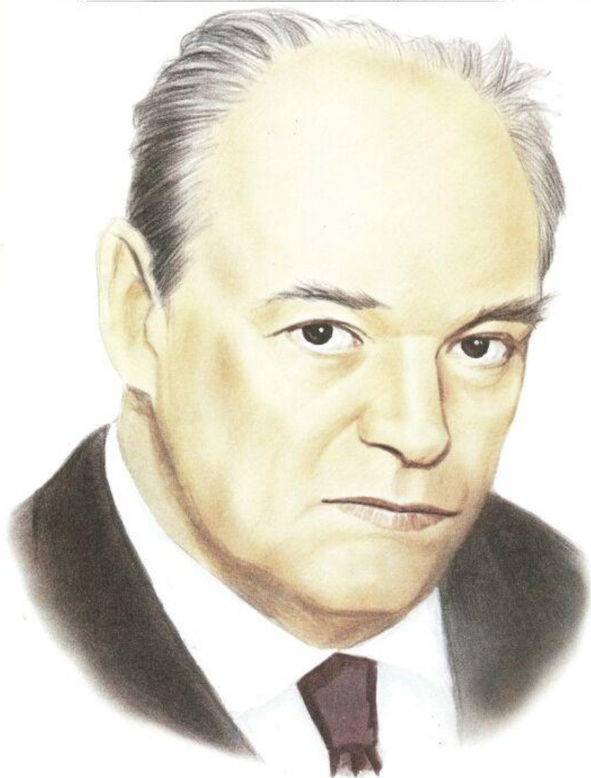
Чарушин Евгений Иванович (1901-1965)