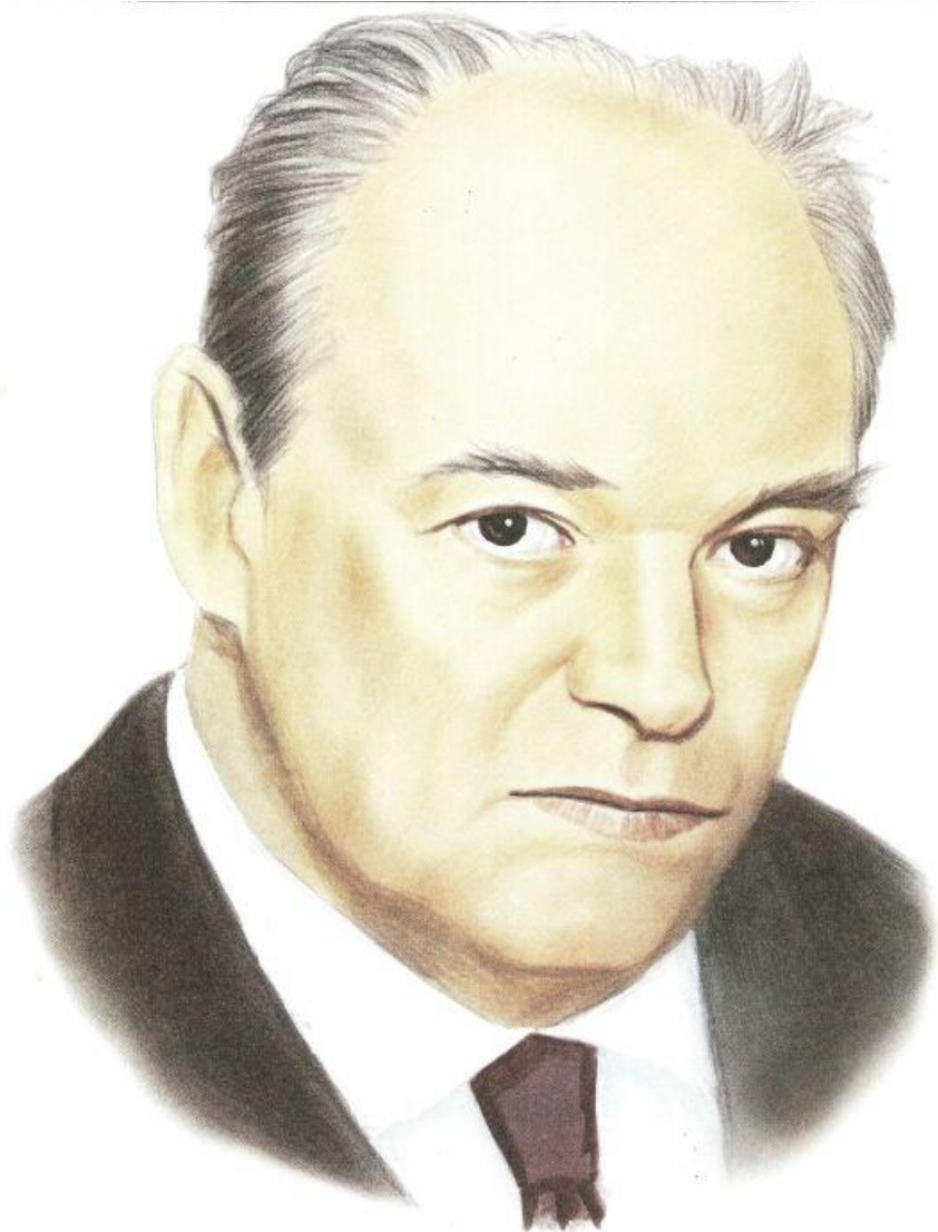
Чарушин Евгений Иванович (1901-1965)