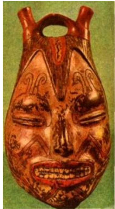
Сосуд. Керамика. Культура инков.