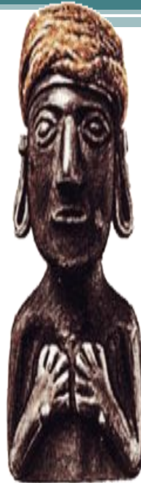
Верховный правитель Инка.