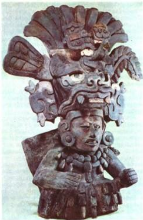
Ритуальная урна (деталь).