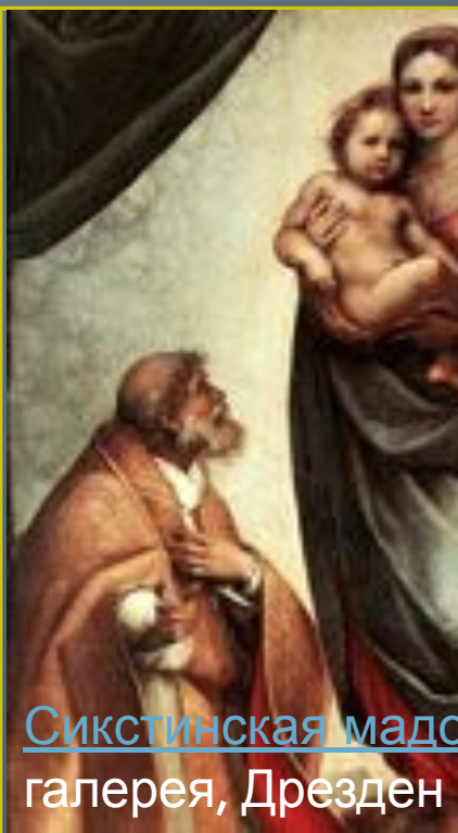
Сикстинская мадонна галерея, Дрезден