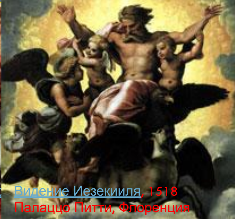
Видение Иезекииля , 1518 Палаццо Питти, Флоренция