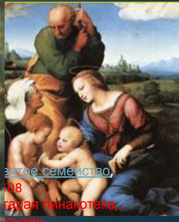
Святое семейство , 1508 Старая пинакотека, Мюнхен

Произведения этого периода творчества Рафаэля Санти отмечены тонкой поэзией и мягким лиризмом пейзажных фонов ("Сон рыцаря", Национальная галерея, Лондон; "Три грации", Музей Конде, Шантийи; "Мадонна Конестабиле", Эрмитаж, Санкт-Петербург; все — около 1500-1502). Близок по композиционному решению фреске Перуджино "Передача ключей святому Петру" в Сикстинской капелле Ватикана алтарный образ Рафаэля "Обручение Марии" (1504 Галерея Брера, Милан)