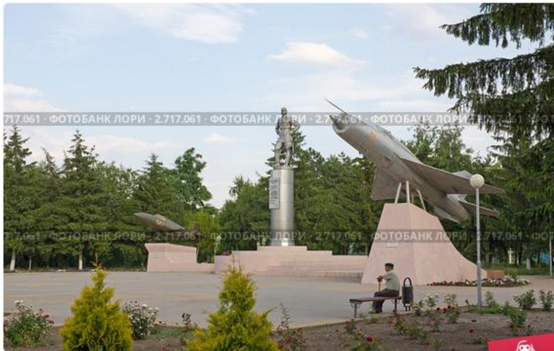
Памятник лётчику-испытателю Григорию Бахчиванджи в станице Бриньковской