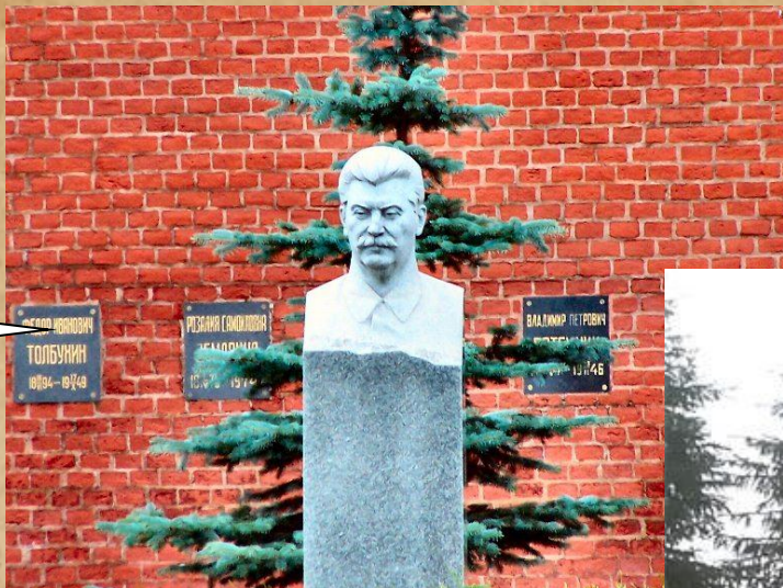
Памятник Маршалу Толбухину Ф.И. в Москве

Похоронен на Красной площади в Москве у Кремлевской стены.