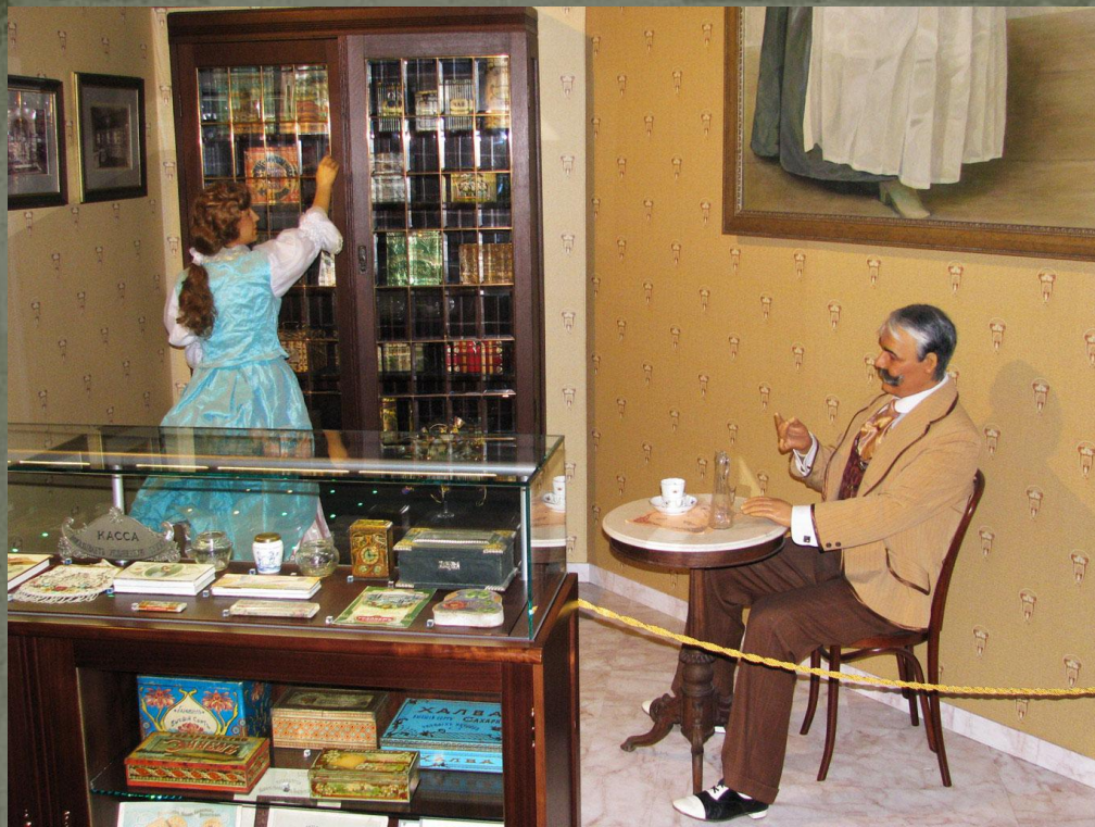
Музей Истории Шоколада и Какао (МИШКа) – кондитерской фабрики «Красный Октябрь» и Кондитерского концерна «Бабаевский»