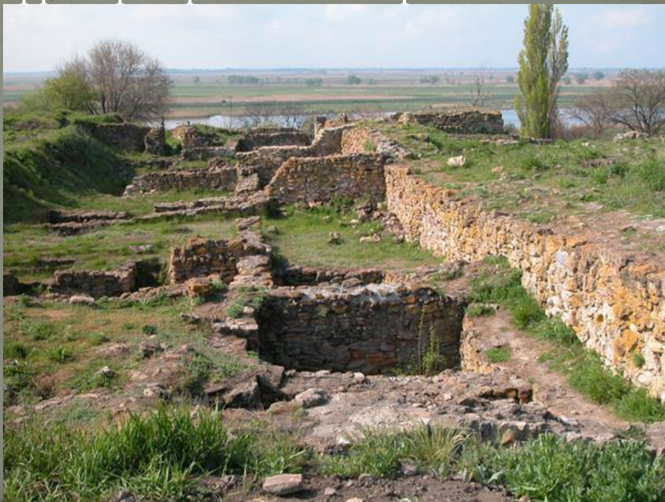
Археологический музей-заповедник Танаис

экспонирует преимущественно материалы, полученные в результате раскопок, проведенных на территории различных стран.