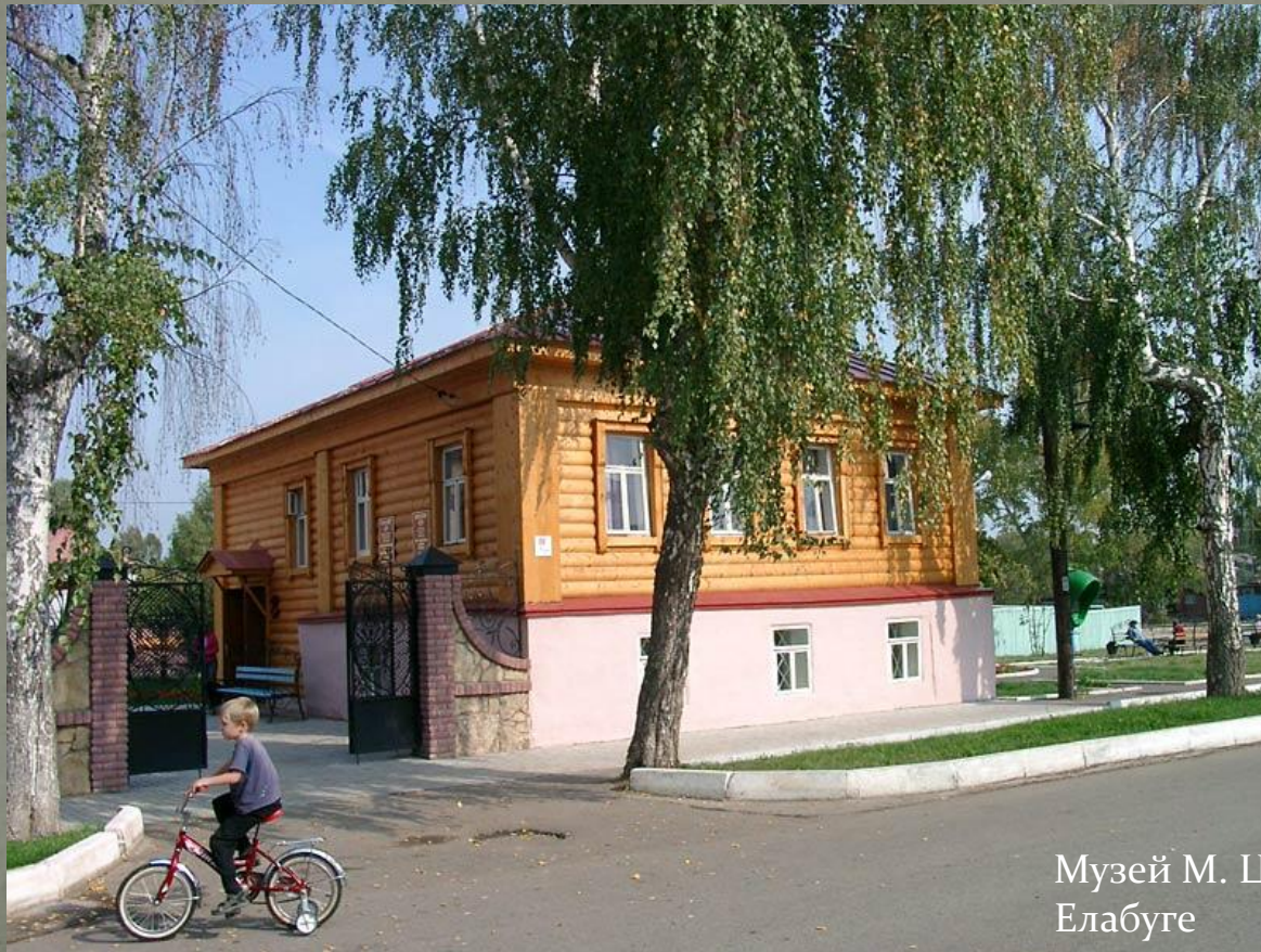
Музей М. Цветаевой в Елабуге

научно-исследовательские и научно-просветительские учреждения, осуществляющие собирание, хранение, экспонирование и пропаганду материалов о писателях или об историко-литературном процессе в целом. В России идея создания Л. м. впервые возникла в 1837 в связи со стремлением увековечить память А. С. Пушкина.