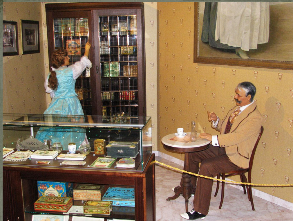
Музей Истории Шоколада и Какао (МИШКа) – кондитерской фабрики «Красный Октябрь» и Кондитерского концерна «Бабаевский»