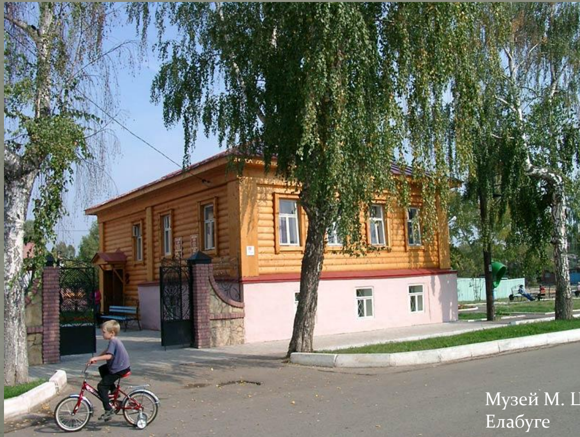
Музей М. Цветаевой в Елабуге

научно-исследовательские и научно-просветительские учреждения, осуществляющие собирание, хранение, экспонирование и пропаганду материалов о писателях или об историко-литературном процессе в целом. В России идея создания Л. м. впервые возникла в 1837 в связи со стремлением увековечить память А. С. Пушкина.