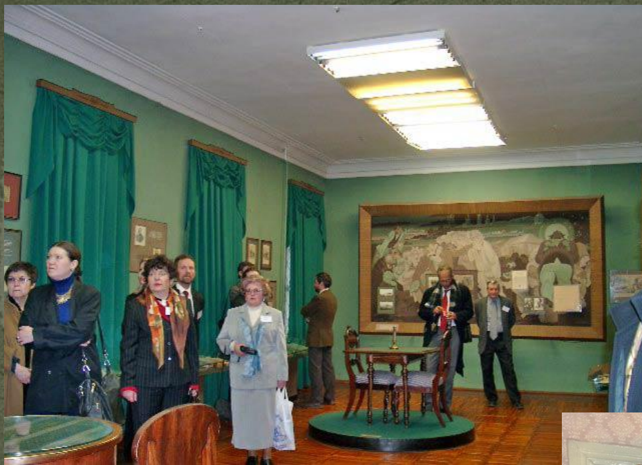
Музей Салтыкова –Щедрина в Твери