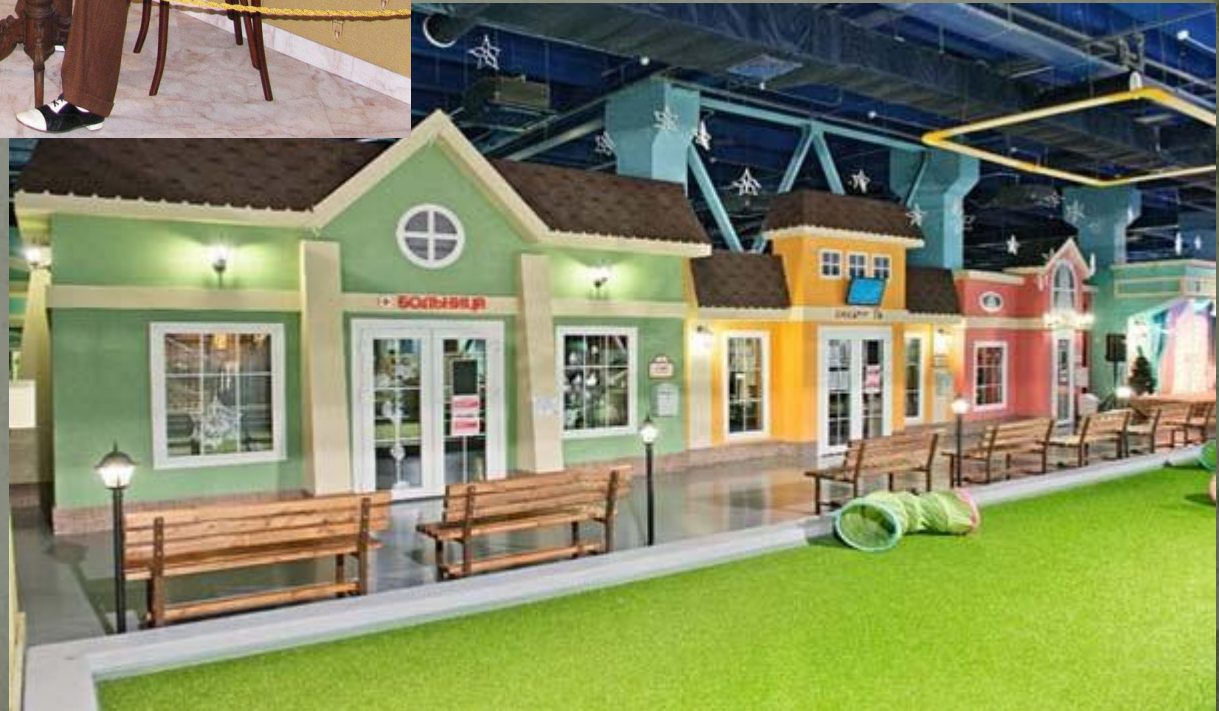
Музей профессии "КидБург". Санкт- Петербург