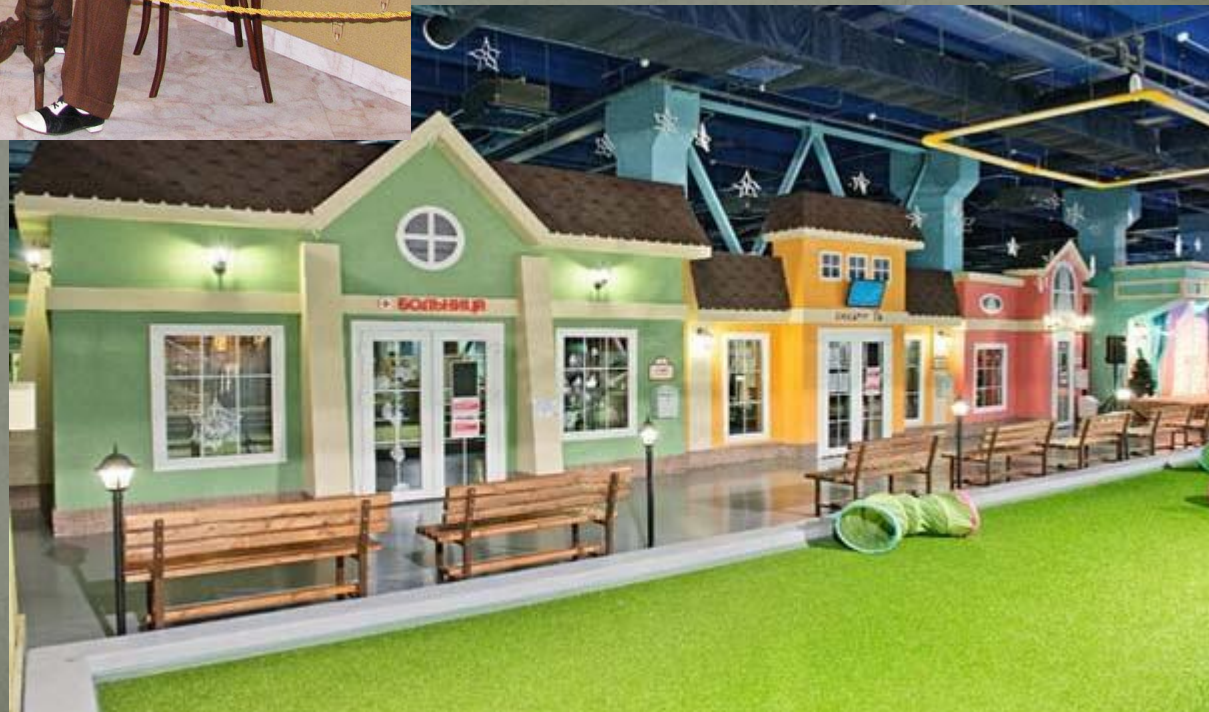
Музей профессии "Кидбург". Санкт- Петербург