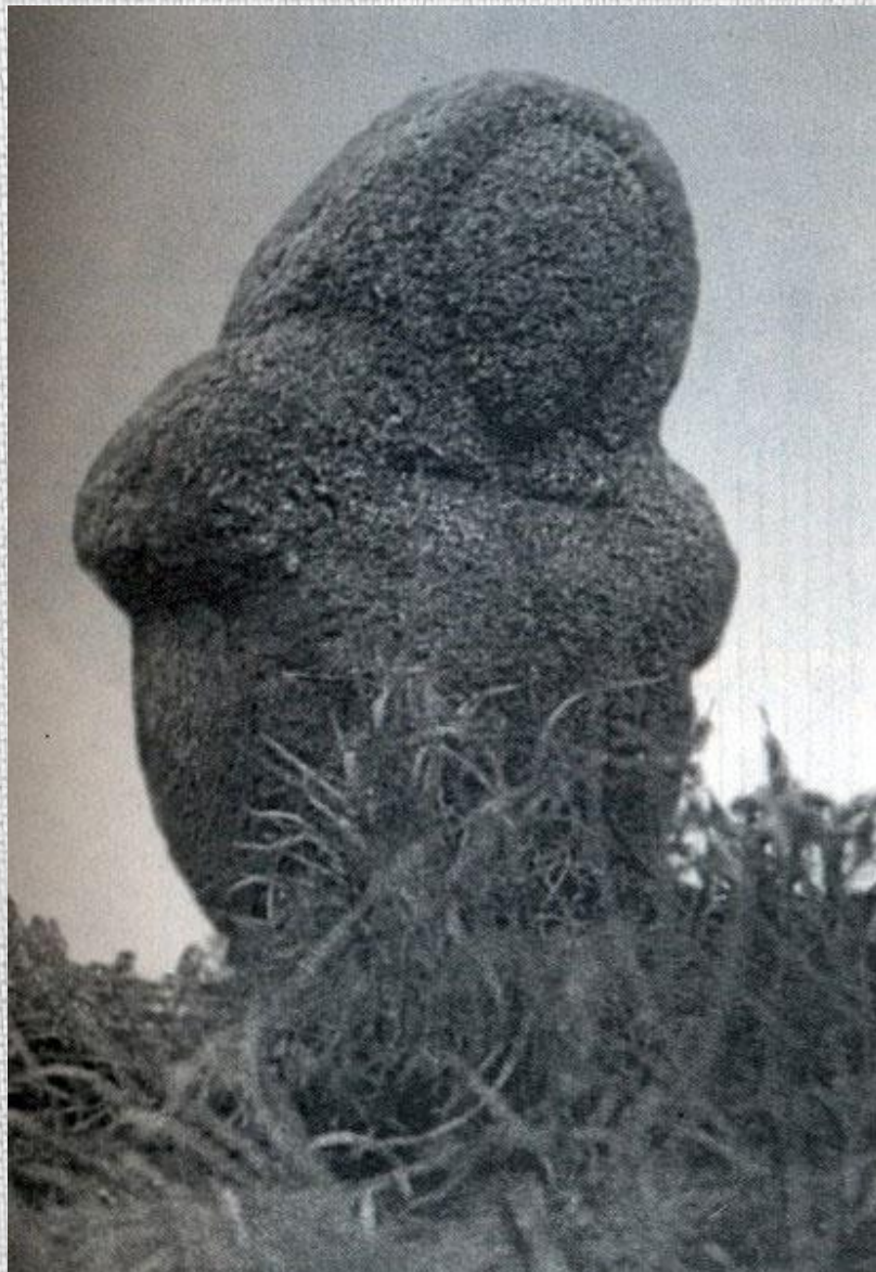
Ідал з в. Грабаўцы Жабінкаўскага раёна Брэсцкай вобласці.