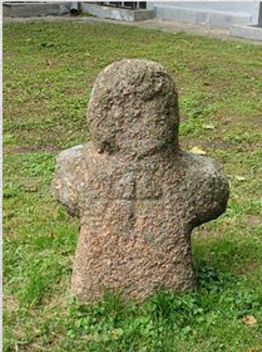
Буцьковський ідал (горад Пружаны). У хрысьціянскія часы на ім была высечана крыж.