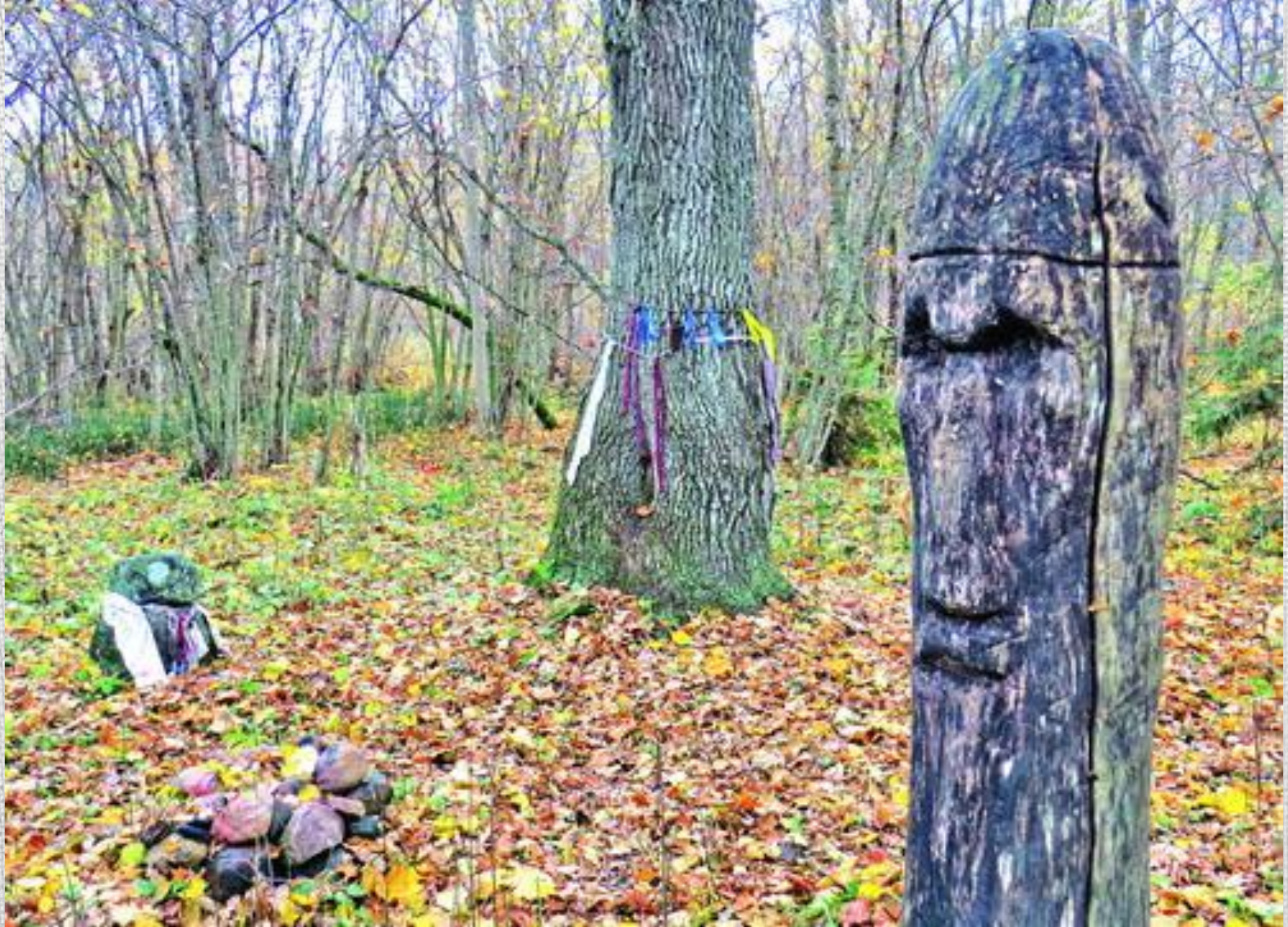
У лясах Сенненскага раёна стаіць аўтэнтычны каменны ідал. Магчыма, збудаваны ў X стагоддзі