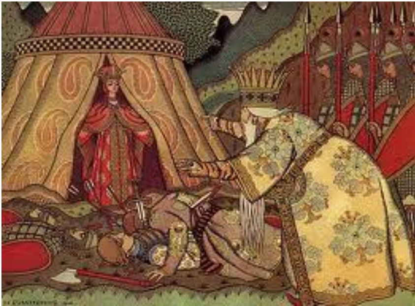
Иллюстрация к сказке А.С. Пушкина «Золотой петушок»