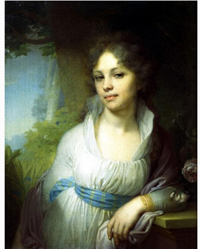
Портрет Марии Лопухиной