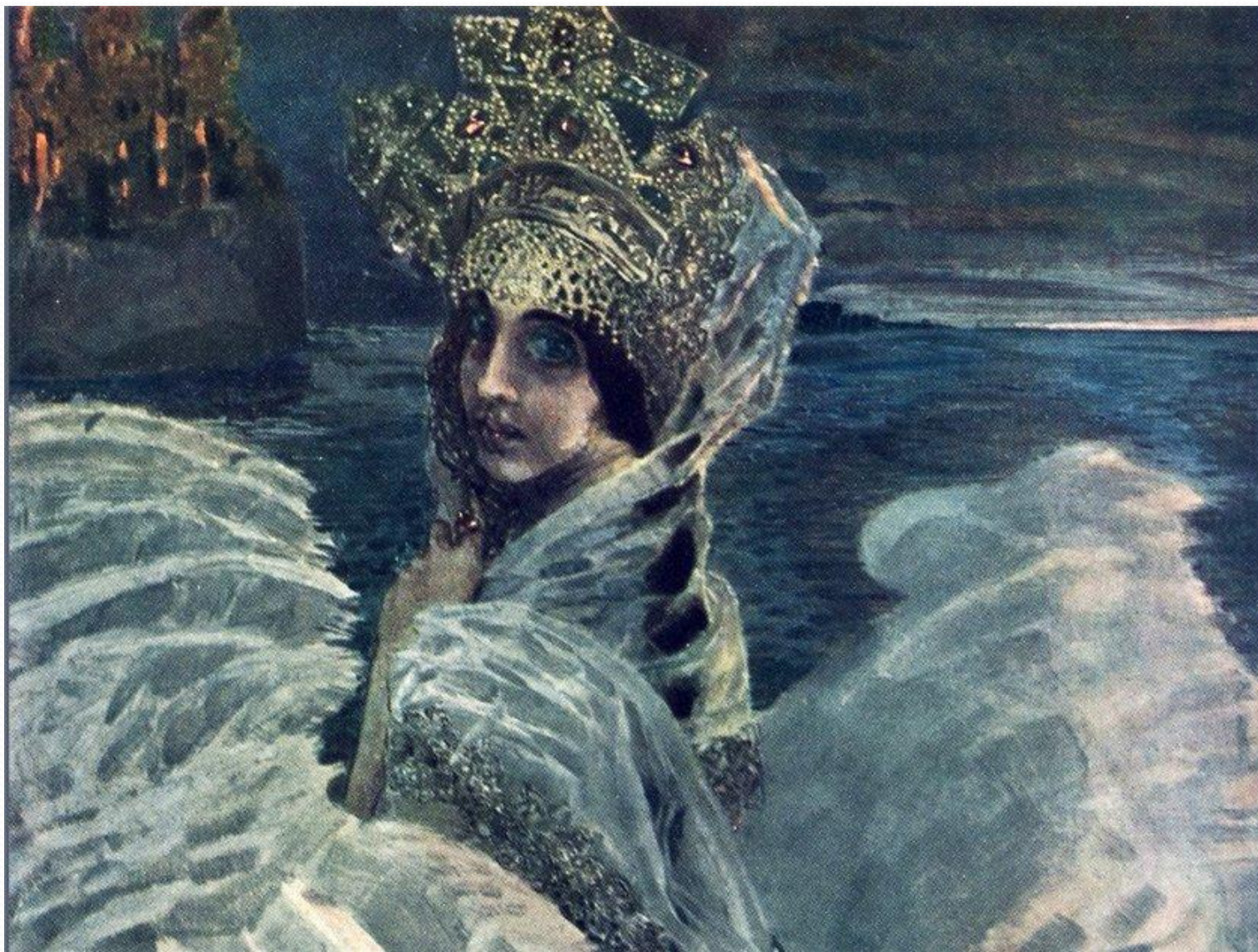
М.Врубель. Царевна Лебедь