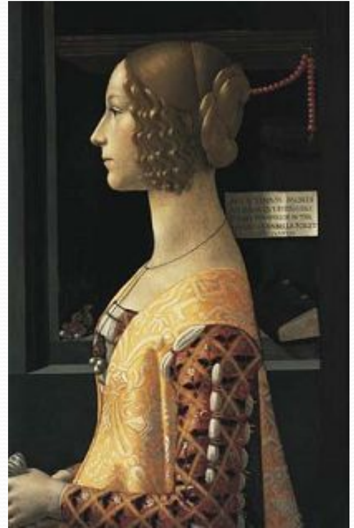
Д. Гирландайо. Портрет Джованны Торнабуони