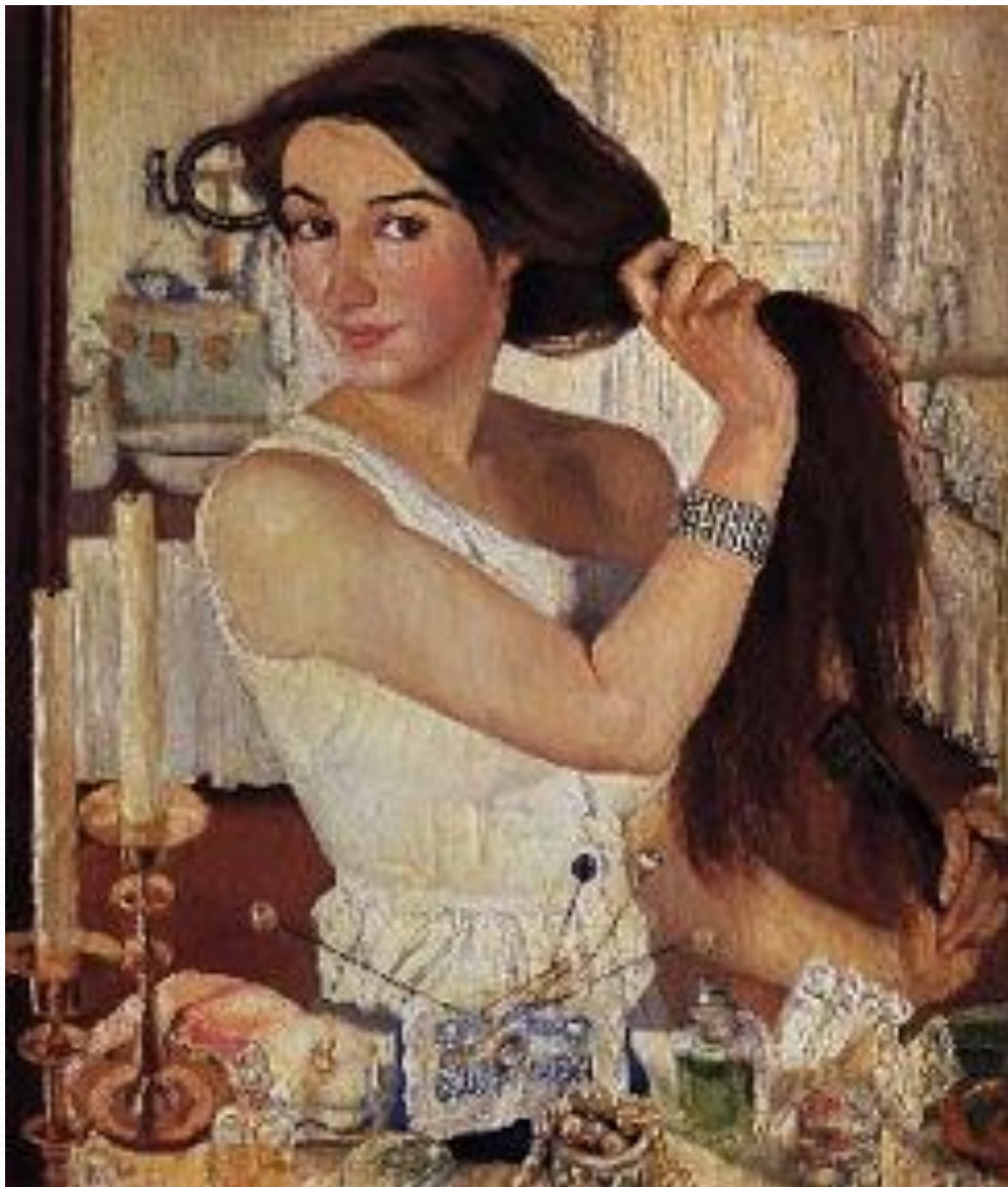
З. Серебрякова. Автопортрет