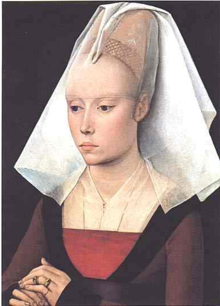
Мастерская Рогера ван дер Вейдена. Портрет богатой женщины. 1465 г.