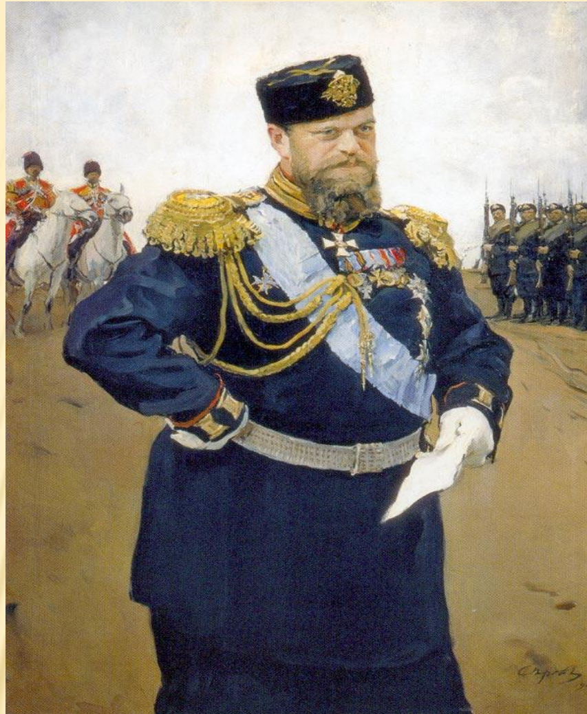
Портрет Александра III с рапортом в руках 1900