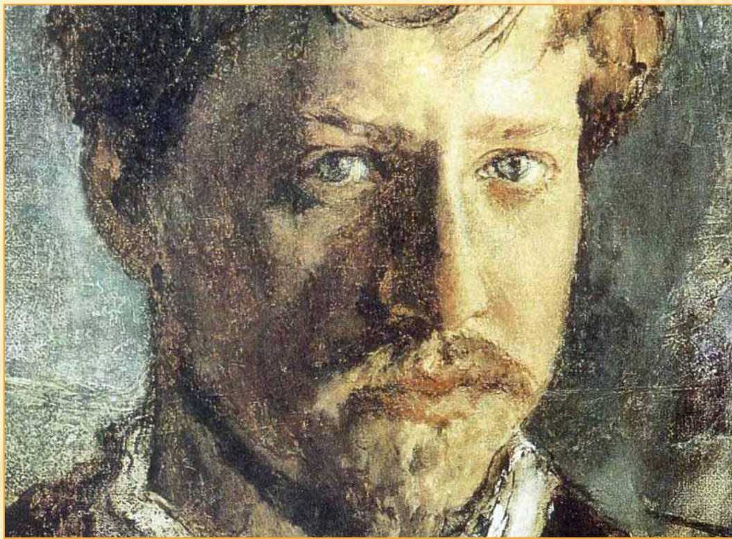
Автопортрет 1800-е годы