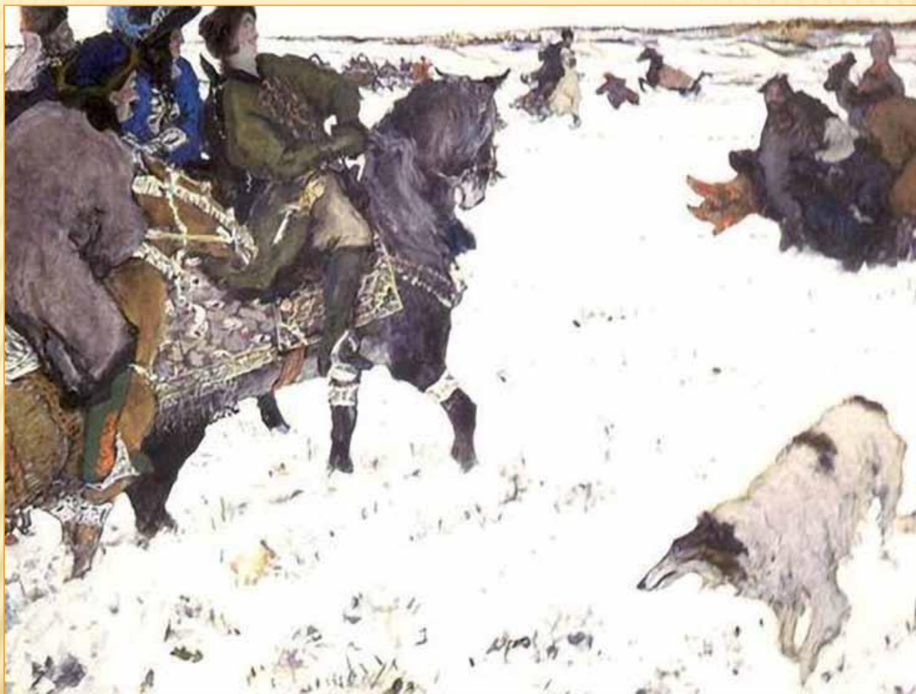
Пётр 1 на псовой охоте 1902 год