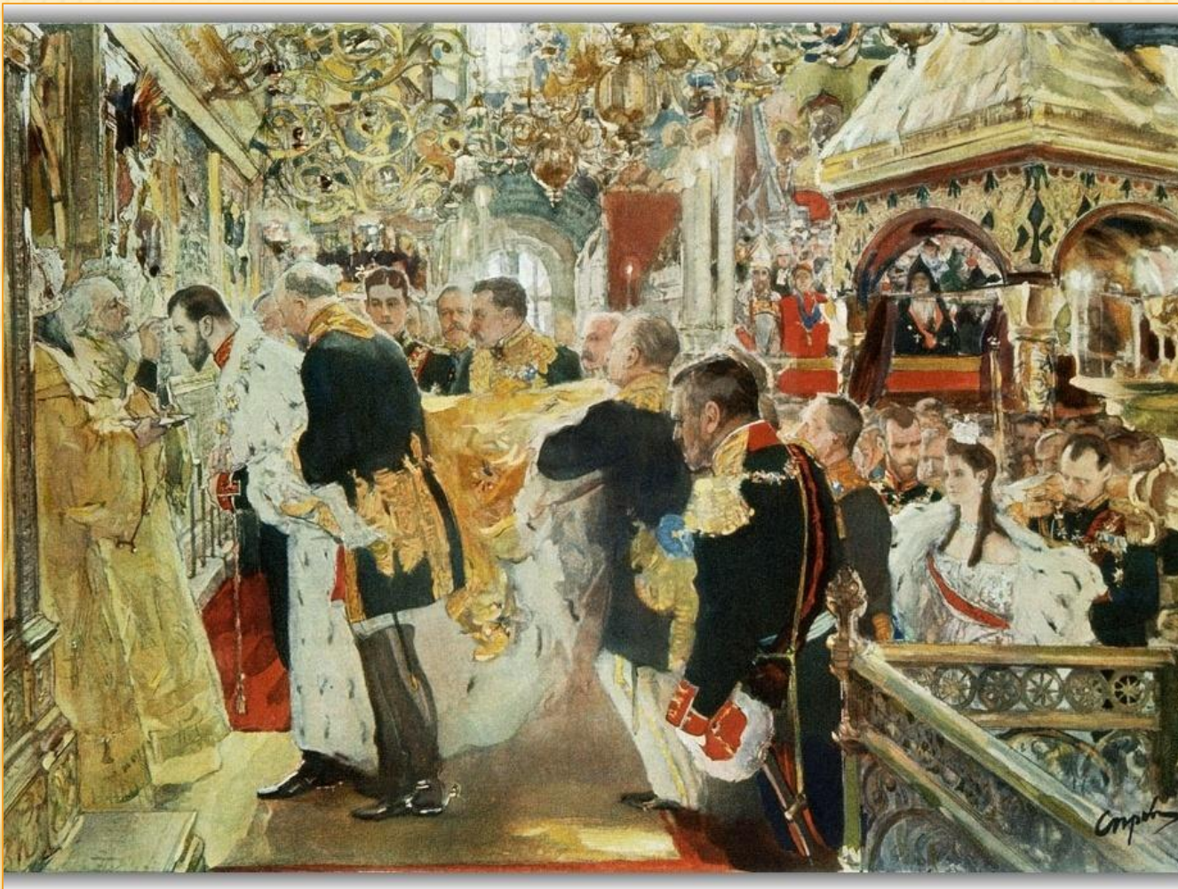
Миропомазание императора Николая Александровича 1896