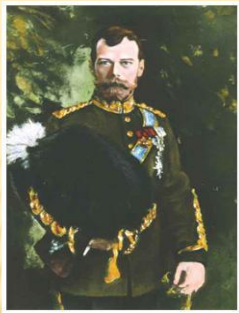
Портрет Николая II