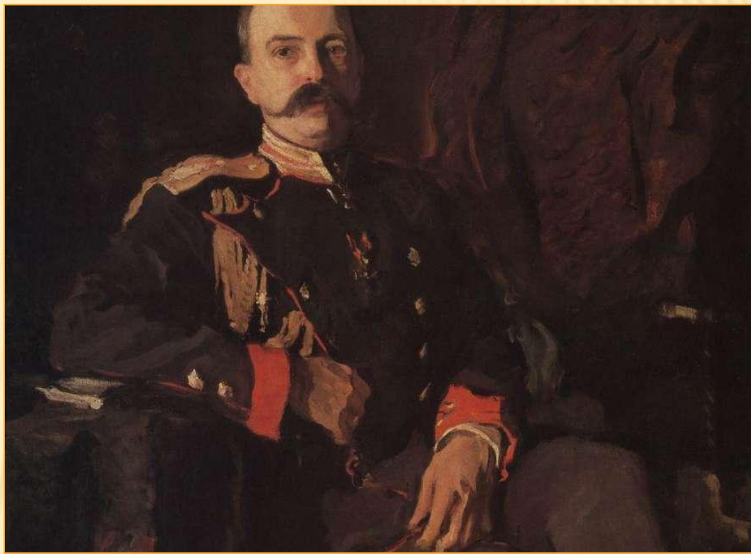
Портрет великого князя Георгия Михайловича 1901 год