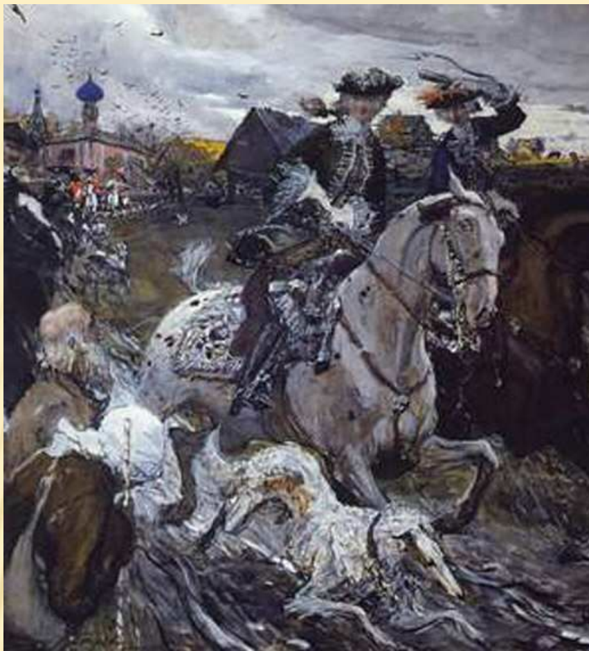
Выезд Петра II и царевны Елизаветы Петровны на охоту 1900год