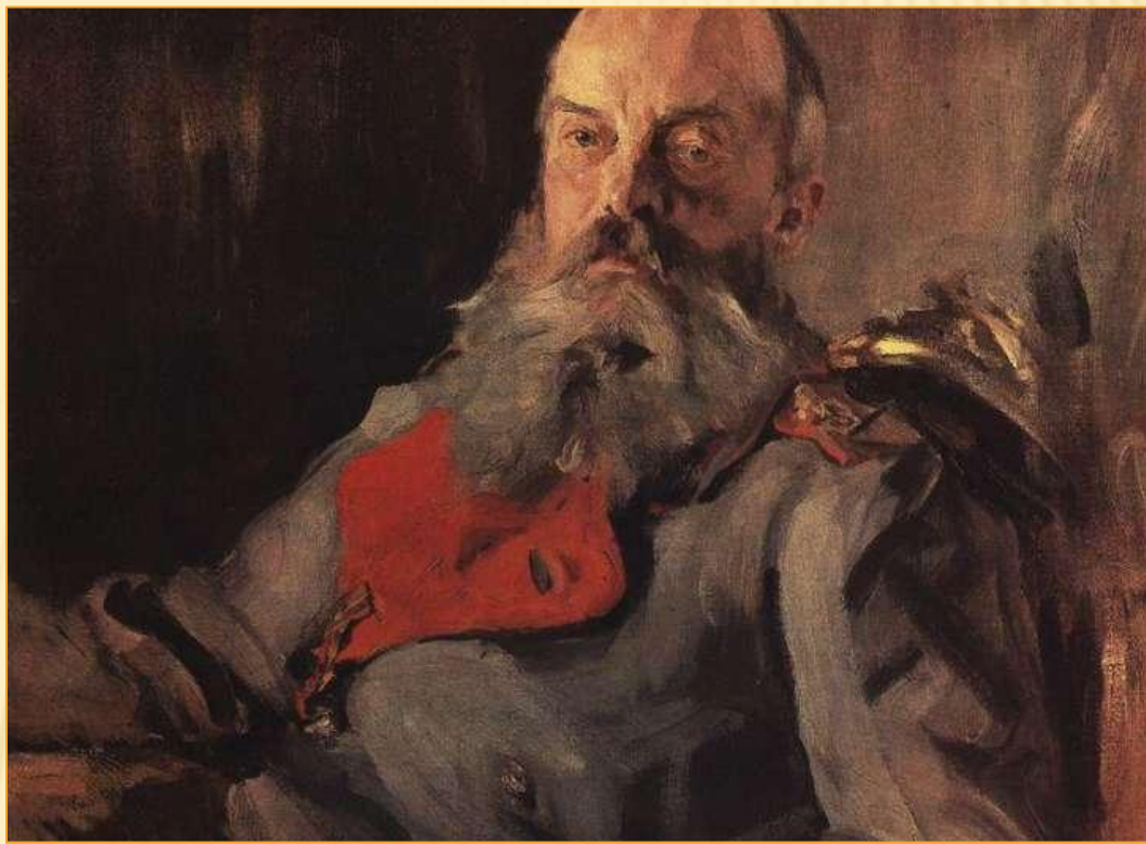
Портрет великого князя Михаила Николаевича в тужурке 1900 год