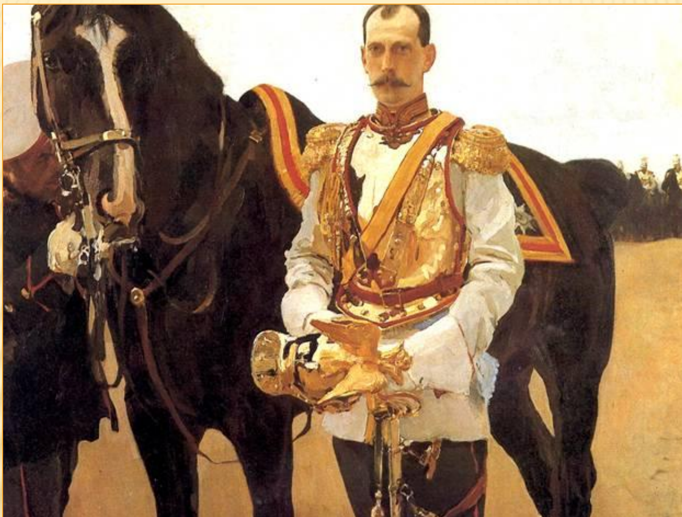
Портрет великого князя Павла Александровича 1897 год