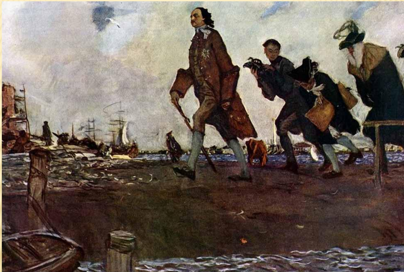
Пётр I 1907