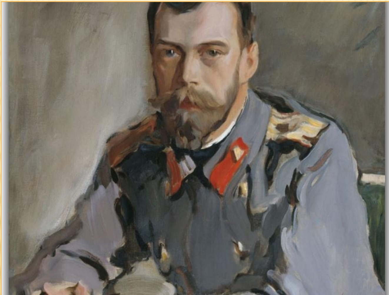
Портрет Николая II