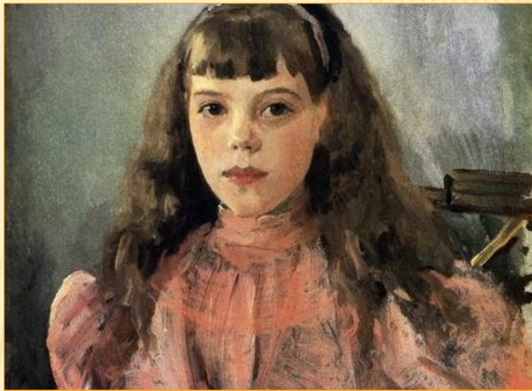
Портрет великой княжны Ольги Александровны.