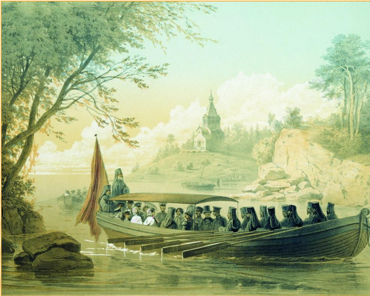
Семья Александра II с Августейшим семейством