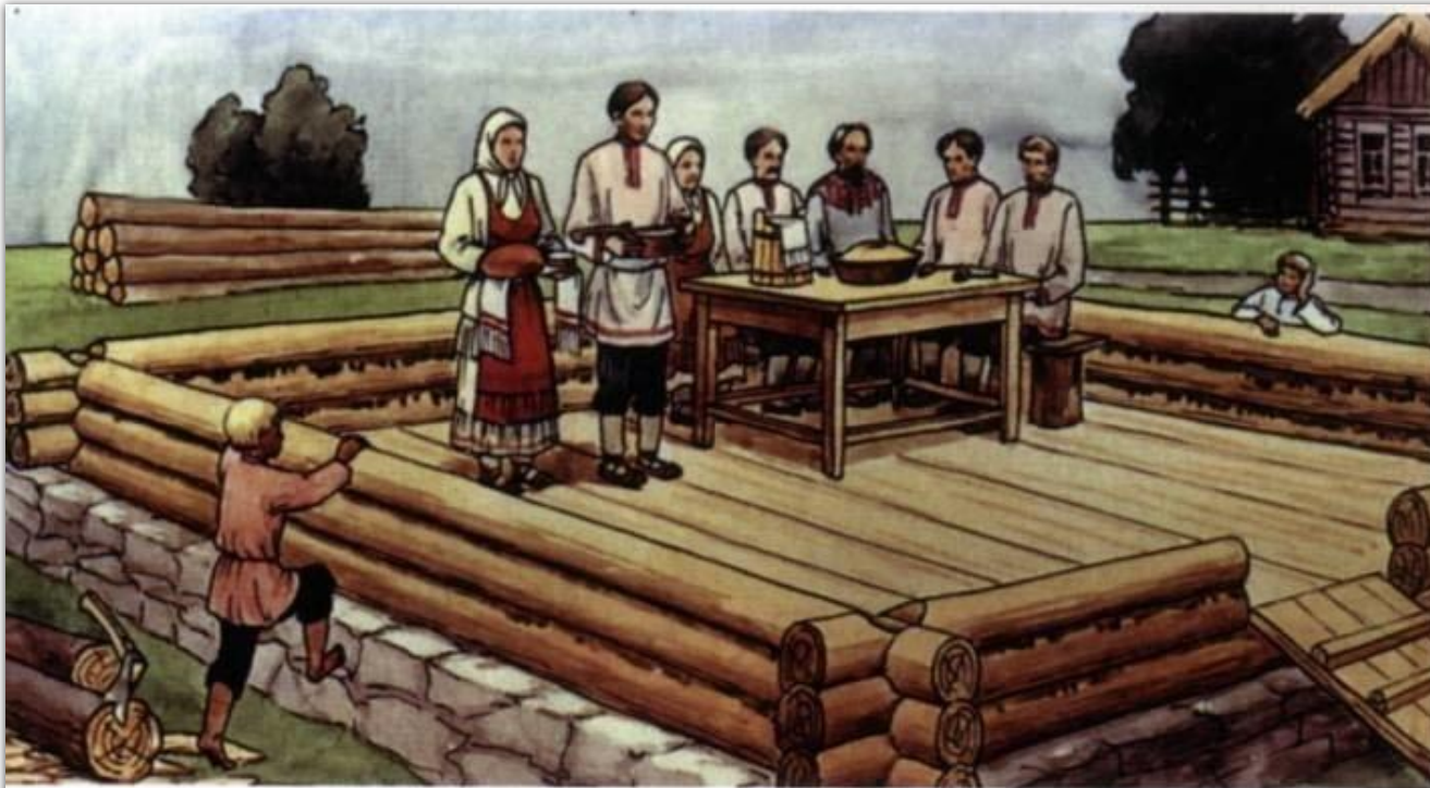
Обряд по случаю закладки дома. Худ. А. Алимасов