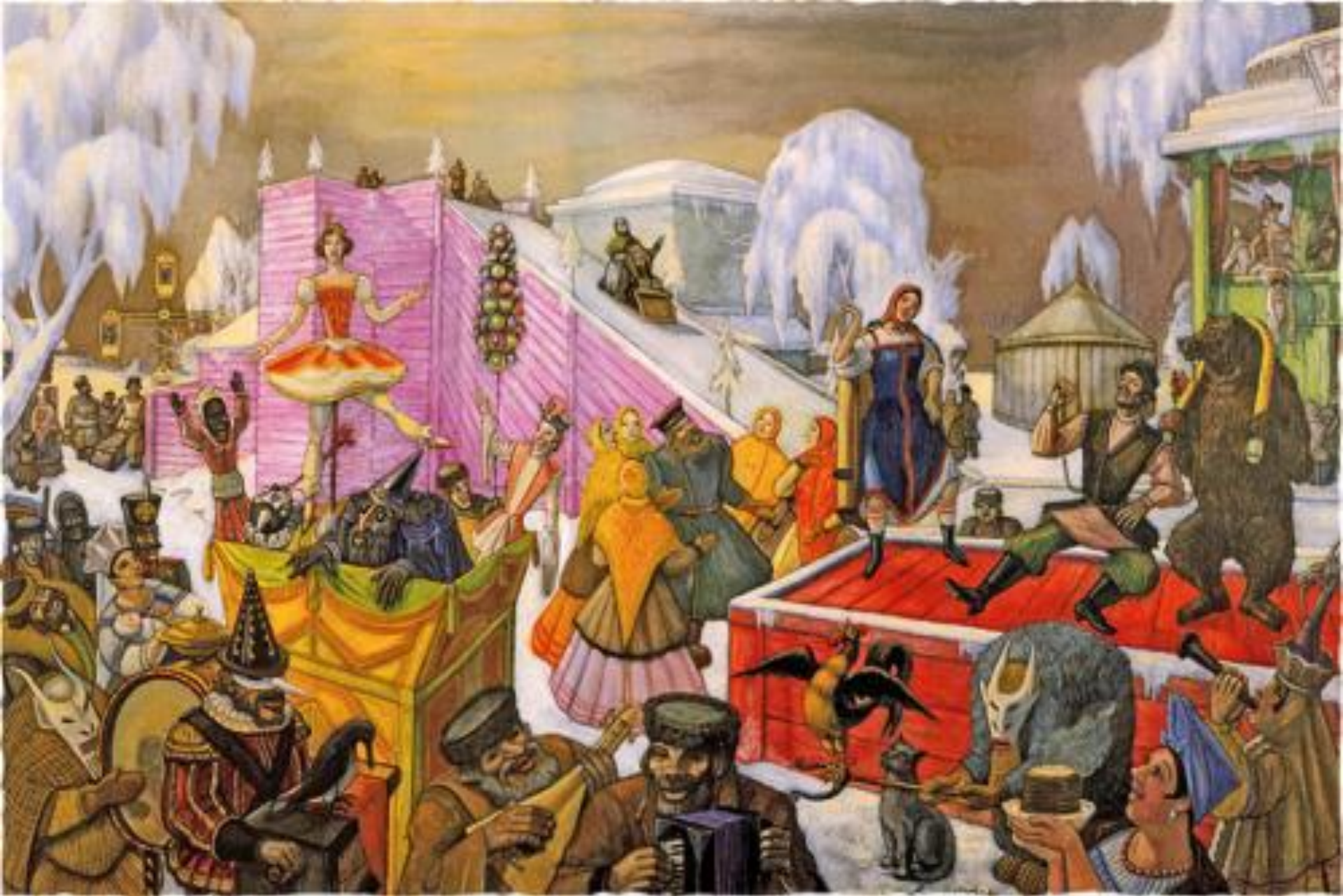
С. Судейкин. Масленица. 1923-1924