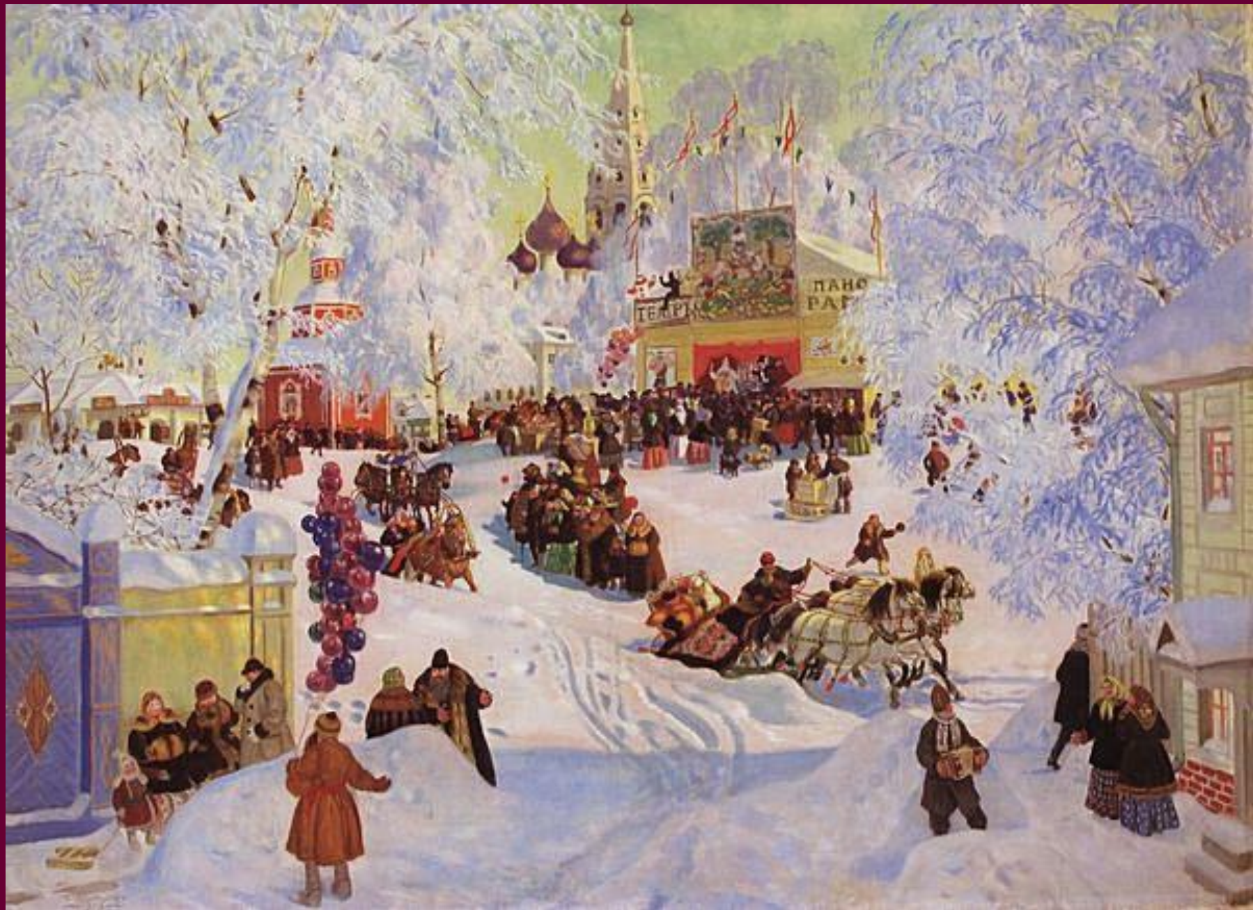
Борис Михайлович Кустодиев. Гулянья на Масленицу