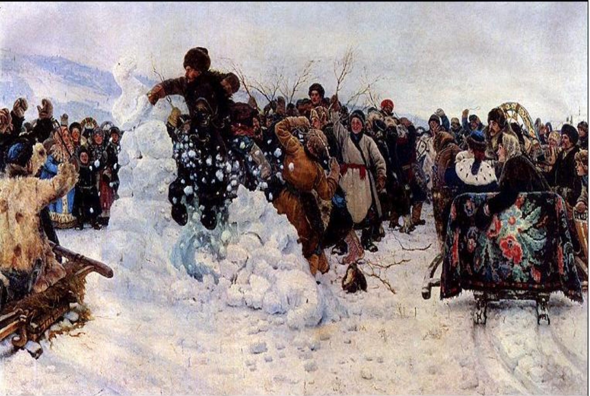
В.И. Суриков. Взятие снежного городка. 1891