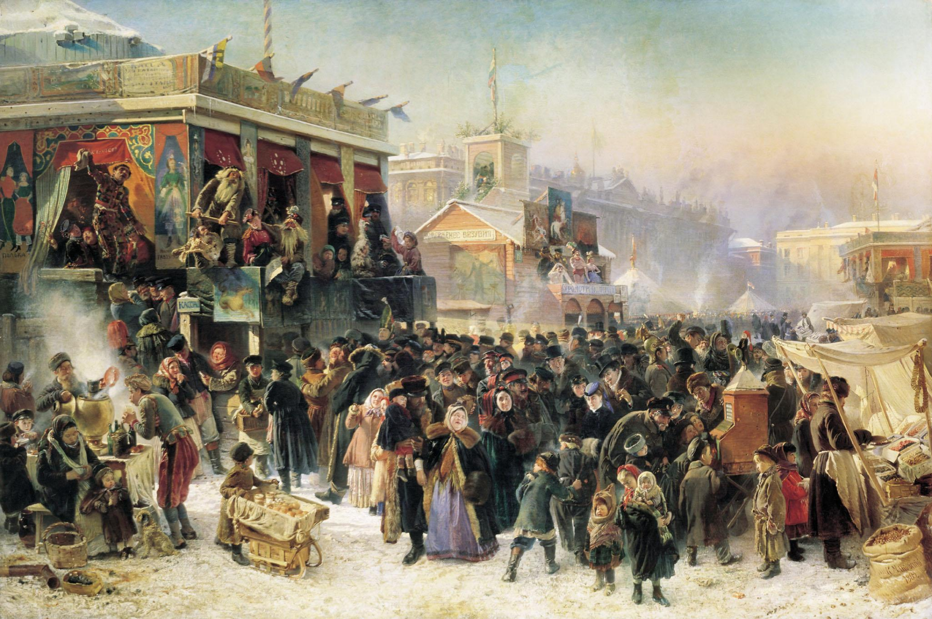
К.Е. Маковский Народное гуляние во время Масленицы на Адмиралтейской площади в