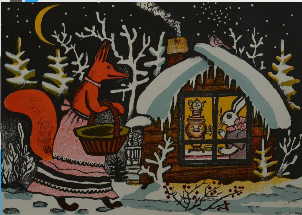
Юрий Васнецов: иллюстрация к сказке «Заюшкина избушка»