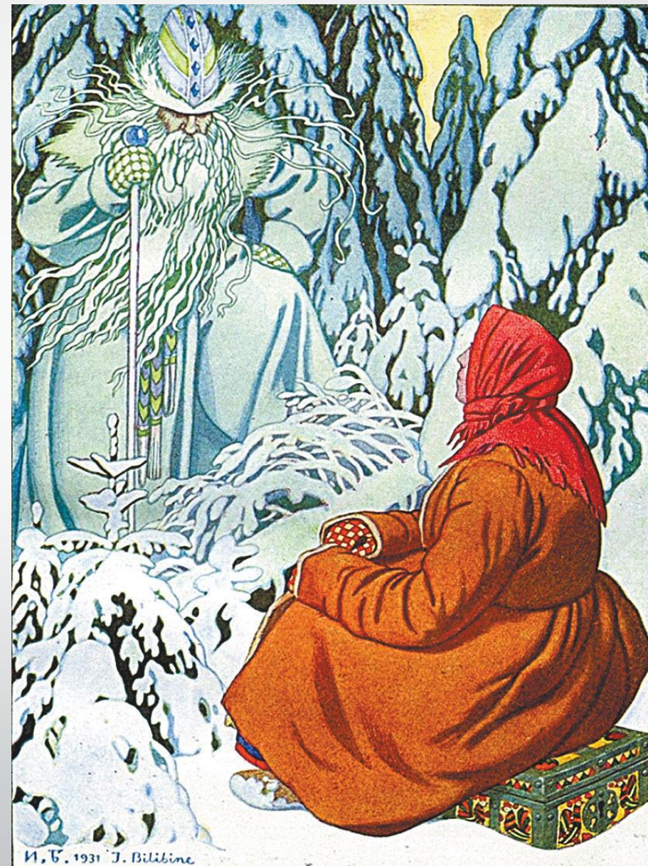
Иван Билибин: иллюстрация к сказке «Морозко»