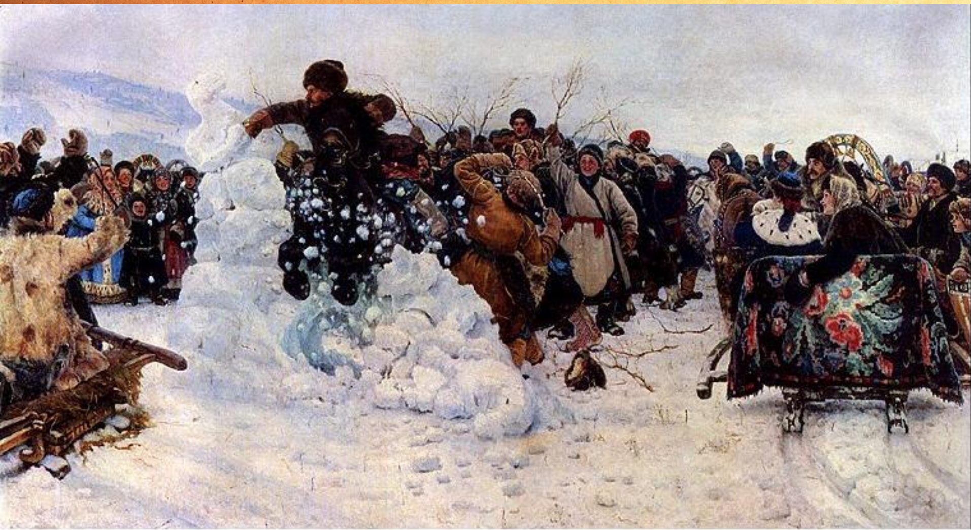
В.И. Суриков. Взятие снежного городка. 1891