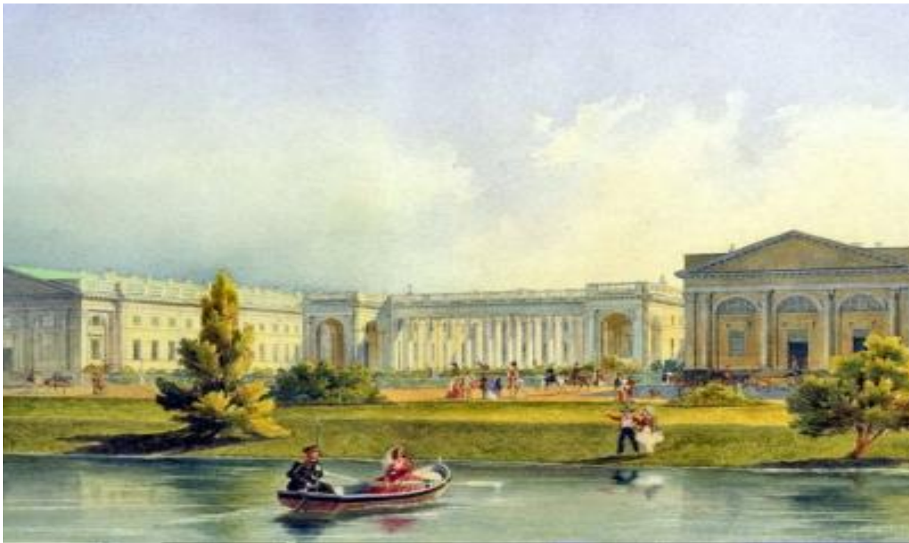
Картина «Александровский дворец». Художник А.М. Горностаев. 1847. Из коллекции музея Эрмитаж.