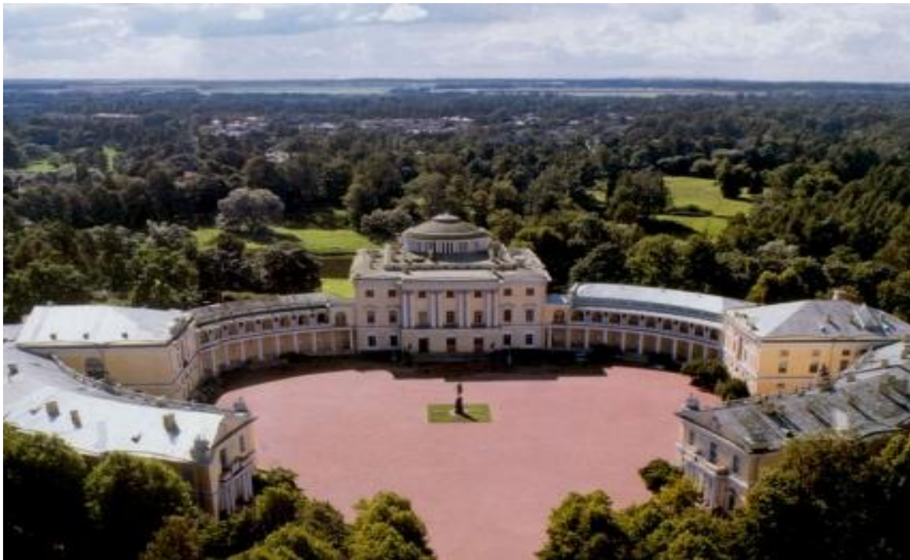
Павловский ансамбль. Архитектор Камерон.