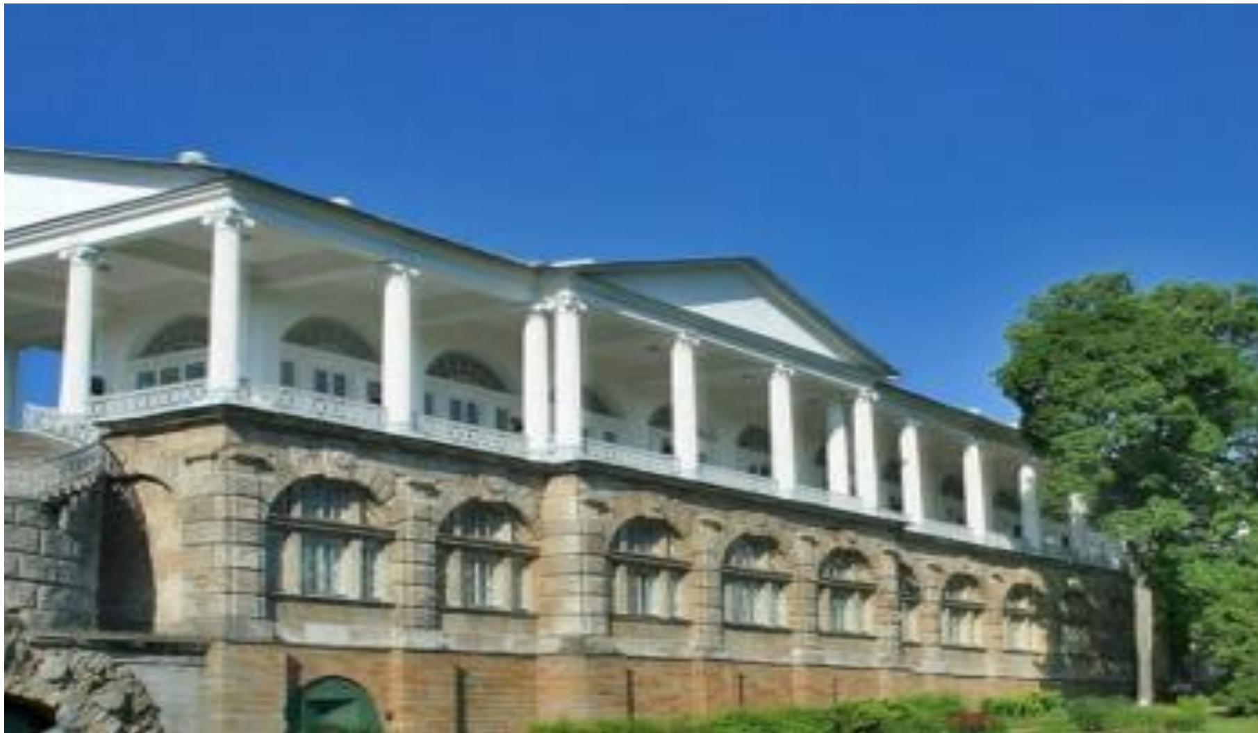
Чарльз Камерон Камеронова галерея.