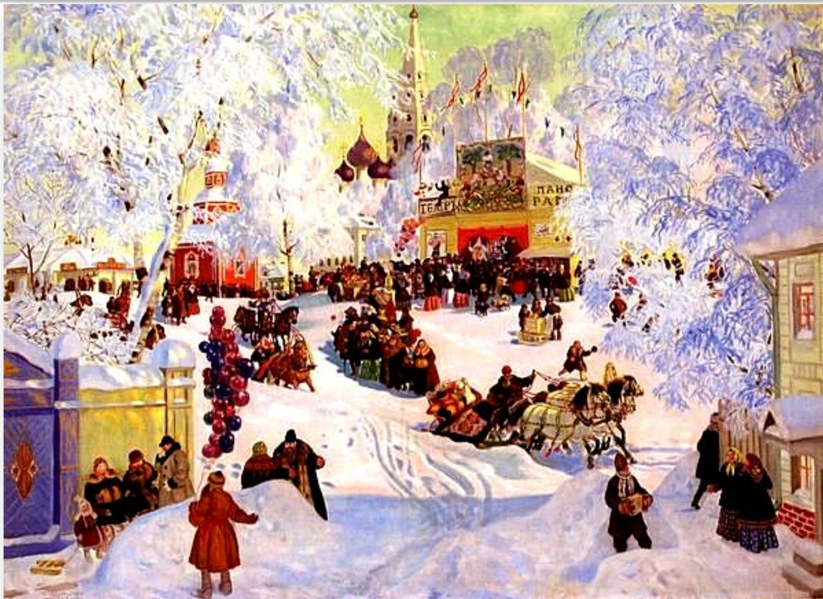
Борис Михайлович Кустодиев "Масленица"