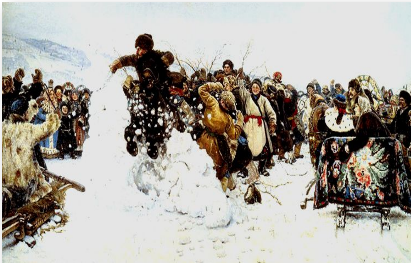
Василий Иванович Суриков «Взятие снежного городка»

Ребята сооружали снежные горы и брали штурмом снежный городок, символизирующий владения зимы