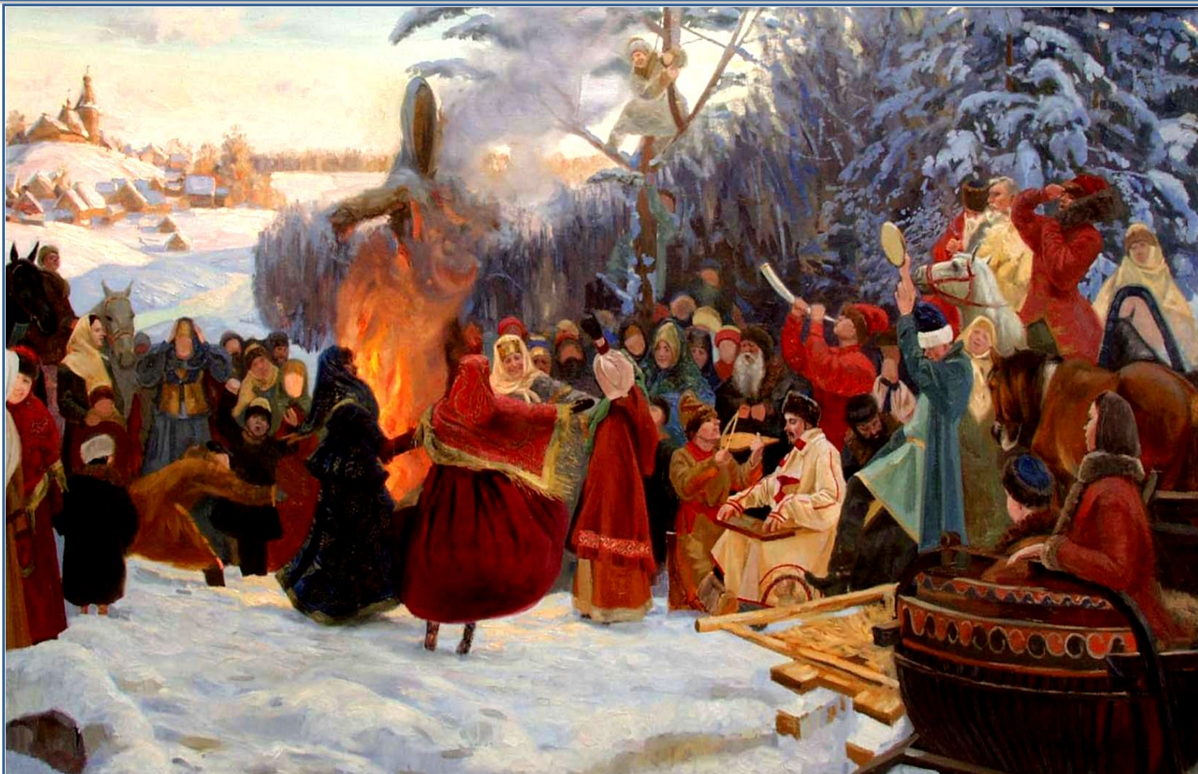
Семён Леонидович Кожин "Масленица. Проводы. Россия 17 век»