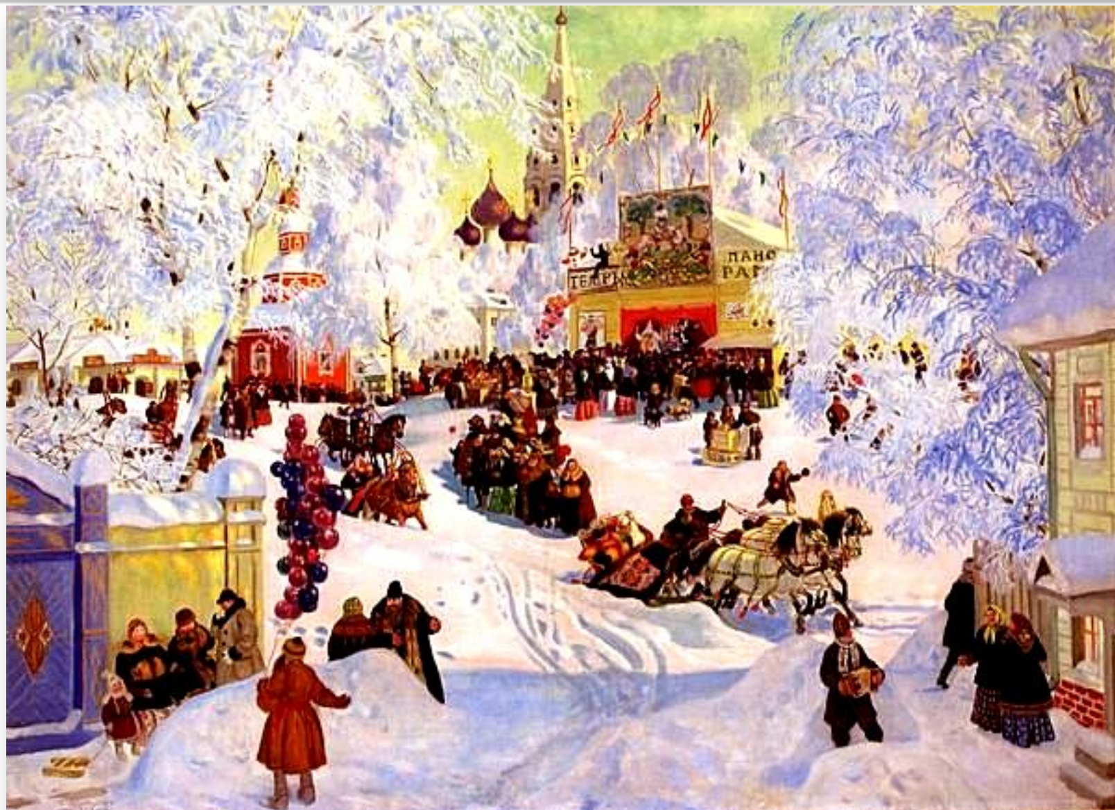
Борис Михайлович Кустодиев "Масленица"