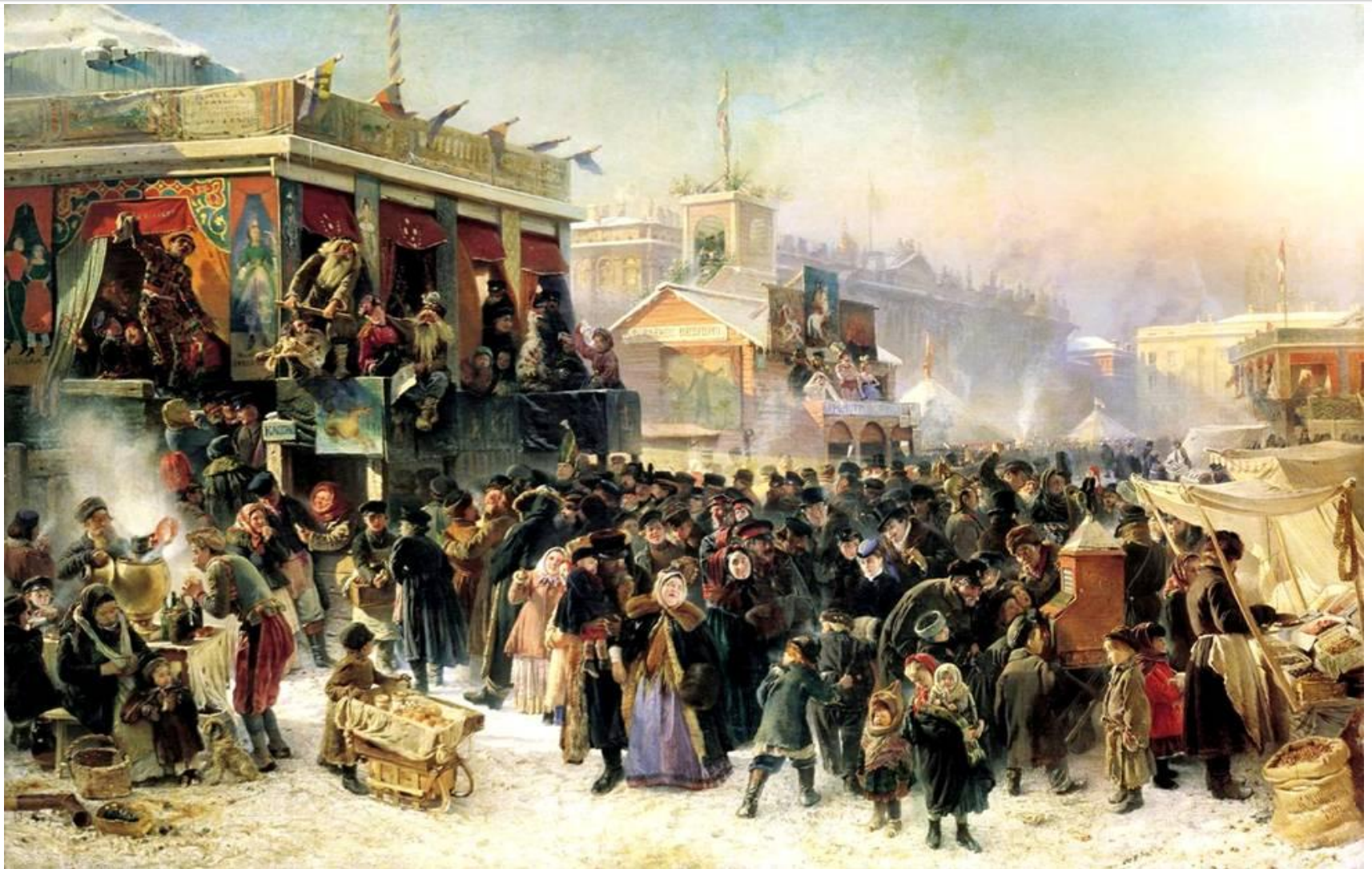
Константин Егорович Маковский «Народное гуляние во время Масленицы на Адмиралтейской площади в Петербурге»