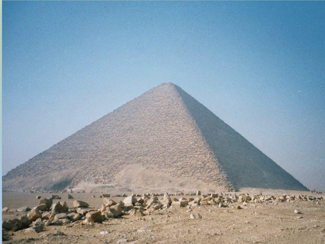
Розовая пирамида в Дахшуре