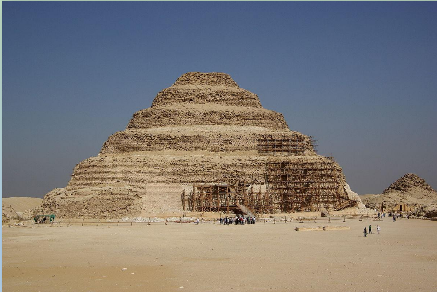
Самая старая пирамида Джосера, арх. Имхотеп.