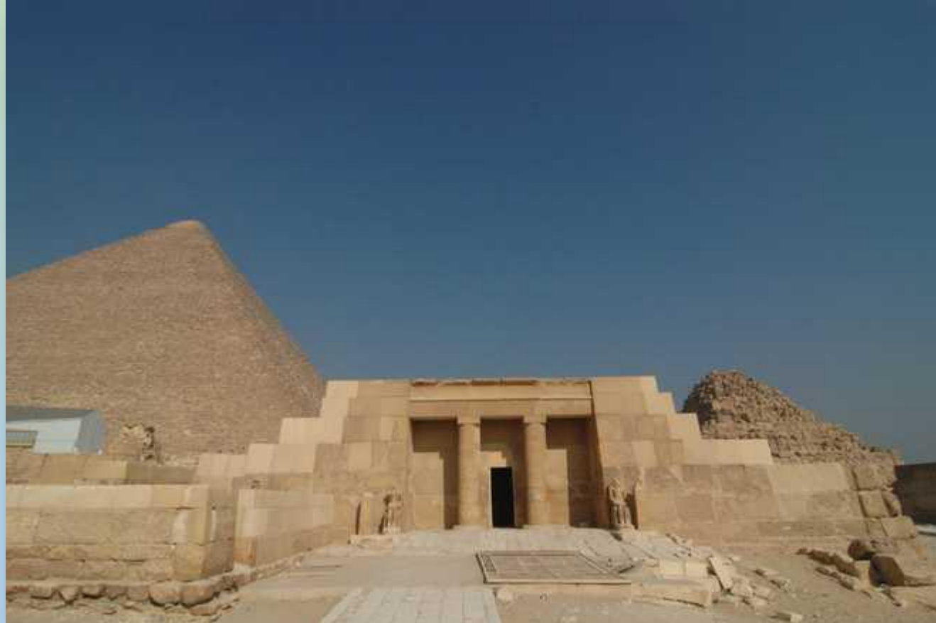
Мастаба Сешемнефера IV. Плато Гиза