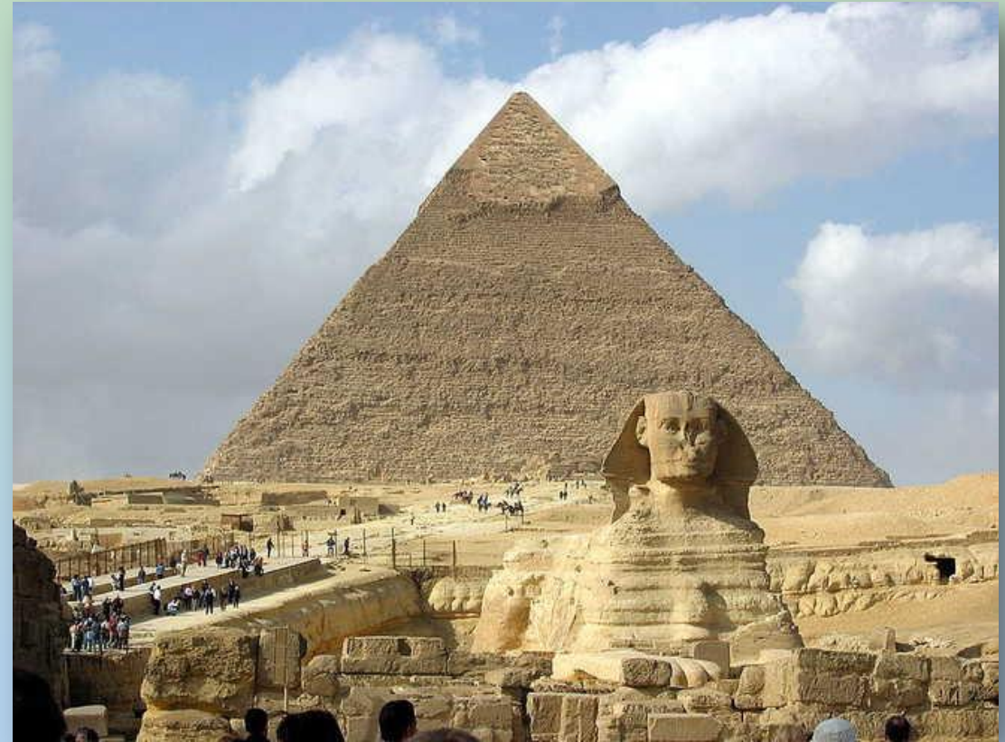
Большой Сфинкс. Египет

Памятник находится в некрополе Мемфиса рядом с пирамидальными строениями Хуфу (Хеопса), Хафра (Хефрен) и Менкаура (Мицерин) примерно в 10 км от Каира, на западном берегу реки Нил на плато Гиза.