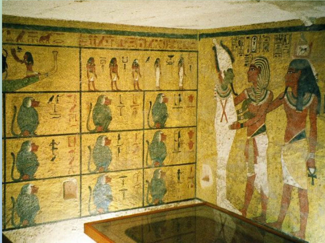
Архитектура Древнего Египта: Долина царей. Захоронение Тутанхамона.

Во время, начиная с 1500 и по 1069 гг. до р.Х. правители и вельможи устраивали свои гробницы в так называемой Долиной царей, предположительно, чтобы предотвратить грабеж своих усыпальниц. Это место ныне признано Юнеско объектом Всемирного Наследия.