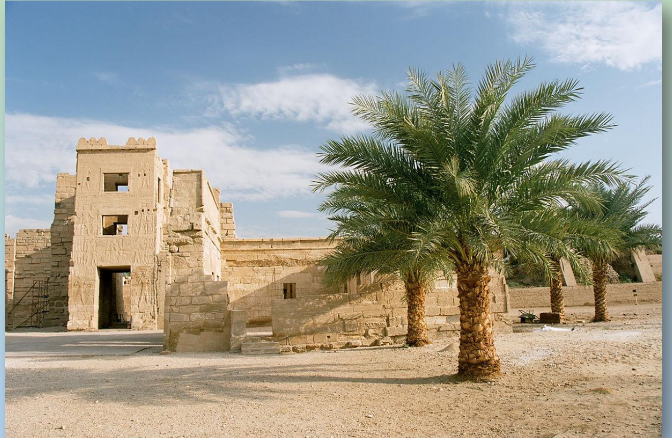
Храм Мединет Абу в Луксоре в честь Рамсеса III (прибл. XII в. до р.Х.)

Самый сохранившийся из таких дворцово-храмовых комплексов находится в Мединет-Абу . Он был построен Рамсесом III в течение двадцатой династии, около 1150 г. до н.э.. Когда фараон приезжал из своей главной резиденции в дельте Нила, то располагался во дворце рядом с храмами для поклонения Рамсесу III и богу Солнца Амону. Также в комплекс входили склады и жилища для жрецов.