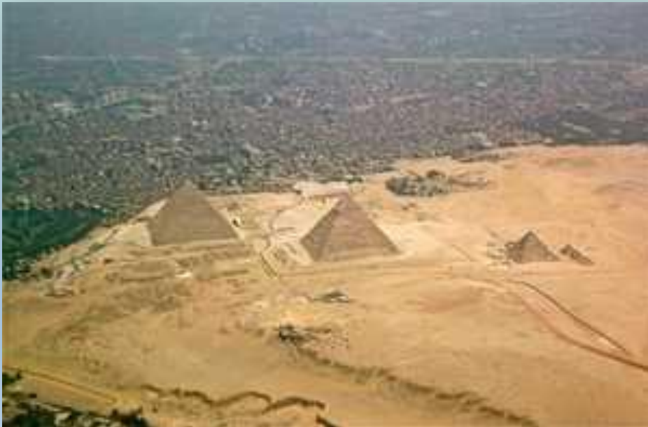
Пирамиды Гиза. Архитектура Старого (или Древнего) Царства Древнего Египта

Пирамиды были построены как гробницы фараонов с примерной датировкой с 2613 по 2467 до р.Х. Эти архитектурные сооружения стали первым чудом из семи чудес Света. Самая известная — Великая Пирамида в Гизе или пирамида Хеопса.