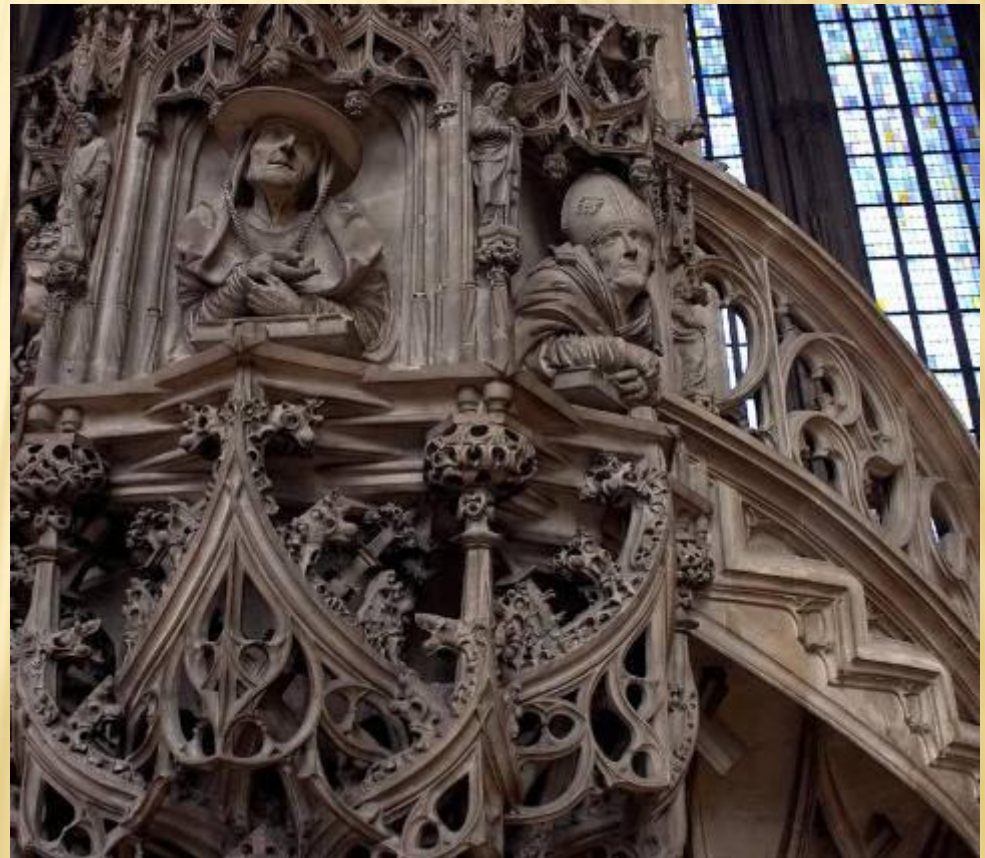
Резьба по камню XVI века

а. Резьба по камню - процесс придания камню требуемой формы и внеш. отделки при помощи распиловки, токарной обработки, сверления, шлифовки, полировки, гравировки (резцом, ультразвуком).