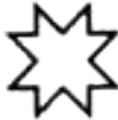
Хёвел - солнце