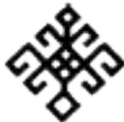
Пурнайс йываёё - древо жизни