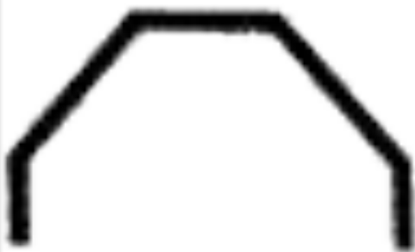
Тёнче - вселенная