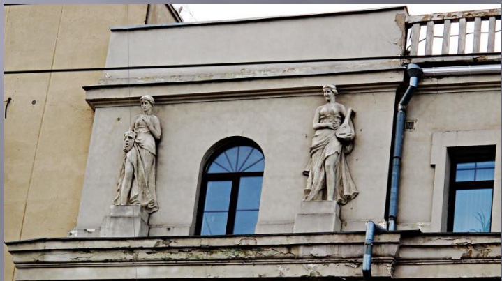
Проспект Революции, д. 56 , здание кинематографа