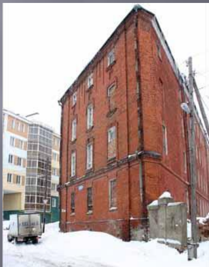
Большая Манежная, д. 13 . Казарма 25 -го пехотного Смоленского полка имени генерала Н.Н. Раевского.