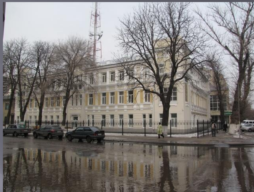
Воронежская областная клиническая офтальмологическая больница. Воронеж, ул. Революции 1905 г., 22. .