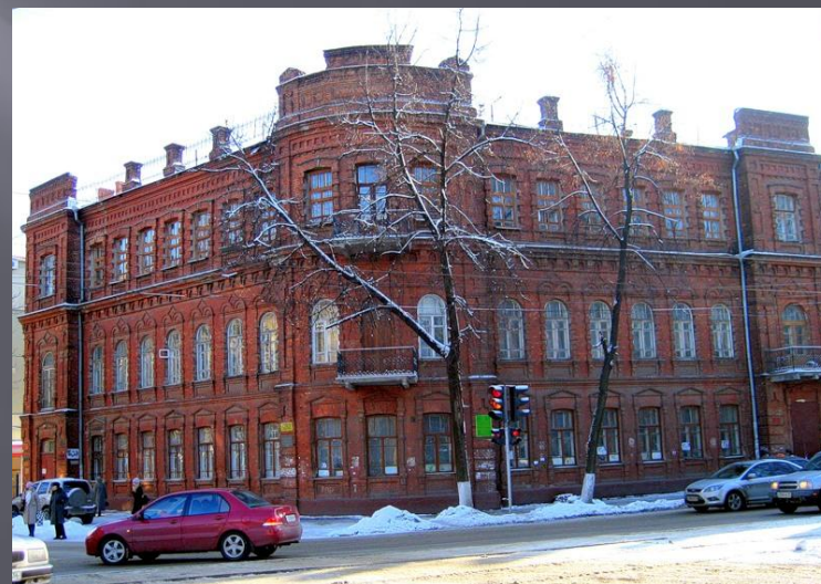
Жилые дома на улице Никитинской и Комиссаржевской.