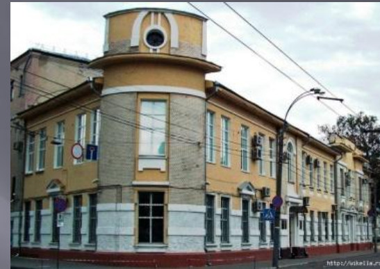
улица Орджоникидзе 41 , здание Дворянского и крестьянского банка.