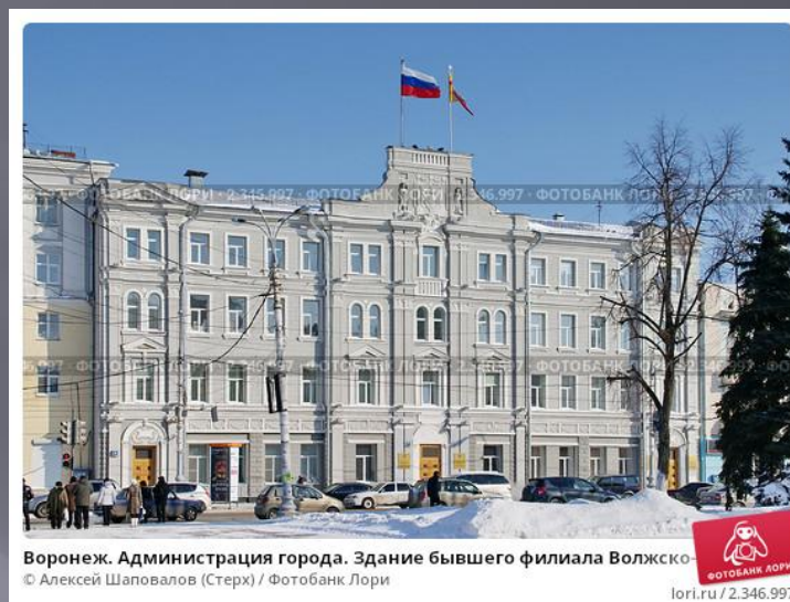
Воронеж. Администрация города. Здание бывшего филиала Волжско-Камского банка