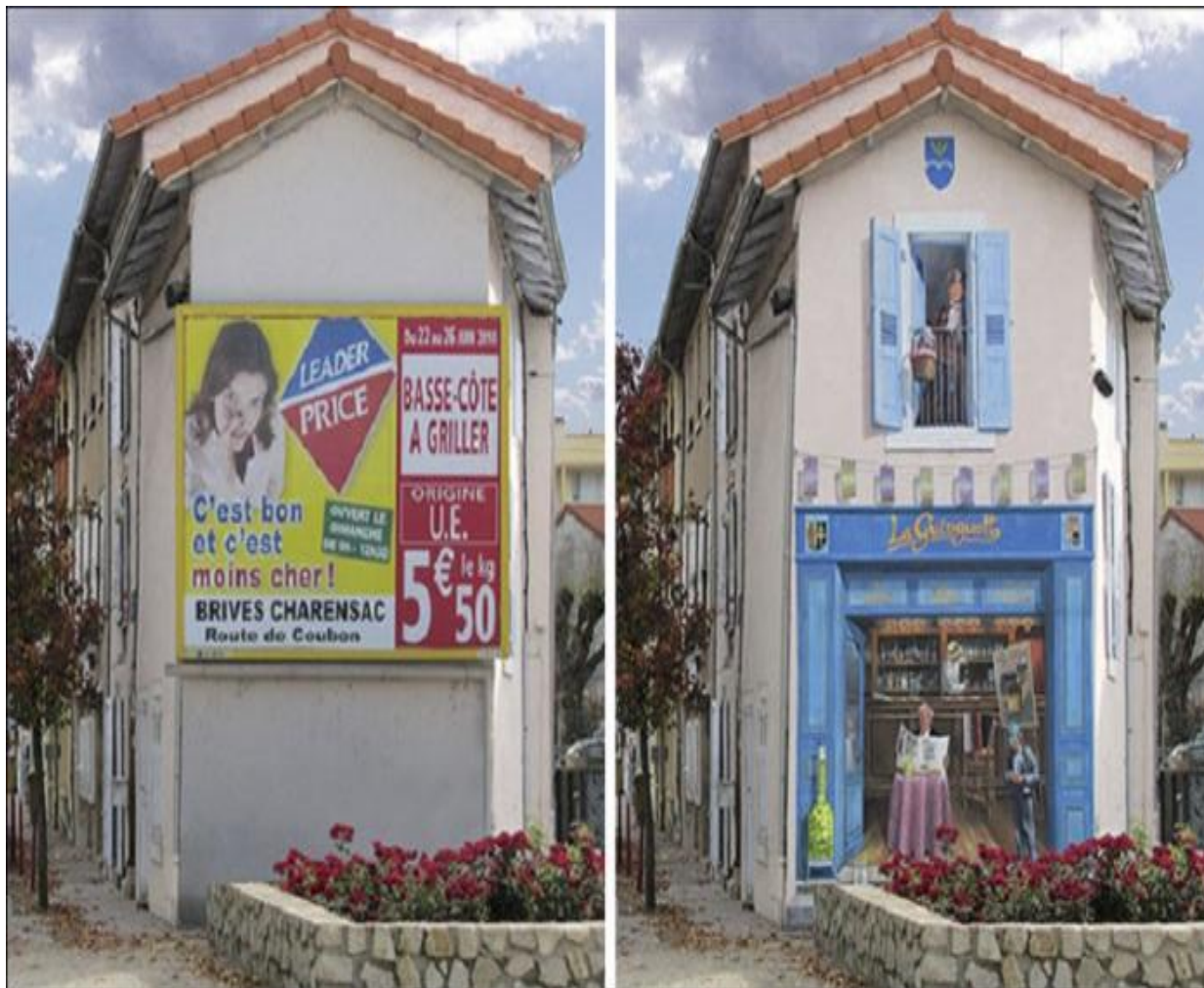
Яркая реклама магазина.