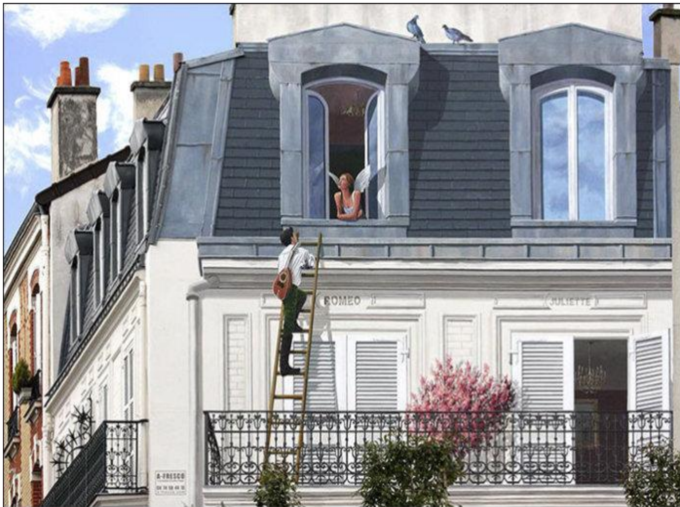
Фрагмент из «Ромео и Джульетты».