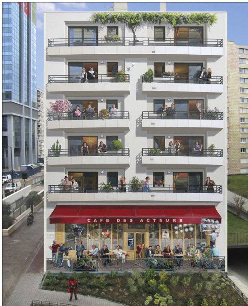
Реалистичное изображение жителей дома.