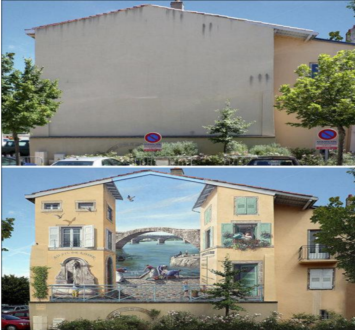
Вид на набережную.