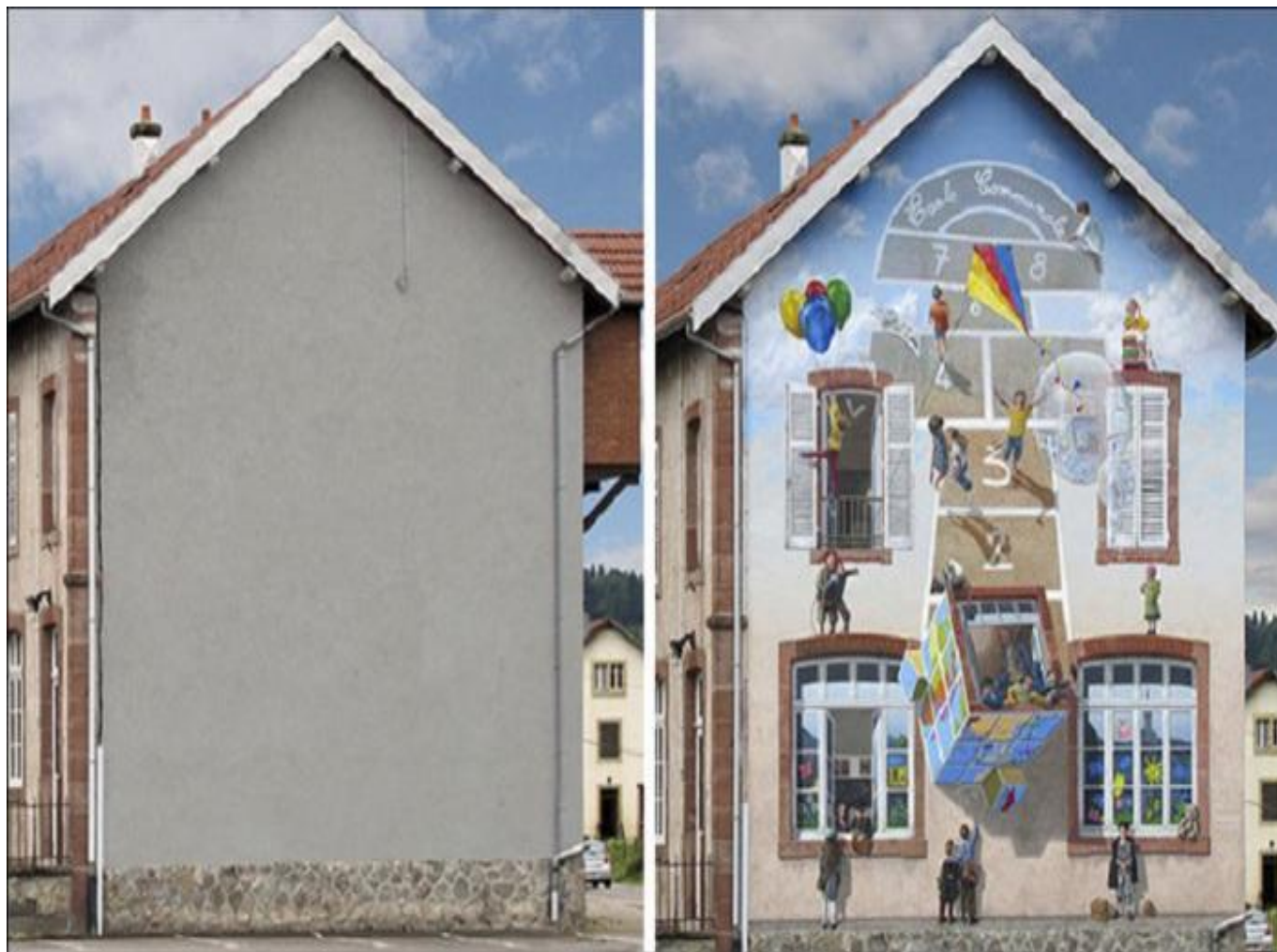
Счастлиное детство на стене дома.