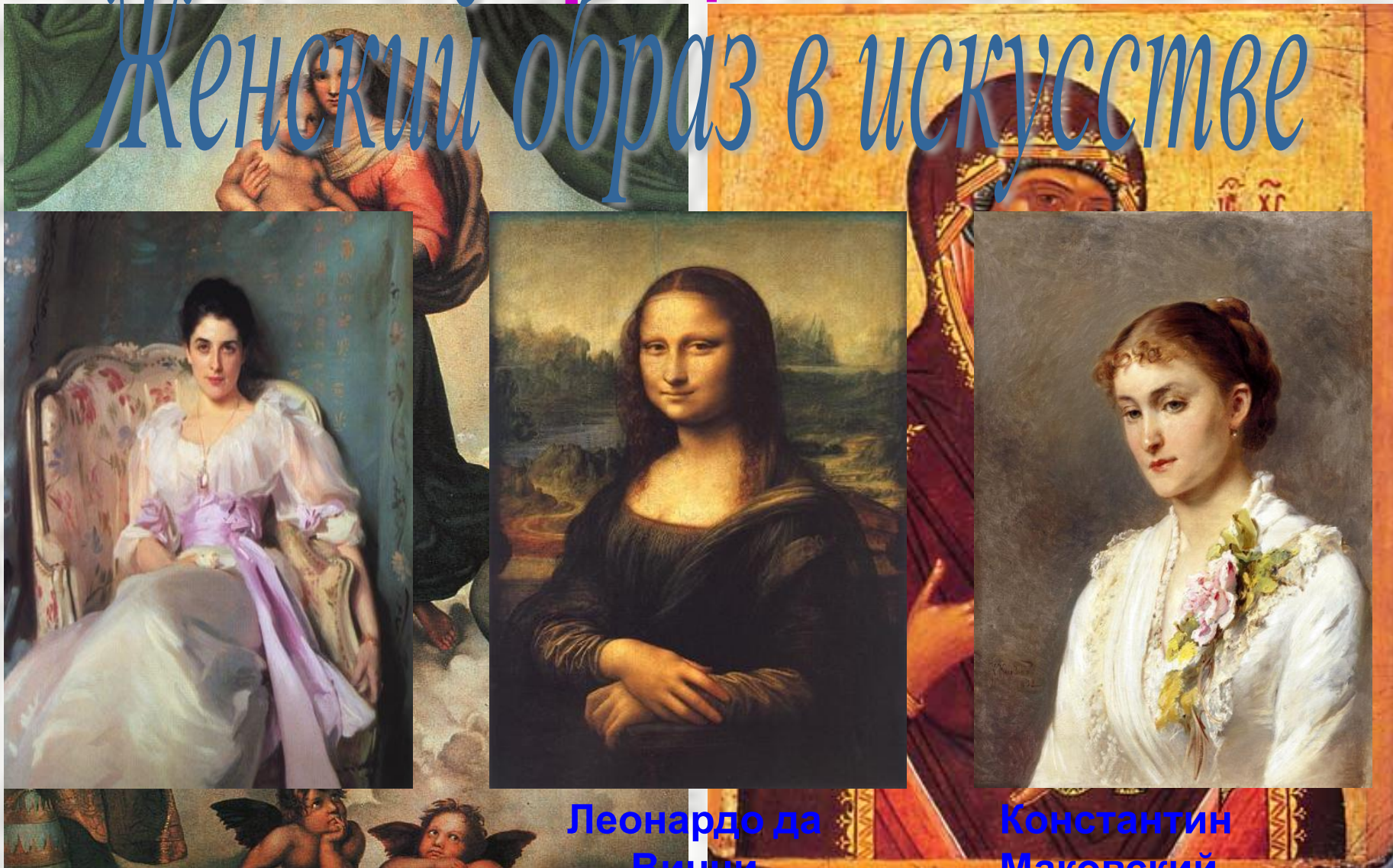
Леонардо да Винчи